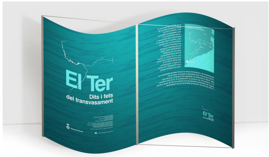
PEÇA 1 - PLAFÓ 0