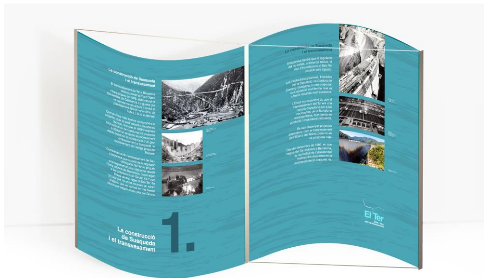
PEÇA 1 - PLAFÓ 1 i 2