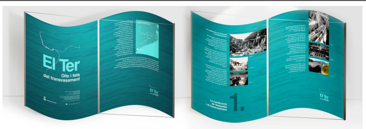
PECES 0 i 1