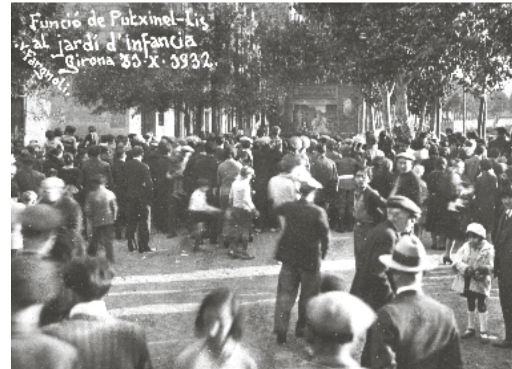
Funció de pubxinel·lis amb espectadors al Jardí de la Infància de Girona. Al fons, el riu Onyar, Girona, 1932.

[1916] Col·labora amb l'Arxiu Mas de Barcelona en diverses campanyes per a la creació de l' Inventari Iconogràfic de Catalunya , una iniciativa de l'Institut d'Estudis Catalans per documentar i catalogar el patrimoni cultural.