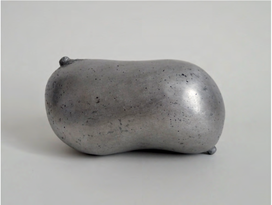
Mama , 2016 Fosa d'alumini 20 x 13 x 15 cm, 2,2 kg