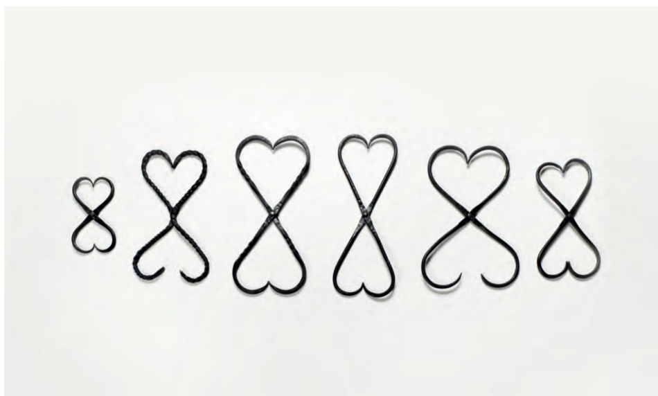
Batecs , 2017 Ferro forjat 50 x 160 cm