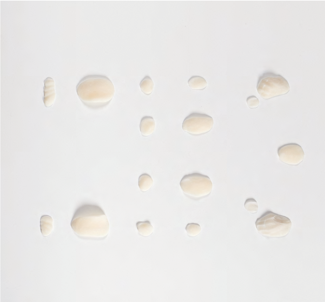
Exvots , 2017 Porcellana freda Mides variables