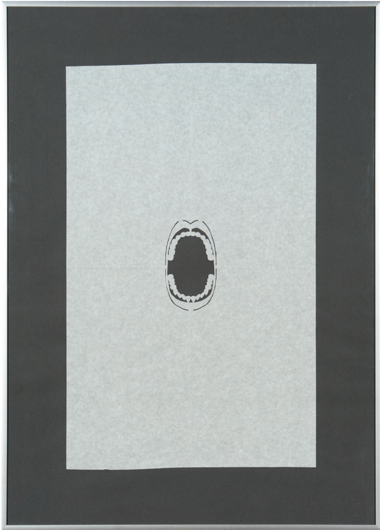
Boca , 2013 Paper doblegat i retallat 70 x 50 cm