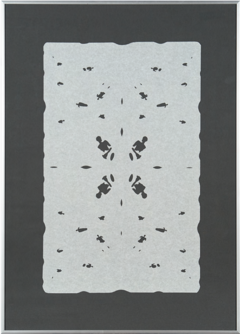
Cossos , 2013 Paper doblegat i retallat 70 x 50 cm