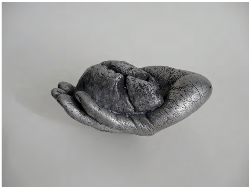
Rocam , 2016 Fosa d'alumini 15 x 7 x 8 cm, 766 g