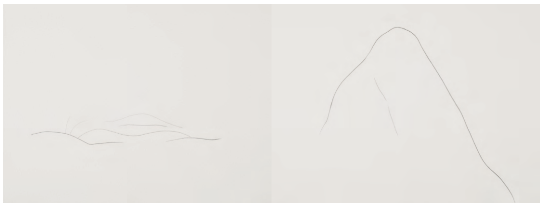
Carena , 2015 Grafít sobre paper 29,7 x 42 cm c/u. Total: 29,7 x 378 cm