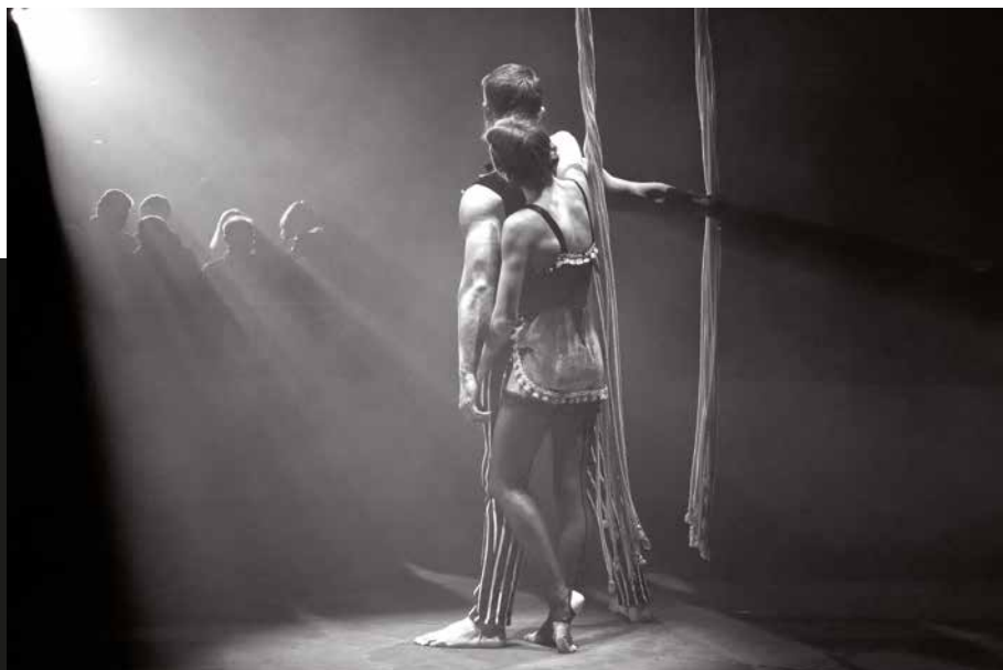
Llum i ombres en un circ (Figueres, febrer de 2017). Àngel Reynal