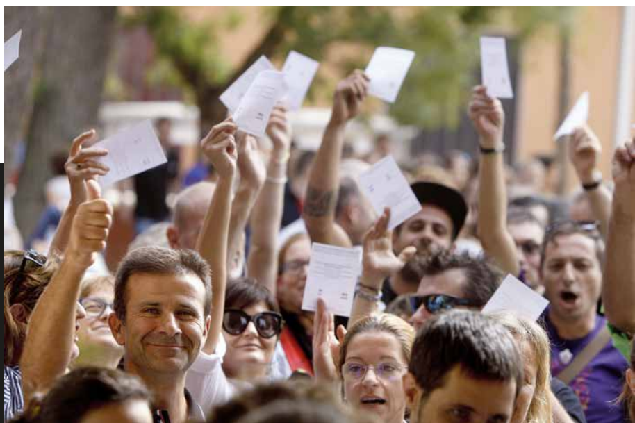
Votarem (Peralada, 1 d'octubre de 2017). Lluís Serrat

Jornada del referèndum 1-O: repressió policial a Sant Julià de Ramis i gent esperant per votar al col·legi electoral de Peralada. El jurat va elegir la sèrie com a finalista per la seva narrativa, ja que, amb poques imatges, «explica la intensitat d'aquest moment».