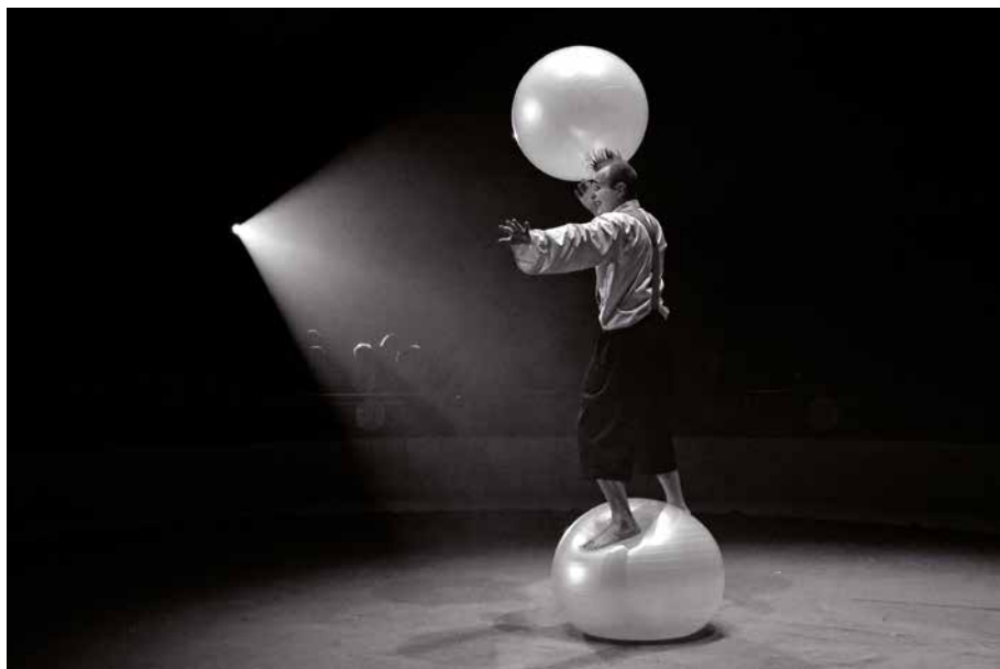
Llum i ombres en un circ (Figueres, febrer de 2017). Àngel Reynal