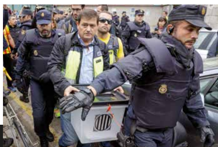
1-O (Girona, 1 d'octubre de 2017). David Borrat

Les fotos recullen l'intent dels ciutadans d'evitar que la Policia Nacional confiscés les urnes per al referèndum, al col·legi Joan Bruguera, de Girona. El jurat va elegir aquesta sèrie com a finalista per «la proximitat als fets» i pel «nivell tècnic que demostra».