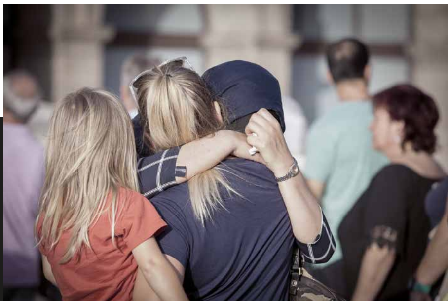
Ripoll contra el terrorisme (26 d'agost de 2017) . Marc Sanye

«En els atemptats que hi va haver a l'agost a Barcelona i a Cambrils, tots els terroristes eren de Ripoll, una vila que va quedar commocionada en conèixer-se la notícia. Una gran manifestació contra el terrorisme va tenir lloc a la capital del Ripollès per rebutjar aquells atacs i mostrar al món una comunitat musulmana unida.» Marc Sanye