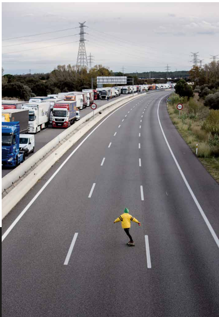
Patinant per l'AP-7 (Borrassà, 8 de novembre de 2017). Carles Palacio

«Un noi patina en un dels trams de l'autopista AP-7 a l'alçada de Borrassà en direcció França, tallada per un dels piquets populars durant la vaga general del 8 de novembre, convocada en defensa de la República Catalana i dels resultats del referèndum de l'1 d'octubre, i per demanar la llibertat dels presos polítics catalans.» Carles Palacio