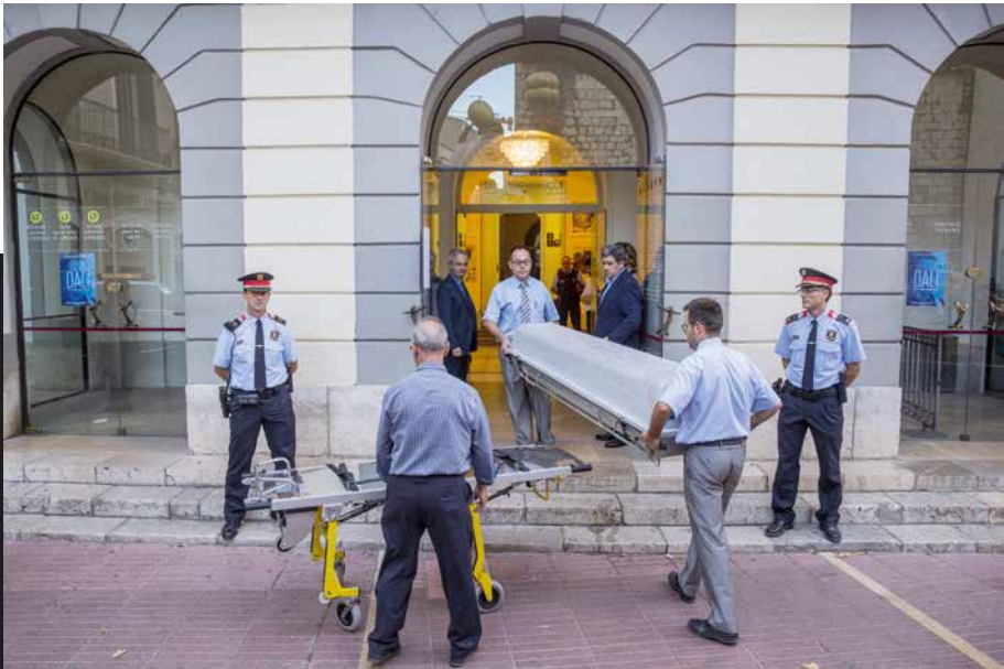
El retorn de Dalí (Figueres, 20 de juliol de 2017). Jordi Ribot