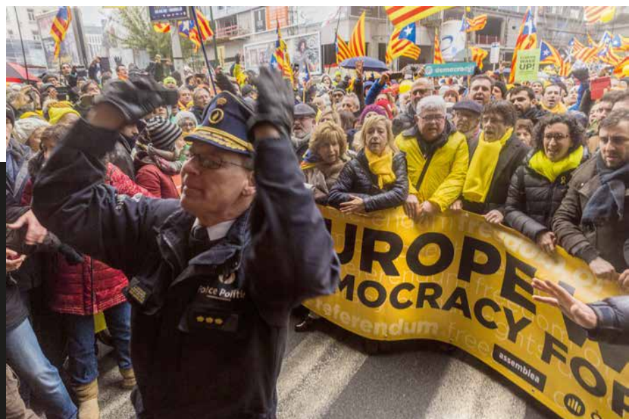
President (Brussel·les, 7 de desembre de 2017). Joan Castro

Milers de catalans van creuar Europa per manifestar-se a Brussel·les en suport del seu govern a l'exili.