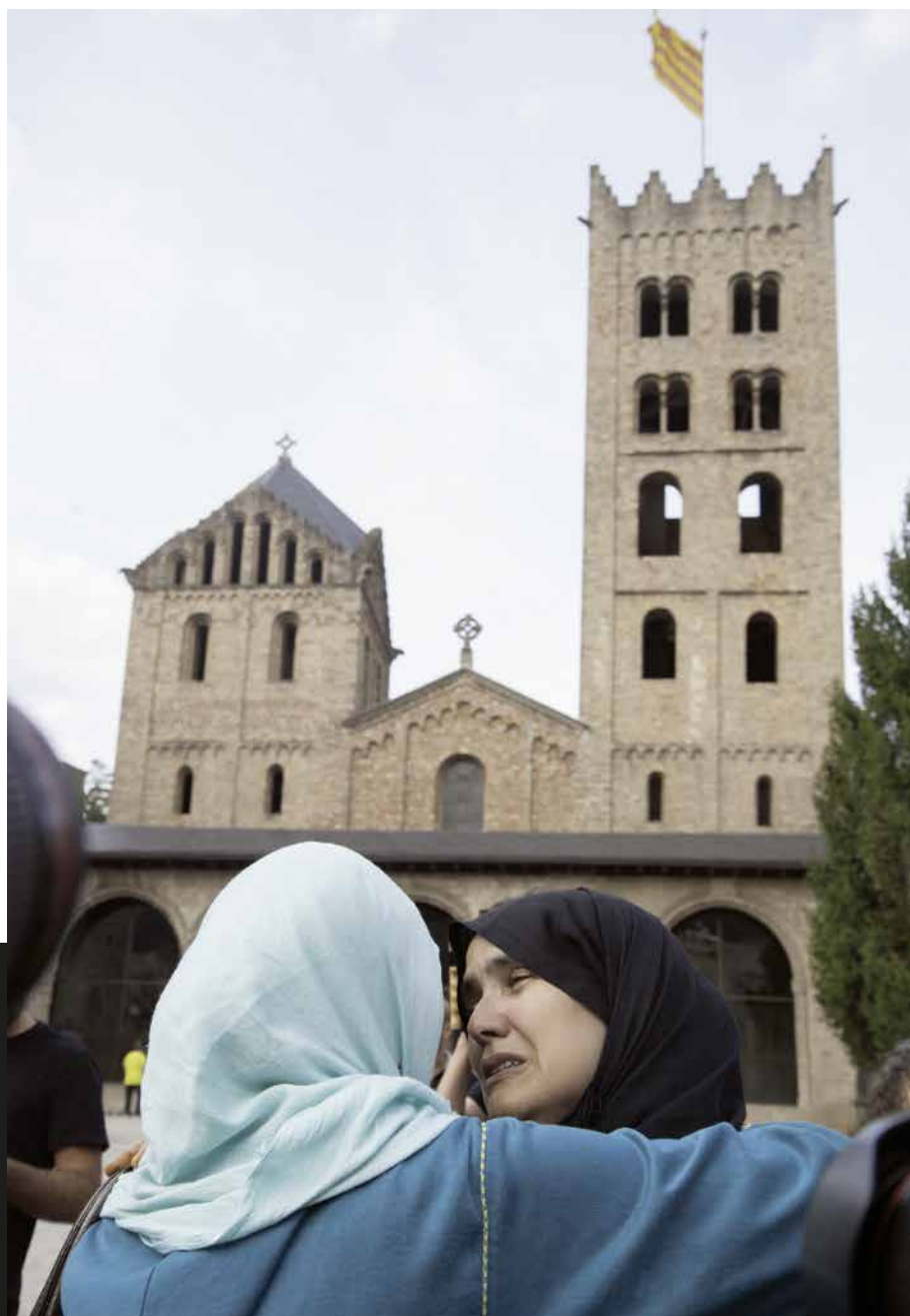
Dolor a Ripoll (19 d'agost de 2017). Robin Townsend

«Aquesta foto forma part del meu treball de nou dies per a l'Agència EFE per documentar els esdeveniments que es van produir a Ripoll relacionats amb els atemptats de Barcelona i Cambrils. Dues dones, familiars molt properes dels joves de Ripoll autors dels atemptats, ploren durant una concentració que va fer la comunitat musulmana davant del monestir per rebutjar els fets i guardar un minut de silenci.» Robin Townsend