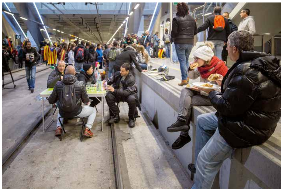
Aturada de l'AVE (Girona, 3 d'octubre de 2017). David Borrat