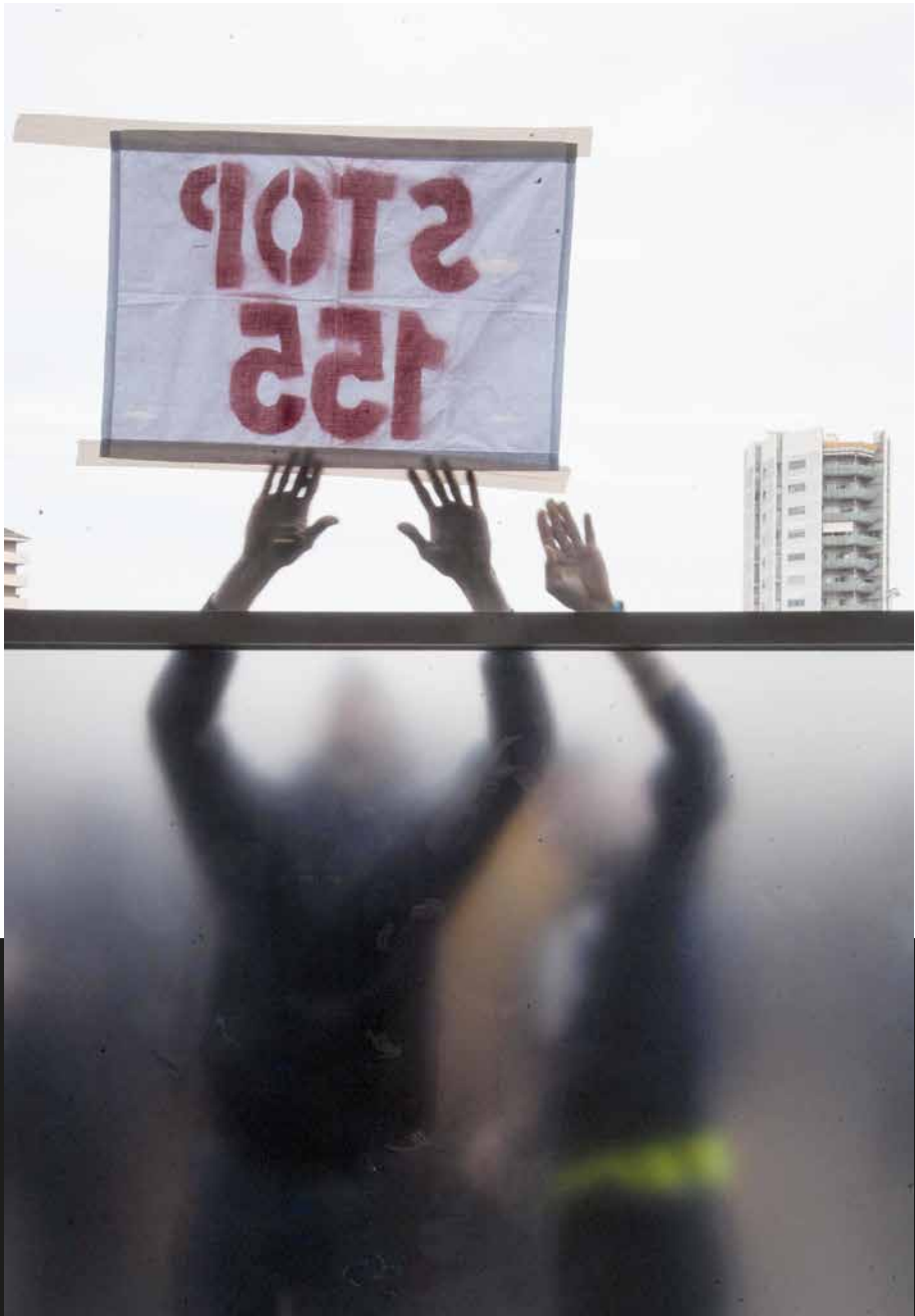
Stop 155 (Girona, 8 de novembre de 2017). Robin Townsend