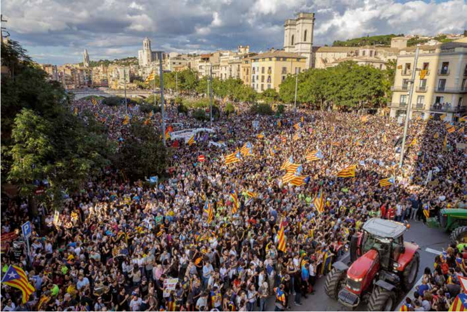
3-O (Girona, 3 d'octubre de 2017). David Borrat