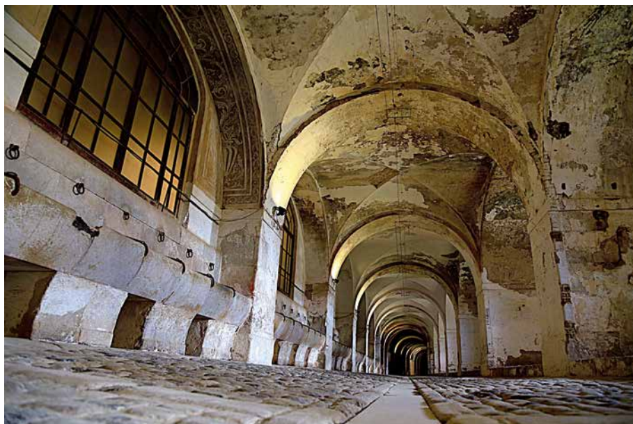
Castell de Sant Ferran (Figueres, 2017). Manel Lladó

«La sèrie "Espais amb història" ( El Punt Avui ) intenta acostar el lector a episodis que han marcat la història de les comarques gironines o que, sense haver-ho fet, permeten entendre fenòmens com el bandolerisme o els maquis. I ho fa situant el centre d'atenció en l'escenari on s'han produït: d'una banda, per posar en evidència que molt a prop nostre hi ha hagut esdeveniments rellevants, i, de l'altra, per intentar vincular la descoberta de l'entorn al periodisme i la història.» Manel Lladó