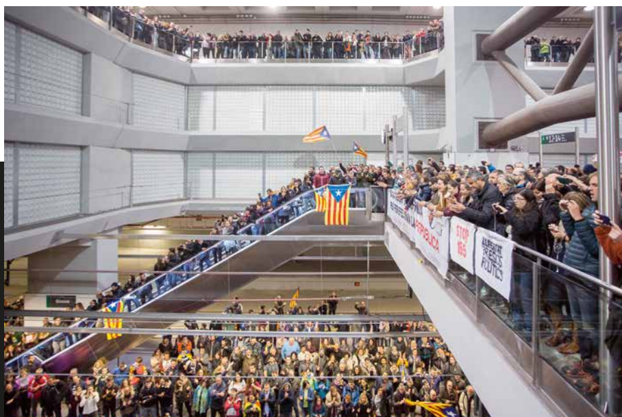
Aturada de l'AVE (Girona, 3 d'octubre de 2017). David Borrat

Durant la vaga general s'atura, durant tot el dia, el pas dels trens d'alta velocitat per Girona.