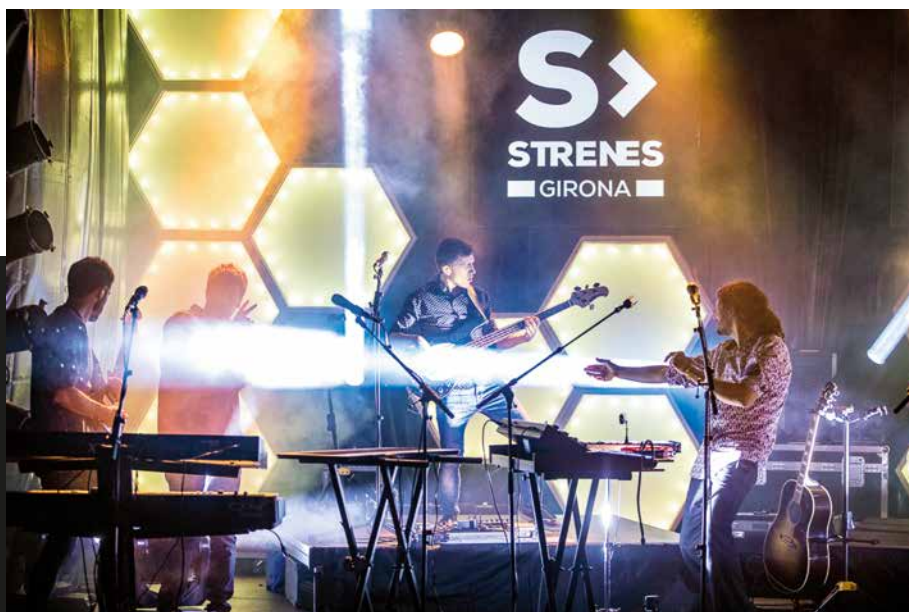
Ball i música sota la pluja (Girona, 30 d'abril de 2017). Sergi Paramès

«Festival Strenes de Girona. Les fotografies pretenen captar no només el que ha passat sobre l'escenari, sinó també el que ha viscut el públic: les emocions i les danses sota la pluja. En darrer terme, he intentat reflectir el que perdurarà durant molt de temps a la memòria dels que van gaudir de l'espectacle.» Sergi Paramès