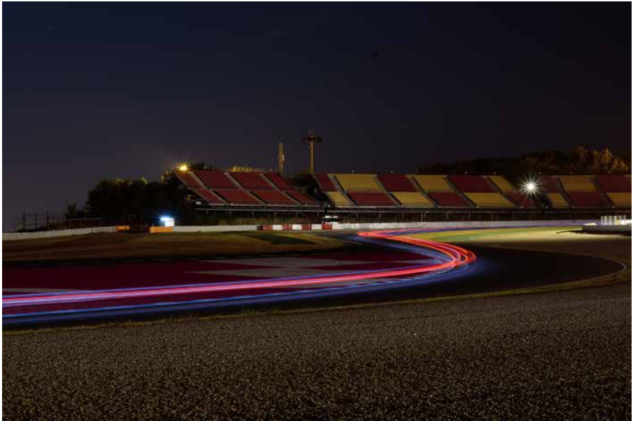
24 hores al Circuit de Catalunya (Montmeló, 8 de juliol de 2017). Vicenç Esteve