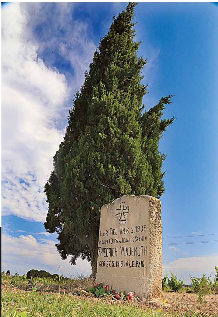
Tomba del soldat alemany (Garriguella, 2017). Manel Lladó