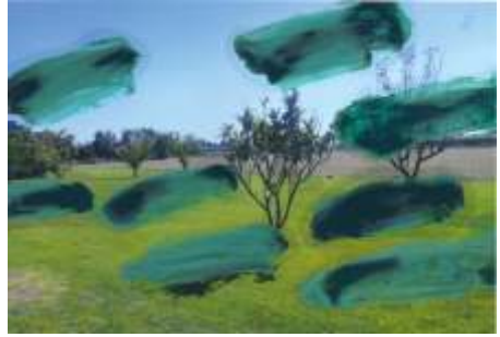
Sèrie Un tren en pot amagar un altre 2015 20,3 cm x 30,3 cm Fotografies manipulades amb collage , pintura a l'oli, esmalt, gouache , grafit i ceres