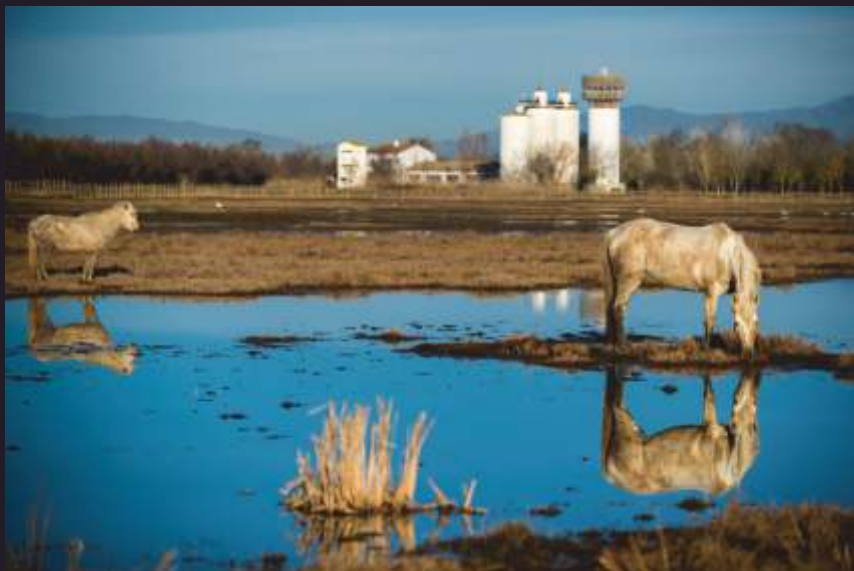
Lluís Serrat 40 anys dels Aiguamolls (agost de 2016)