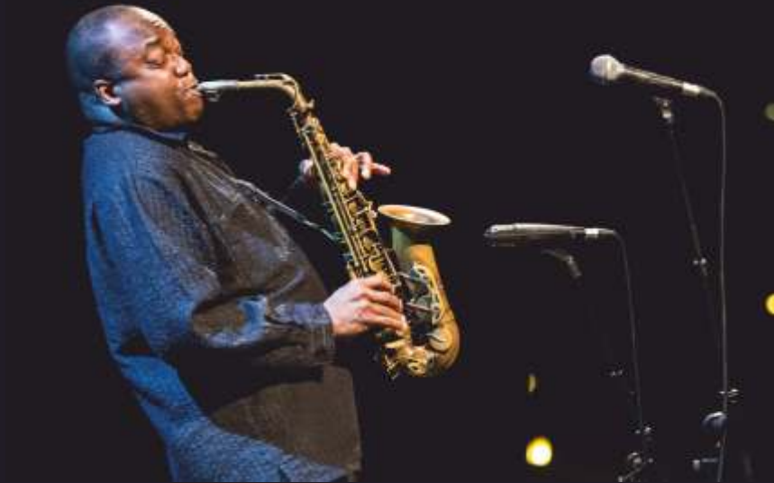
Martí Artalejo Jazz Festival l'Estartit (juliol de 2016)