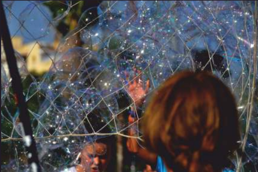
Jordi Busquets Bombolles de sabó (agost de 2016)