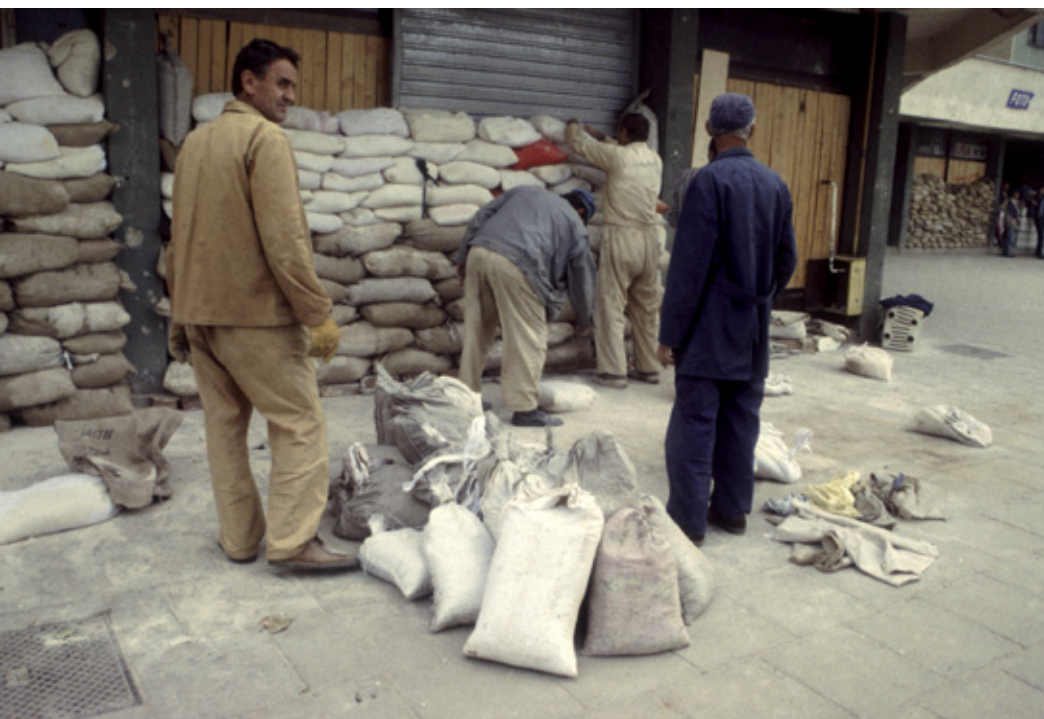
Parapets fets amb sacs de sorra per construir una escola a Dobrinja. Sarajevo, 1994.

Parapetos hechos con sacos terreros para construir una escuela en Dobrinja. Sarajevo, 1994.