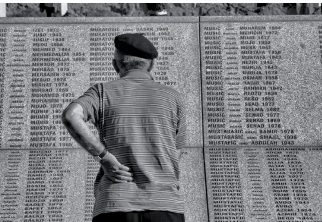
Làpida gegant amb els noms dels assassinats a Srebrenica. Srebrenica, 2008-2009.

Lápida gigante con los nombres de los asesinados en Srebrenica. Srebrenica, 2008-2009.