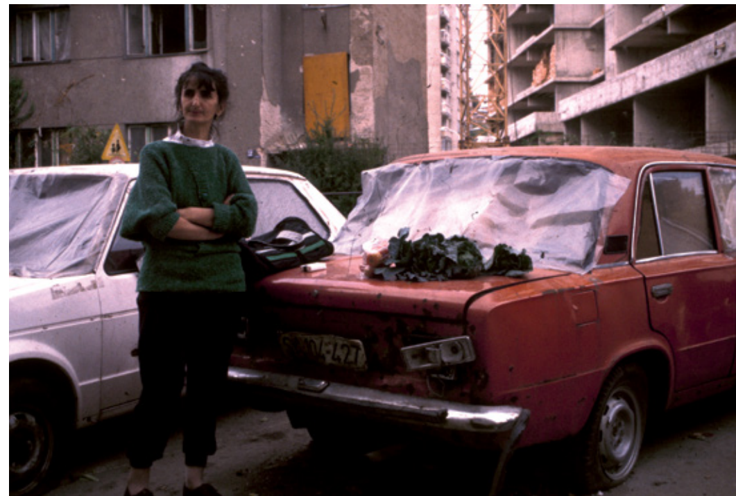
Dona intentant canviar fulles de col per qualsevol altre producte. Sarajevo, 1993.