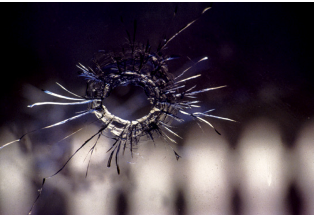
Forat de bala en un vidre de la seu del diari Oslobodenje . Sarajevo, 1993.

Agujero de bala en un cristal de la sede del periódico Oslobodenje. Sarajevo, 1993.