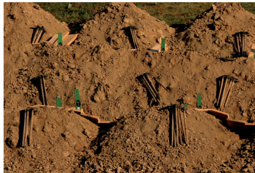
Preparatius per a l'enterrament de quatre-cents cinquanta-quatre cadàvers de la matança de Srebrenica procedents d'una fossa comuna. Srebrenica, 2008-2009.

Spomen-ploča s imenima ubijenih u Srebrenici. Srebrenica, 2008-2009. godine.