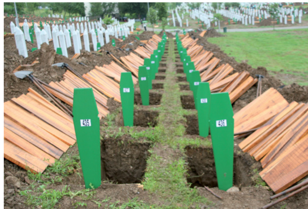
Fosses, abans d'enterrar-hi els morts del genocidi de Srebrenica. Srebrenica, 2008-2009.

Bdijenje žena nad njihovim mrtvim članovima porodice, žrtvama masovnog ubistva u Srebrenici. Srebrenica 2008-2009. godine.