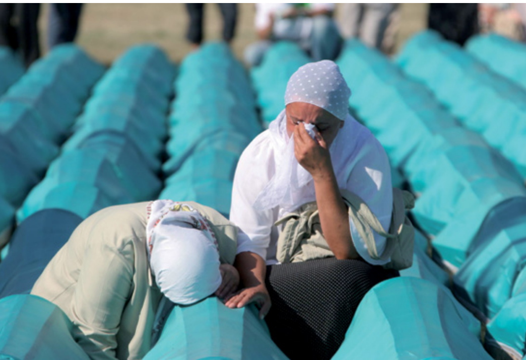
Dones plorant els seus morts. Srebrenica, 2008-2009.

Mujeres llorando a sus muertos. Srebrenica, 2008-2009.