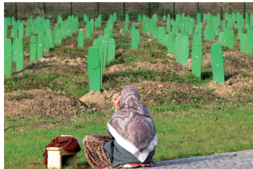
Vigílies de la visita de Clinton al cementiri. Srebrenica, 2003.

Žene oplakuju svoje mrtve. Srebrenica, 2008-2009. godine