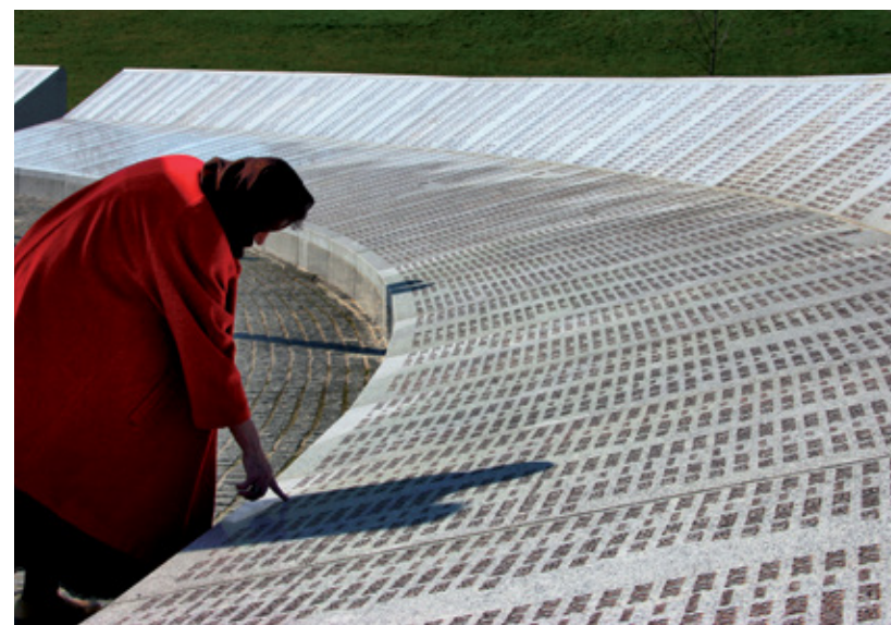
Monument als morts del genocidi de Srebrenica. Srebrenica, 2008-2009.

Uoči posjete Clinton-a groblju. Srebrenica, 2003. godine.