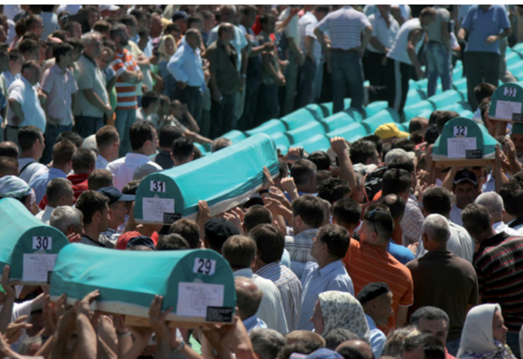
Homenatge als morts abans de ser enterrats. Srebrenica, 2008-2009.

Homenaje a los muertos antes de ser enterrados. Srebrenica, 2008-2009.