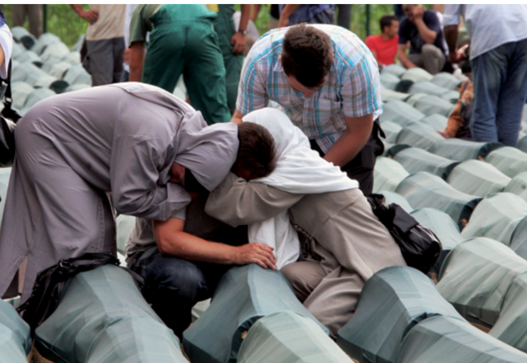
Dones vetllant els seus familiars morts en la matança de Srebrenica. Srebrenica, 2008-2009.

Mujeres velando a sus familiares muertos en la matanza de Srebrenica. Srebrenica, 2008-2009.