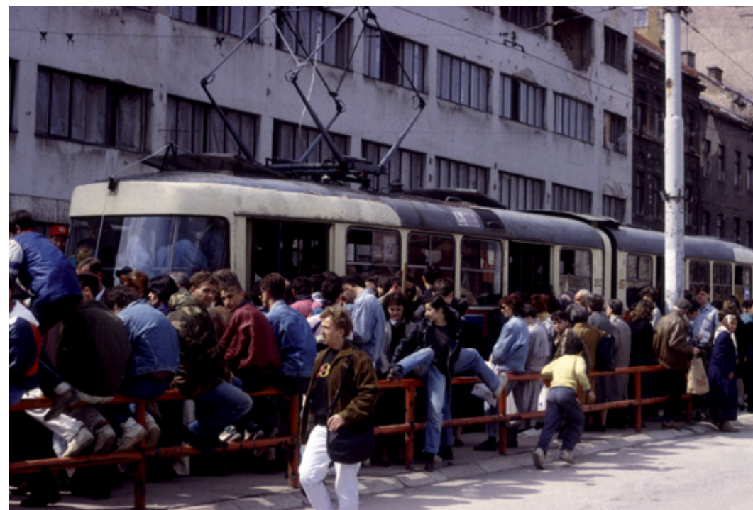
Tramvia. Sarajevo, 1997.

Bedemi napravljeni od džakova zemlje za izgradnju škole u Dobrinju. Sarajevo, 1994. godina