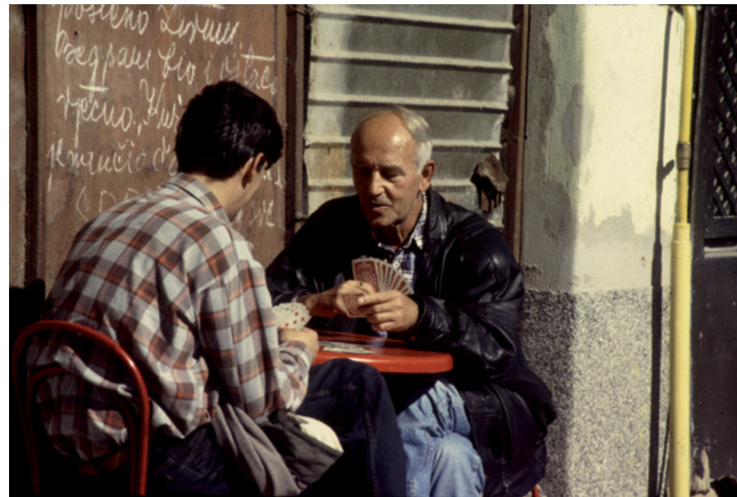
Malgrat la guerra, la vida segueix als carrers. Sarajevo, 1993.

Rupa od metka na staklu sjedišta dnevnog lista Oslobodenje. Sarajevo, 1993. godine