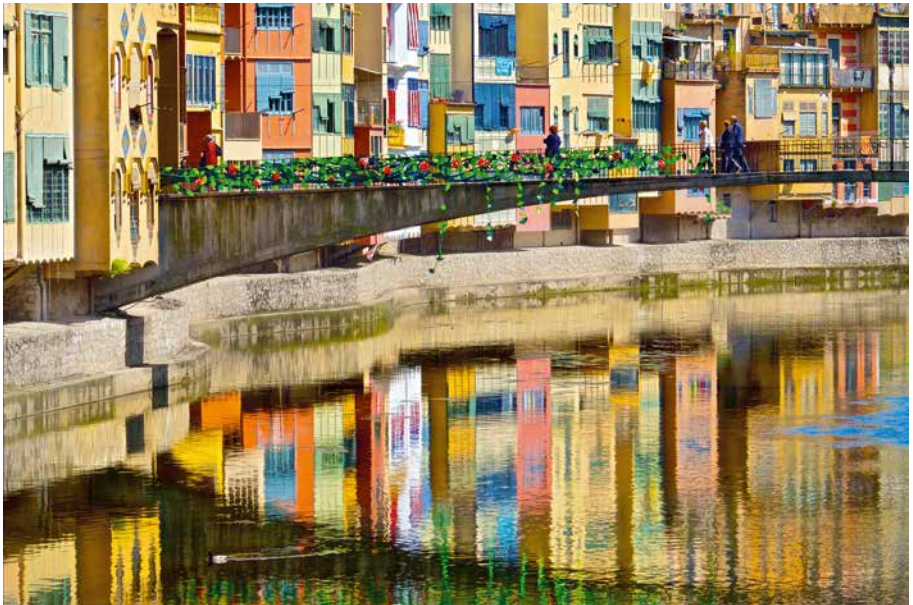
Reflexos a Temps de Flors (Girona)