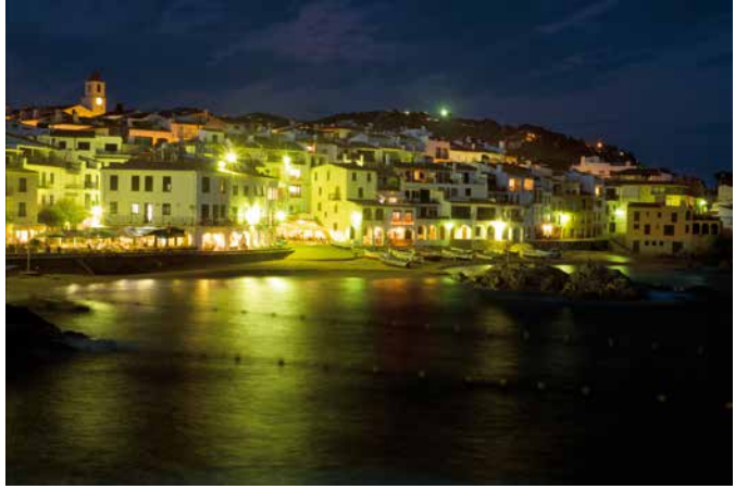
Platja de Port Bo (Calella de Palafrugell)