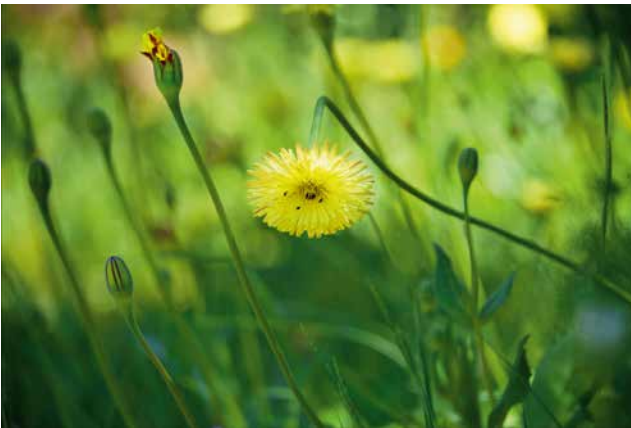
Cicle de vida (Beuda)