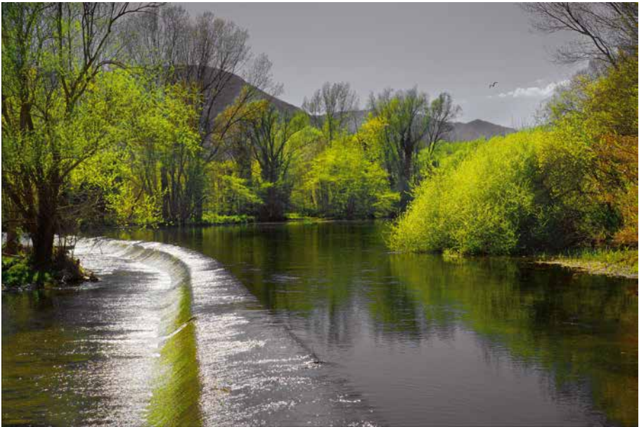
El riu de la vida (Anglès)