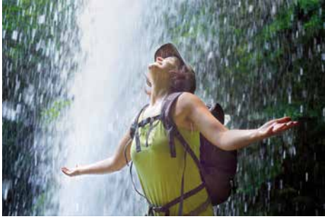
Som aigua (el salt de la Margarida, les Planes d'Hostoles)