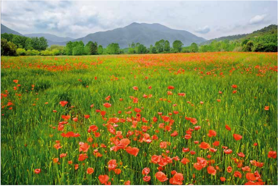
Camp de roselles (Sant Julià del Llor)