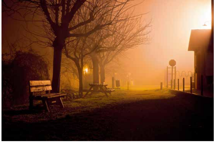
La boira (el Pastoral)