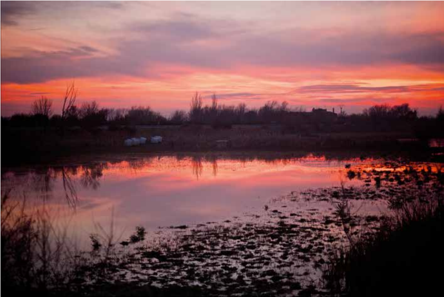
Cel rogent (Aiguamolls de l'Empordà, Castelló d'Empúries)