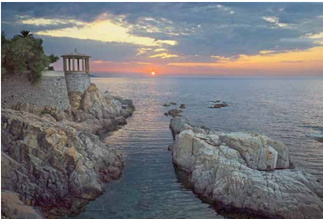
Camí de ronda (s'Agaró)