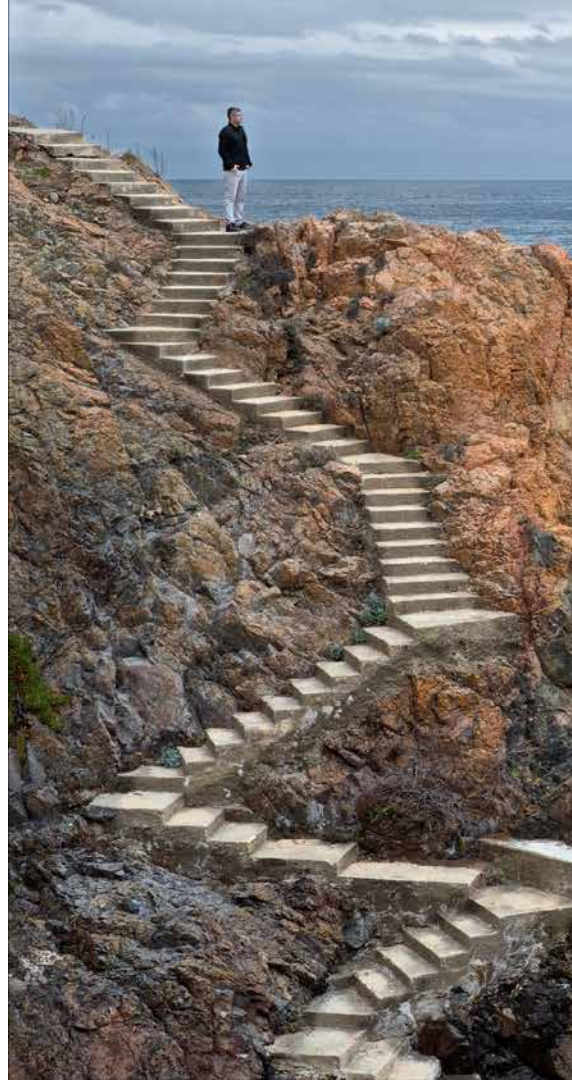
El llarg camí (cala de Vaques, s'Agaró)