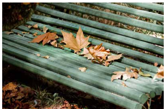
El parc de Sant Salvador (Santa Coloma de Farners)