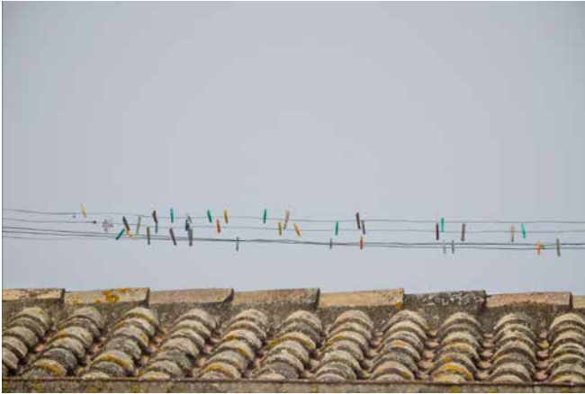
Pinces de roba (Girona)