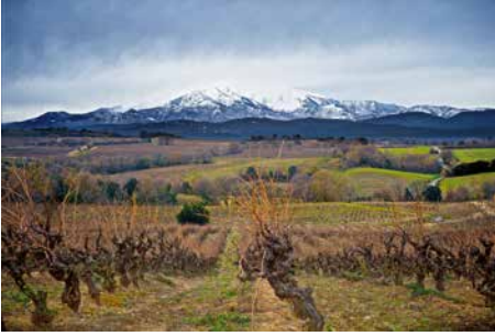
Des de les vinyes (el Canigó)