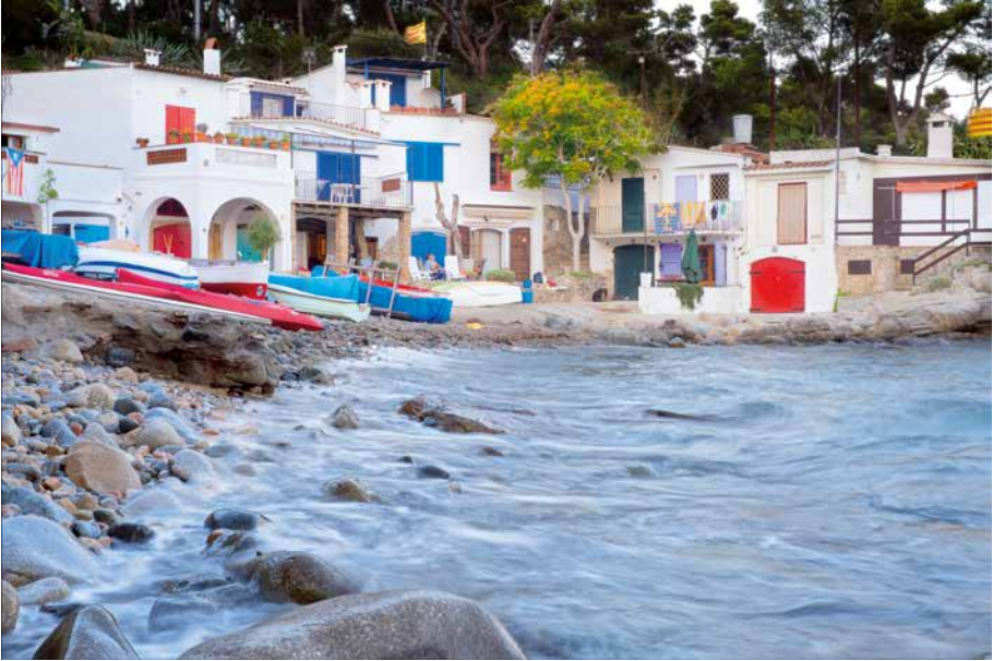
Cala s'Alguer (Palamós)