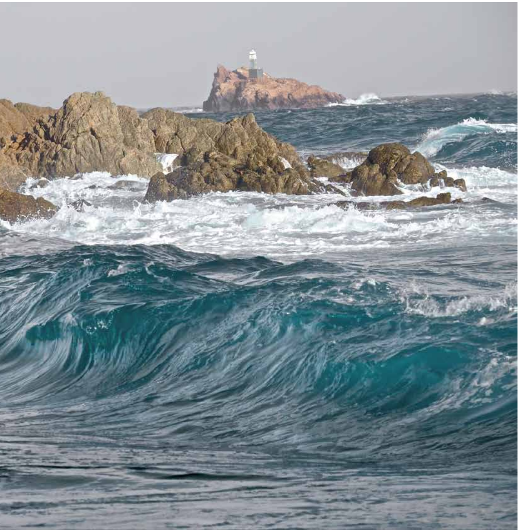
Cala Estreta (Palamós)