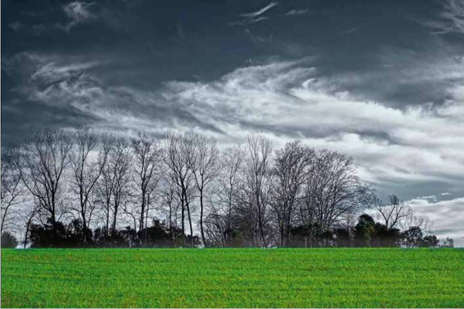
Núvols (Sant Martí Sapresa)