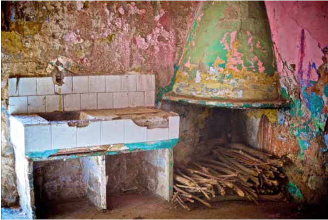
El pas del temps (Anglès)