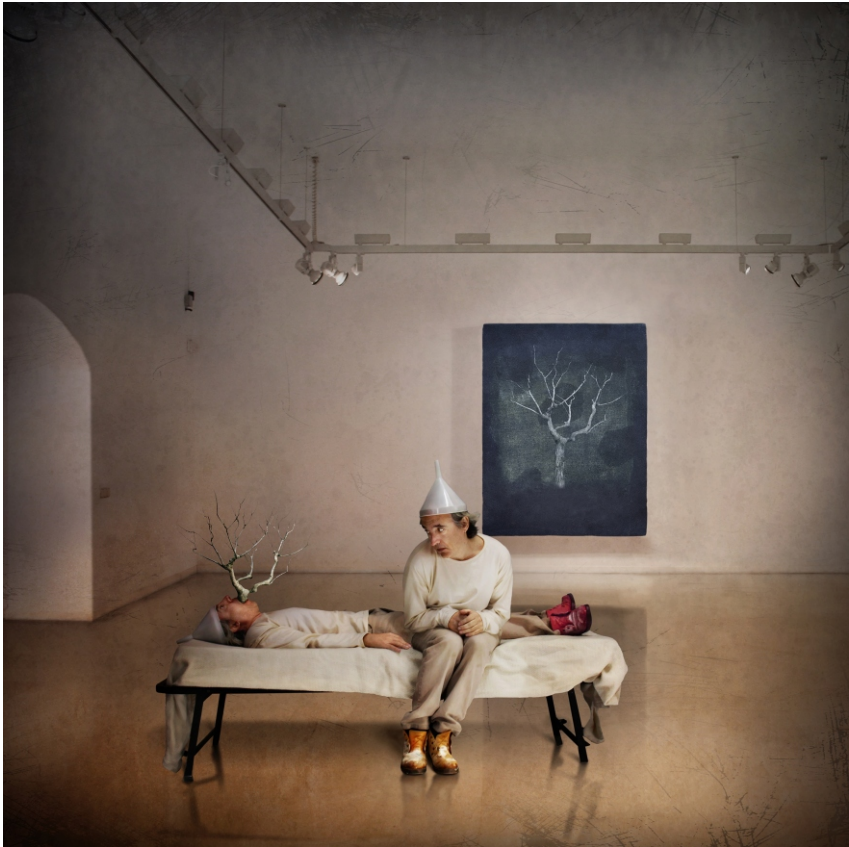
Sèrie Delirium S/T, 2009 150 x 150 cm Pintura digital - collage fotogràfic sobre tela