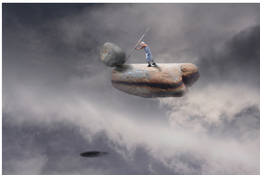
Sèrie Carmen S/T (fragment), 2007 60 x 90 cm Pintura digital - collage fotogràfic sobre paper