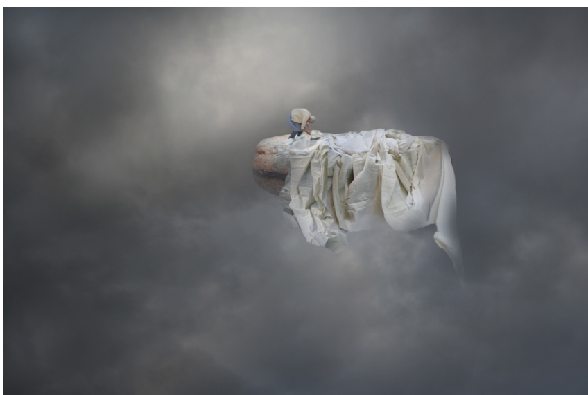
Sèrie Carmen S/T , 2007 60 x 90 cm Pintura digital - collage fotogràfic sobre paper