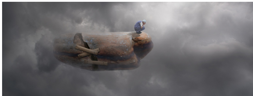
Sèrie Carmen S/T (fragment) , 2008 34 x 92 cm Pintura digital - collage fotogràfic sobre paper