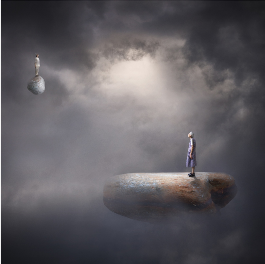
Série Carmen S/T, 2010 40 x 40 cm Pintura digital - collage fotogràfic sobre paper