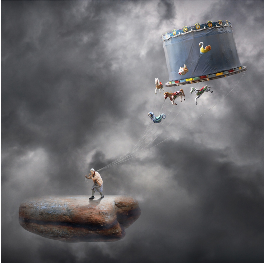
Sèrie Carmen S/T, 2012 150 x 150 cm Pintura digital - collage fotogràfic sobre tela