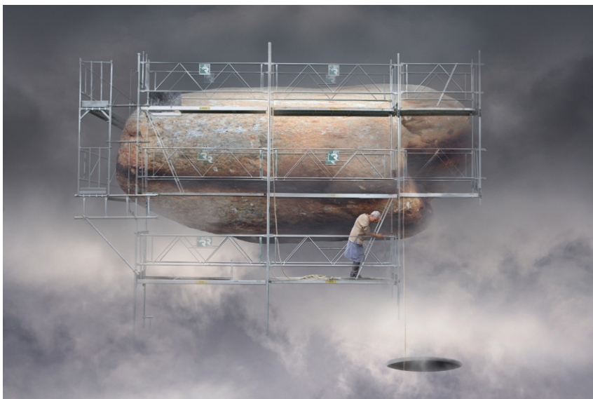
Sèrie Carmen S/T (fragment), 2007 60 x 90 cm Pintura digital - collage fotogràfic sobre paper