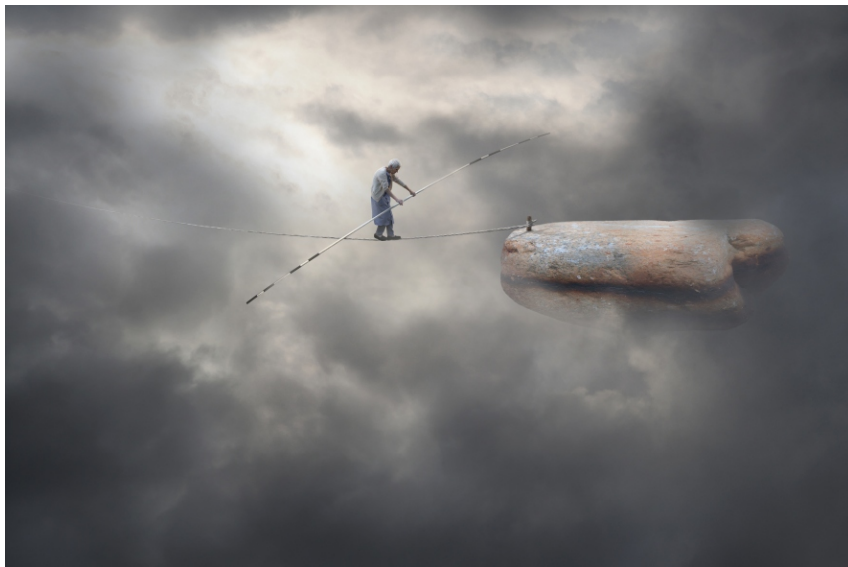
Sèrie Carmen S/T , 2007 60 x 90 cm Pintura digital - collage fotogràfic sobre paper