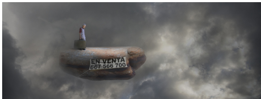
Sèrie Carmen S/T (fragment) , 2010 34 x 92 cm Pintura digital - collage fotogràfic sobre paper