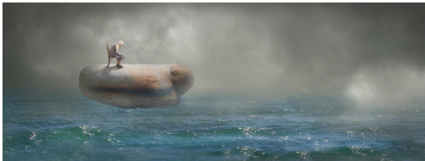
Sèrie Carmen S/T , 2009 34 x 92 cm Pintura digital - Collage fotogràfic sobre paper