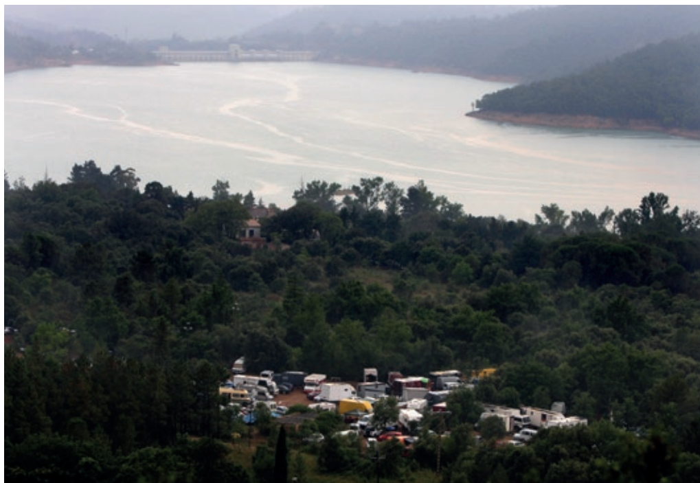
>> Festa rave al costat del club nàutic del pantà de Boadella, a Darnius, el 23 de juny de 2014.

Quan ja podem començar a dir que algunes de les expressions que van marcar el nostre dia a dia durant mesos (PROCICAT, estat d'alarma, distància social, cadena de contagis, màscara FFP2...) han quedat definitivament enrere, què n'ha quedat, de les formes de diversió que durant la pandèmia es van convertir en les úniques vies d'escapatòria possible? No sembla pas que les festes rave i els botellots hagin perdut embranzida. Constitueixen, al capdavall, una forma econòmica i autogestionada de diversió, amb l'al·licient afegit de proporcionar una sensació de llibertat i, fins i tot, de desafiar l'ordre i la legalitat establerts. Però tampoc sembla pas que les formes tradicionals de diversió hagin quedat gens ni mica tocades. Alguns, com en Ian (divuit anys), de Salt, ens assegura que «prefereixo les festes majors que no pas les discoteques, perquè hi trobo gent de tota mena, són a l'aire lliu-