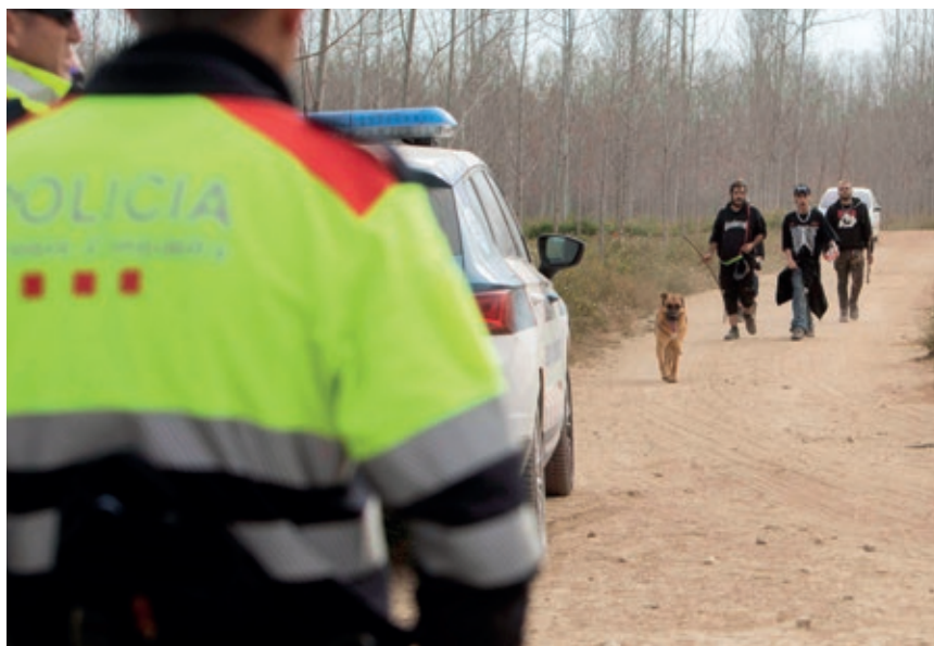
>> La policia va intervenir, però no va poder aturar la rave que es va fer a Cervià de Ter durant la Setmana Santa del 2023.

volia dir sortir de nit. I és que, després de tant de temps sense poder-ho fer, les festes de postconfinament tenien un aire més descontrolat, que pretenia compensar tot el que no s'havia pogut gaudir durant mesos. Amb el temps, aquells joves han après que es pot sortir d'una manera més tranquil·la i que el simple fet de poder-se trobar (en espais oberts o tancats) sense limitacions ni restriccions de cap mena ja és, en si, una festa.