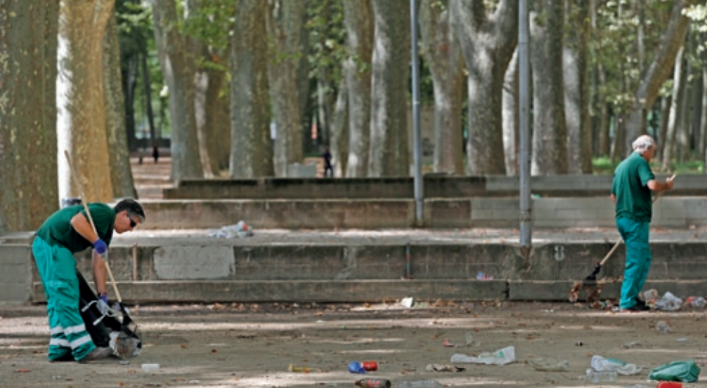
>> Operaris netejant el parc de la Devesa després d'un botellot multitudinari celebrat l'1 d'octubre de 2021.