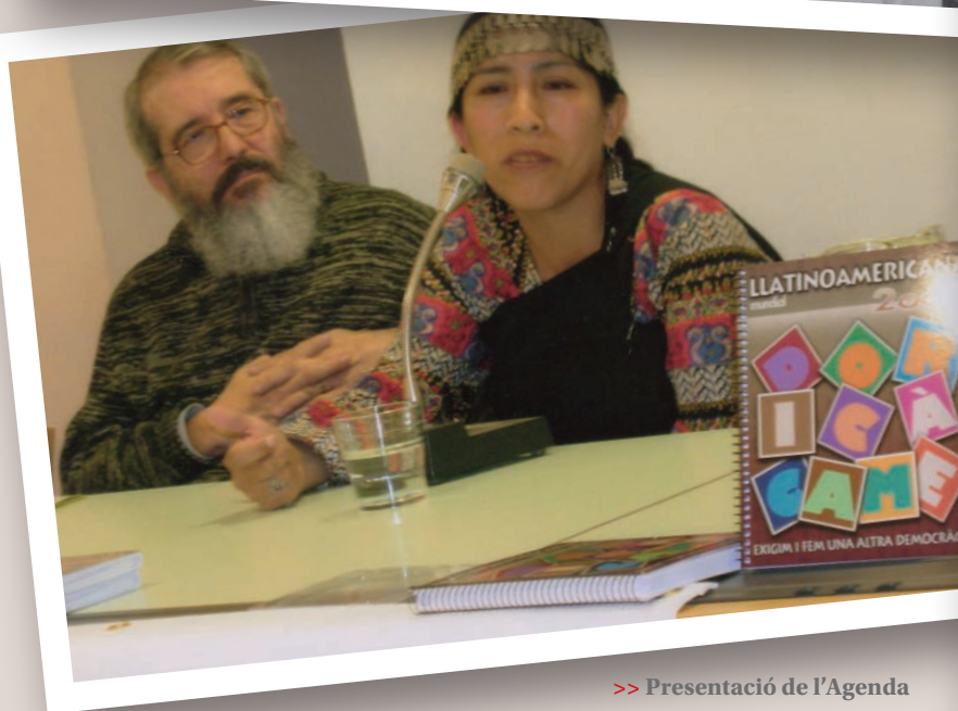
>> Presentació de l'Agenda Llatinoamericana a Girona, tardor de 2006.