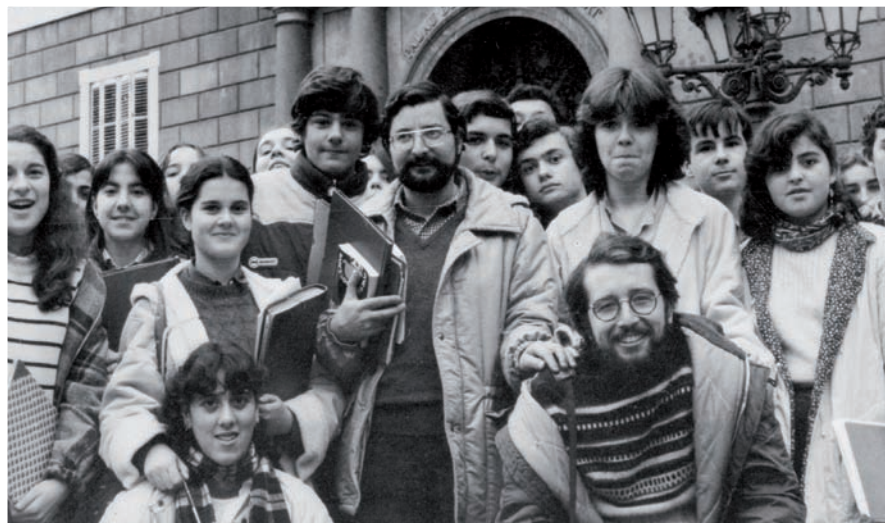
>> Davant el Palau de la Generalitat, a la plaça de Sant Jaume de Barcelona, amb alumnes de l'Institut Santiago Sobrequés de Girona del curs 1981-1982. A sota, a la manifestació «Salvem el Ter» a Torroella de Montgrí, el 7 d'agost de 1976.