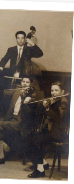
>> Amb l'Orquestra de Cambra Juvenil de Torroella de Montgrí, l'any 1957. És el primer violí a la dreta.