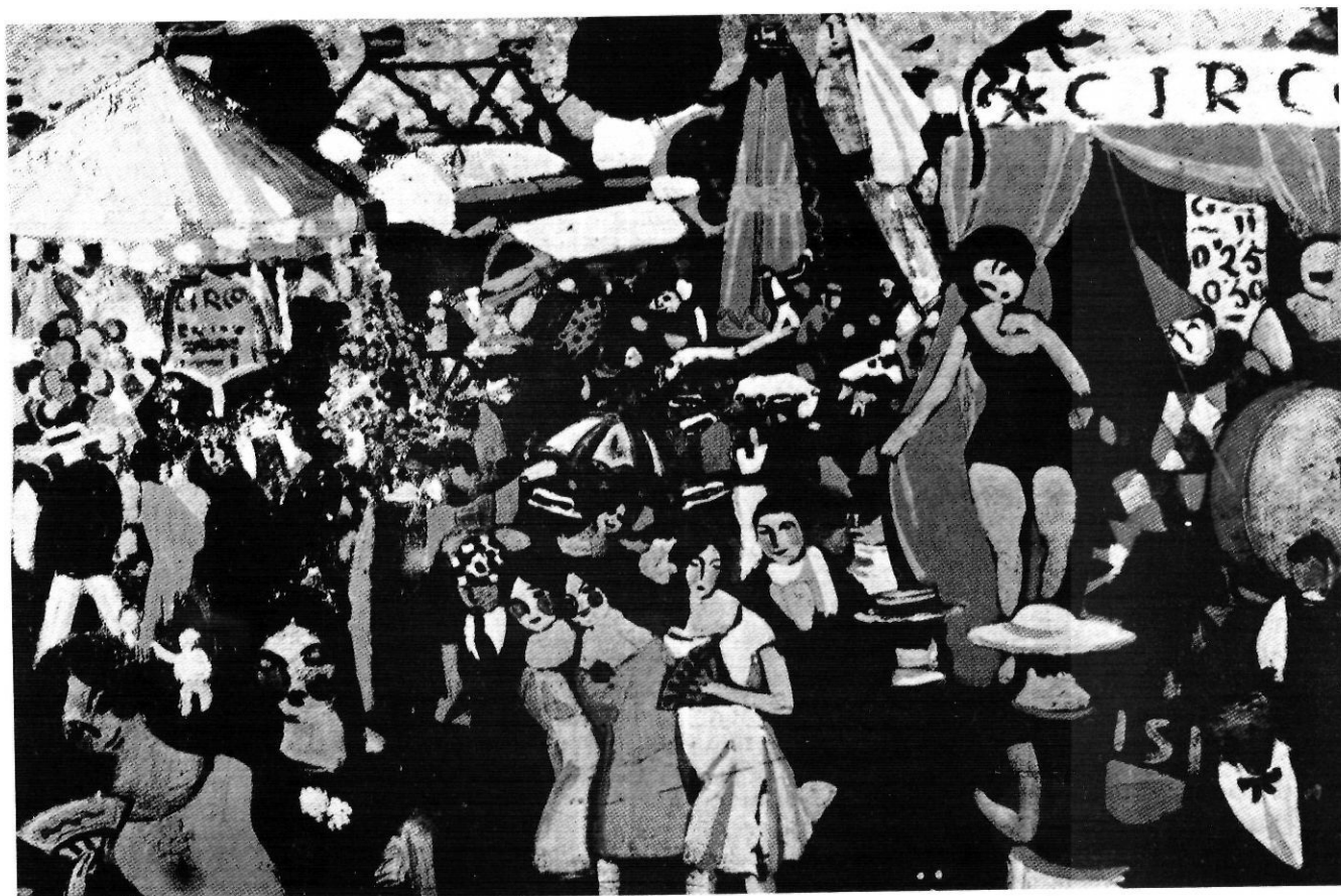
Quadre de S. Dalí sobre la Fira de Figueres del 1921 que es troba al seu Museu de Figueres.