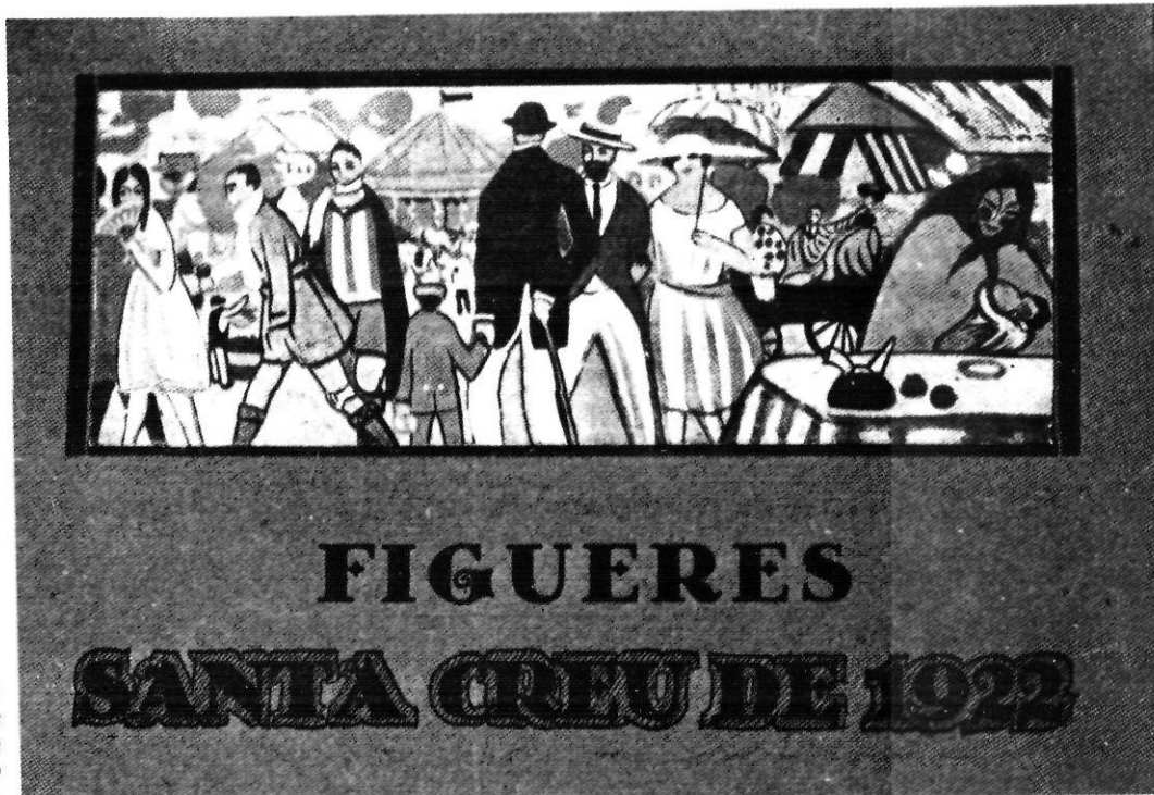
Portada d'un programa de Fires del 1922 amb la reproducció d'un quadre de S. Dalí.