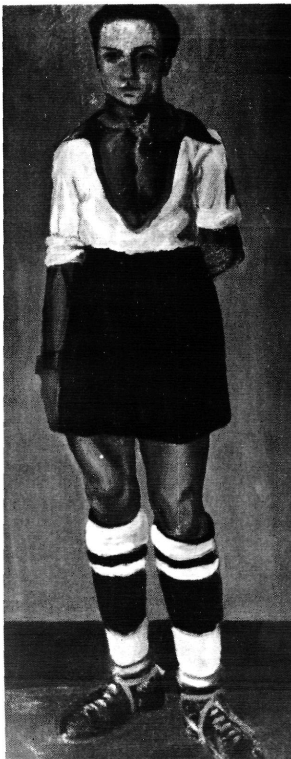
"Retrat de Miravittles, oli de S. Dalí del 1921.

La comissió de festes de Figueres encarregà a Dalí la confecció dels cartells anunciadors de les fires del 1921 3 . El seu disseny provocà controvèrsies a la premsa local, però tingueren un gran ressò 4 . Això probablement és el que mogué Joaquim Serra, professor que fou de l'Institut i bon amic de joventut de Dalí, a demanar-li l'any següent que fes per a la impremta