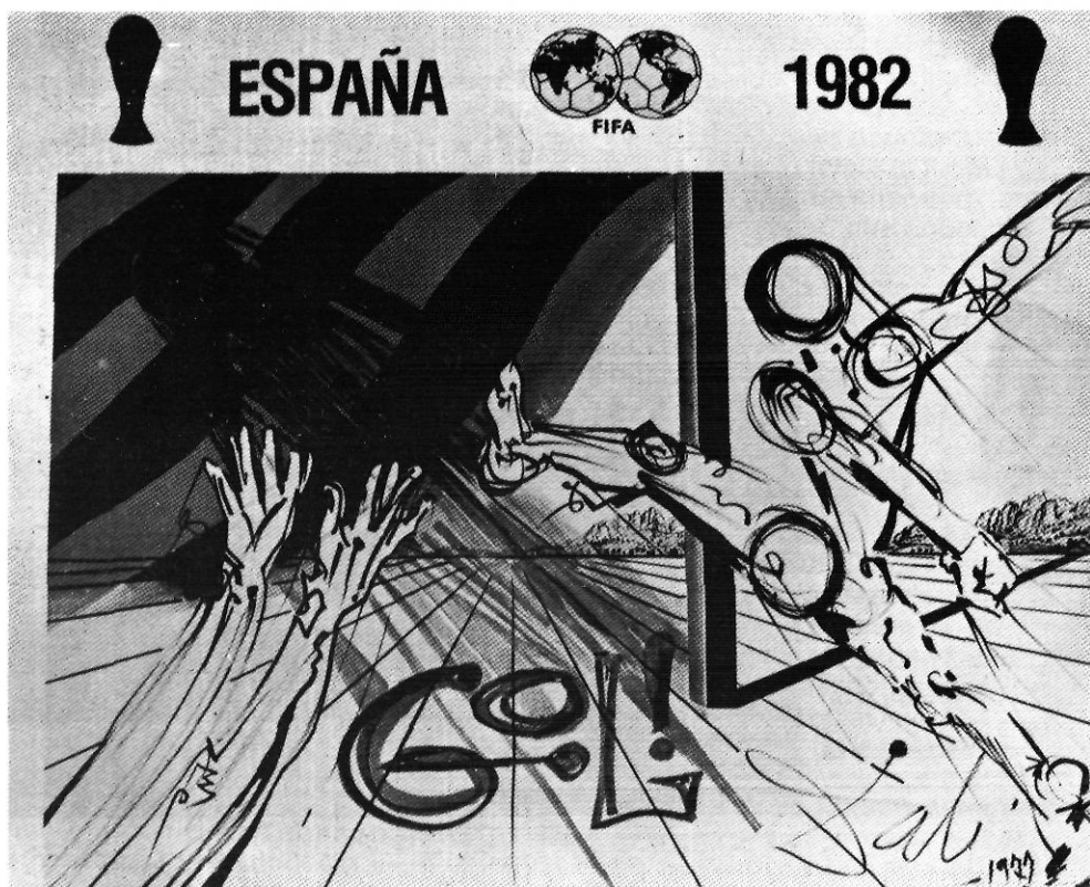
Dibuix de S. Dalí que donà per ajudar econòmicament a l'equip del Sant Andreu al 1977 i que després serví de pòster del Mundial del 1982.