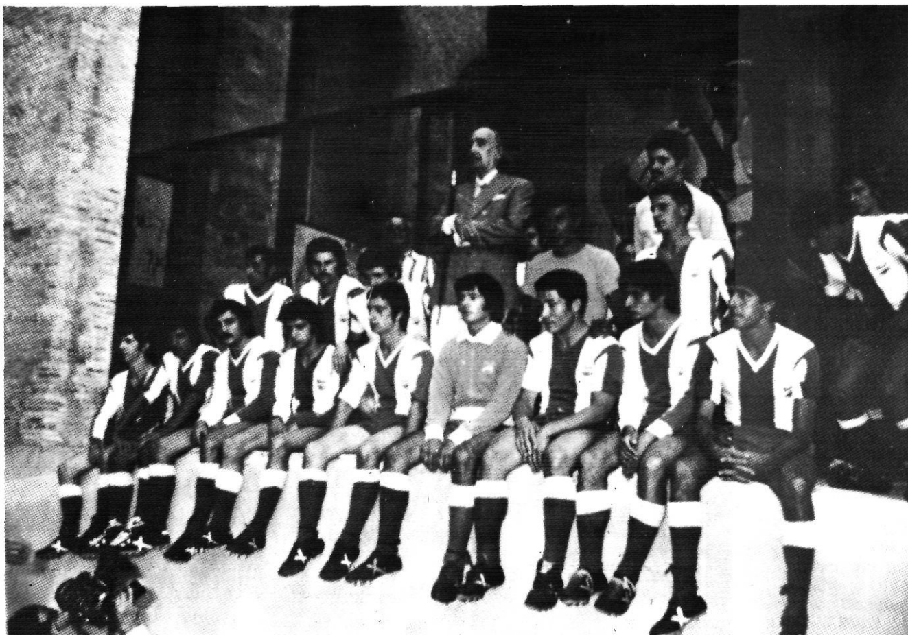
Salvador Dalí fotografiat amb la Unió Esportiva Figueres sota la cúpula del seu Museu.