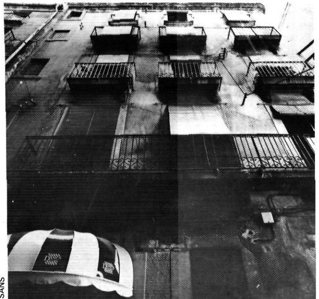
Als baixos del número 11 del carrer de les Ferreries Velles hi havia la impremta Llach, on va començar-se a imprimir "Catalanitat".