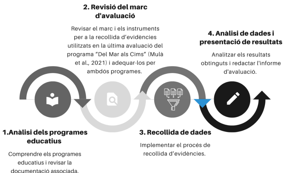
Figura 1 Fases de treball

El procés d'avaluació s'ha estès durant aproximadament un any i s'ha desenvolupat en les següents 4 fases de treball: