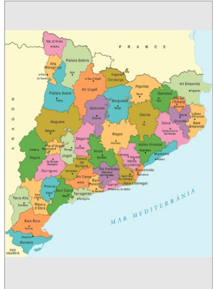
Imatge 2. Mapa comarcal actual