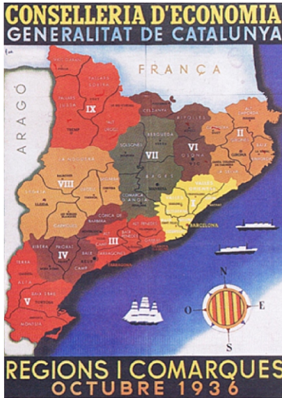
Imatge 1. Mapa comarcal de la Generalitat republicana