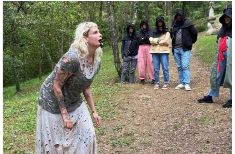
La proposta de Cherigati parteix de la dansa.