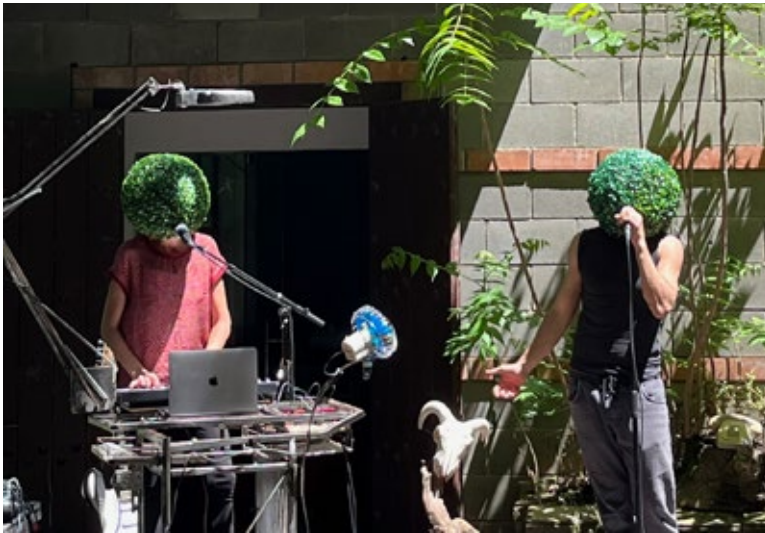
Animal vegetal, en plena actuació.

Tota la informació del festival a l'Instagram: @aixoalpoblenoliagrada