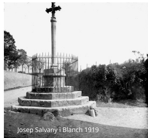
Josep Salvany i Blanch 1919

A principis del segle XXI, amb motiu de la renovació de la plaça, es va guardar uns anys fins que, l'any 2007, durant l'alcaldia de Narcís Algam , es va emplaçar en el lloc actual.