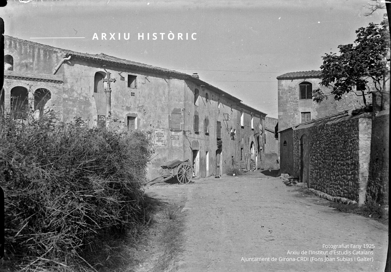
Fotografiat l'any 1925

Aquesta fotografia és una de les finalistes de la votació popular que es va fer al local social el passat 2 de desembre.