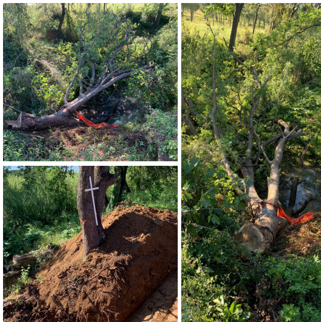
L'estassada dels roures al Pont de l'Humà.