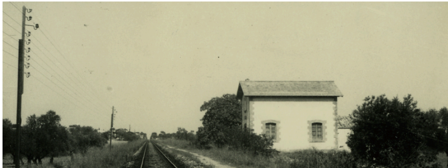
A l'esquerra, el baixador de Tonyà el 1858, A la dreta, el baixador l'any 2024.