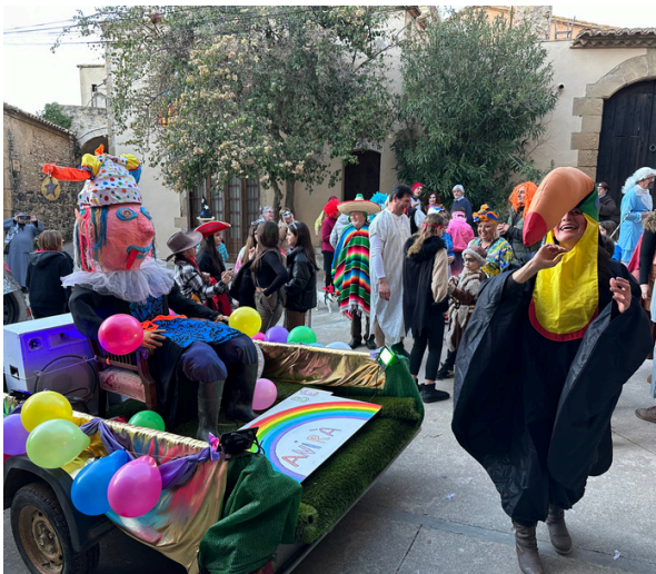
Rua Carnavalesca a la plaça de la Constitució.