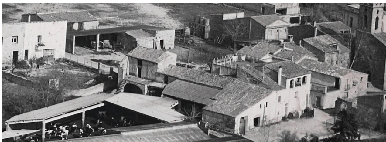
Can Sistet en primer pla a mitjans dels anys 80.