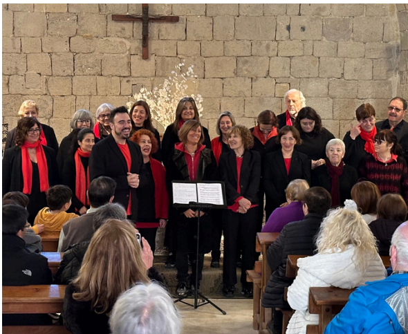
Gospel Tramunt Cor a l'església de Santa Eulàlia.

Els dies 10 i 11 de febrer la Comissió de Cultura i Festes de l'Associació de Veïns va organitzar la Festa d'hivern amb una xocolatada i jocs de taula, un ranxo de carnestoltes i una rua carnalesca.