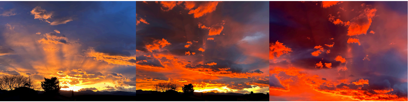
Posta de sol des de Santa Eulàlia (27/02/2024)