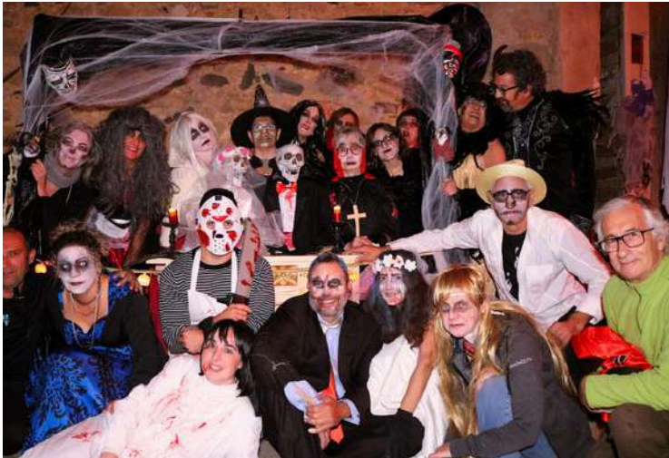
Els organitzadors de l'anomenat Castaween.