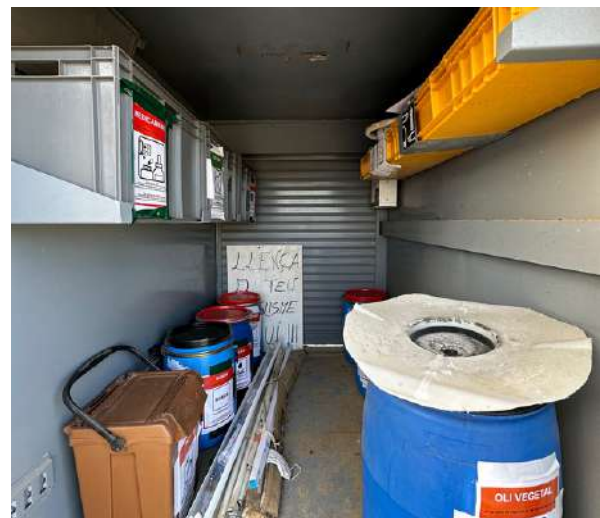
Interior de la mini deixalleria.

Us recordem que els medicaments, les pintures, els fluorescents, els aerosols, entre altres, són productes molt contaminants que no es poden llençar a les escombraries normals.