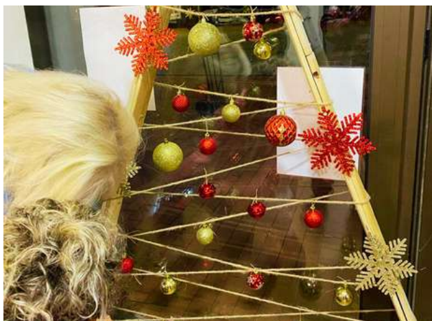
Taller de treballs manuals al Local Social.