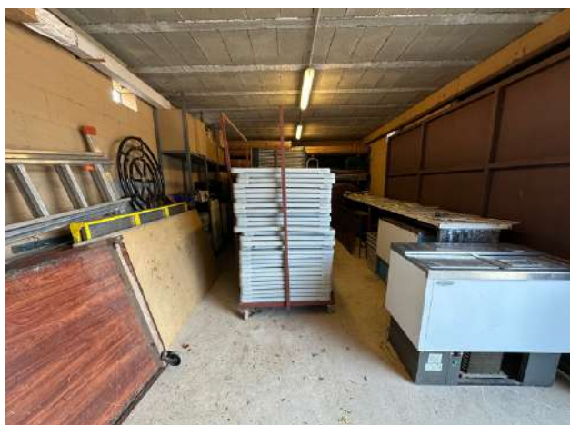
El magatzem netejat.

Al desembre es va netejar el magatzem per tal de poder encabir-hi millor tot el material del qual disposa el poble.