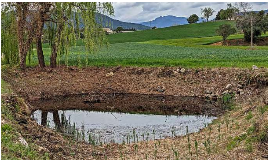
A dalt, el paviment de la carpa de l'escola, el 4 d'abril de 2024. A baix, la bassa de Figueroles, el 31 de març del 2024.