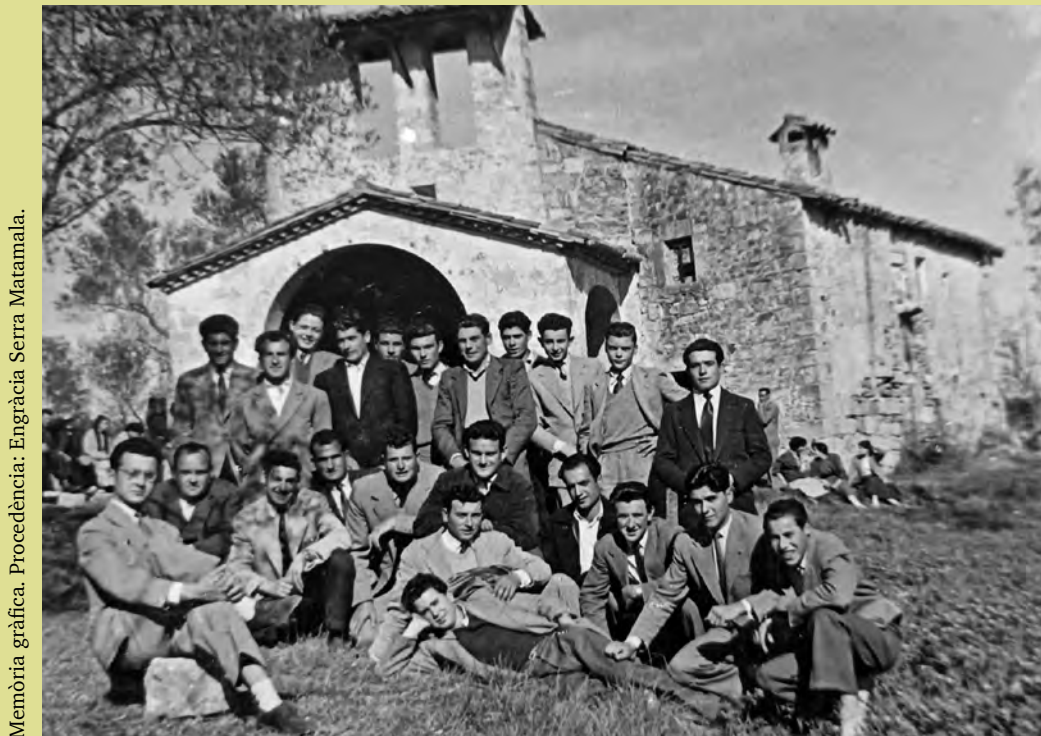
Memòria gràfica.