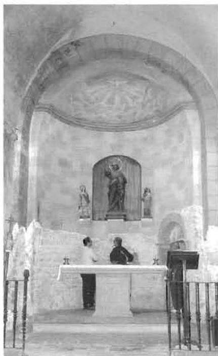
Figura 5. primer pla de l'absis de l'església de Llorà en iniciar-se les obres de restauració. Hom hi pot observar com aquestes s'iniciaren per un repicat de parets que posà al descobert, però també malmeté i destruí les restes pictòriques romàniques que fins llavors havien restat conservades sota la capa de guix. Malauradament, les restes aparegudes foren considerades poc importants i el repicat de l'absis continuà fins que s'eliminà tota la capa de guix que el cobria.

que es féu càrrec de l'obra i elaborà un projecte de restauració més global. Precisament, fou durant aquesta nova etapa, durant els treballs arqueològics que es dugueren a terme a l'interior de la nau principal de l'edifici, quan es trobaren intactes el nivell de pas i els paviments de l'església preromànica.