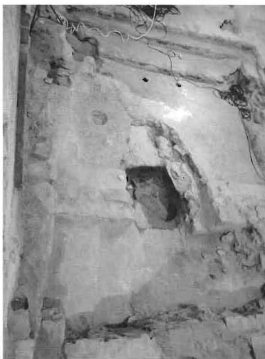
Figura 3. vista parcial de les restes preromàniques aparegudes sota la nau principal de l'església de Sant Pere de Llorà. S'hi pot observar el mur d'obra que separava la nau del presbiteri, parcialment derruïts per una tomba posterior, i els dos esglaons i els forats per sostenir un cancell de fusta que alhora el subdividien en dos sectors clarament delimitats.

cortinatges decorats amb medallons, en un dels quals hi ha la representació d'un griu (mig àliga i mig lleó). L'element més destacat és que per donar una solució definitiva a les filtracions d'aigua que afectaven l'edifici precedent es decidí apujar el nivell de circulació general, de manera que desapareixia la separació entre la nau i el nivell intermedi. De retop, això comportà que es conservessin les estructures preromàniques. També, per les mateixes dates s'afegí a l'església un campanar de gran alçada, el qual consta de dos pisos amb finestres geminades decorades amb columnes i capitells en forma de mènula a cada cara.