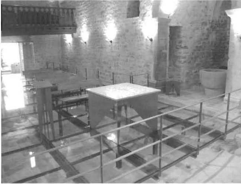
Figura 6. vista parcial de la nau principal de l'església de Llorà un cop finalitzades les obres de restauració. Les restes preromàniques s'han deixat a la vista mitjançant un terra de vidre sostingut per una estructura metàl·lica. A més, s'ha avançat l'altar per tal de permetre una visió general de les pintures romàniques de l'absis.

objectius principals que creiem haver assolit plenament: en primer lloc, la restauració i consolidació dels elements apareguts al llarg de la intervenció arqueològica i, en segon lloc, permetre una bona comprensió del conjunt als seus possibles visitants.