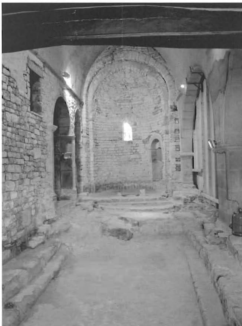
Figura 2. vista general de la nau principal de l'església de Sant Pere de Llorà. S'hi pot observar com sota el paviment actual es conservava, a nivell de circulació, un edifici preromànic que cal situar entorn al segle IX.