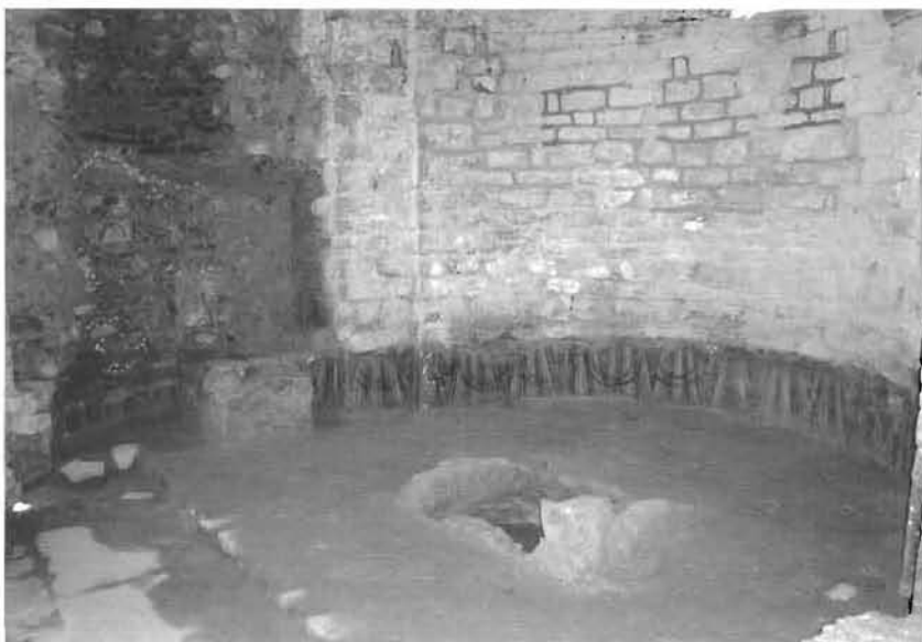
Figura 4. vista general de l'absis de l'església de Sant Pere de Llorà tot just acabat d'excavar. S'hi pot observar com les pintures romàniques es conservaren en el seu nivell inferior, gràcies al fet que quedaren protegides per l'elevació del nivell de terra, mentre que en l'absidiola nord aquesta conservació es degué al fet que fou parcialment paredada durant unes obres de reforma d'època moderna.

Aquesta reforma també comportà l'amortització final de les dues absidioles laterals, la sud fou totalment derruïda fins al nivell de circulació del moment, mentre que la nord fou parcialment enderrocada. Curiosament, en un primer moment aquesta no fou totalment paredada, atès que simplement s'avança lleugerament el mur intern, la qual cosa permeté la conservació parcial de les pintures romàniques, alhora que es bastí una gran arcada al damunt. Possiblement, s'hagi d'interpretar aquesta actuació com l'adequació d'un espai per situar-hi algun dels dos altars desplaçats, previ a les obres d'obertura de la nau sud, així es podia fer ràpidament el trasllat i començar les obres sense afectar el culte.