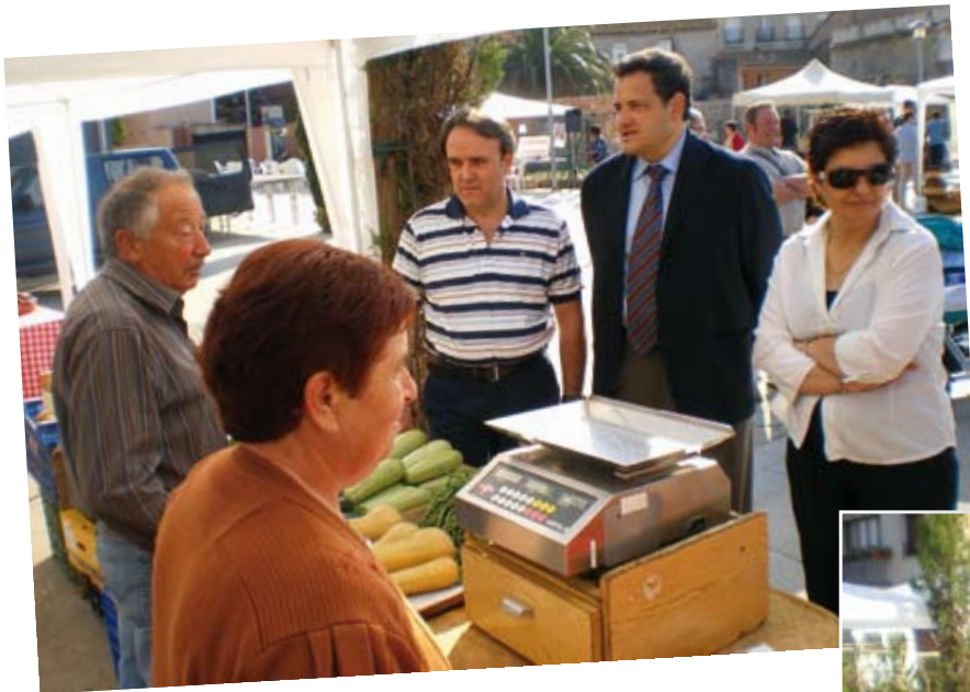
Fira de l'Horta