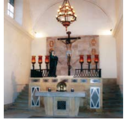
Nova imatge de la Capella dels Dolors.

El 13 de desembre de 2008 celebrarem la festa de Santa Esperança, patrona dels Jubilats, i va ésser un èxit d'assistència. Va ser un plaer escoltar la Coral Infantil del col·legi Sant Pau de Figueres, i tot seguit vam fer un berenar de germanor. Esperem continuar cada any fent aquesta festa, amb l'objectiu de reunir-nos tots els associats com a mínim una vegada l'any.