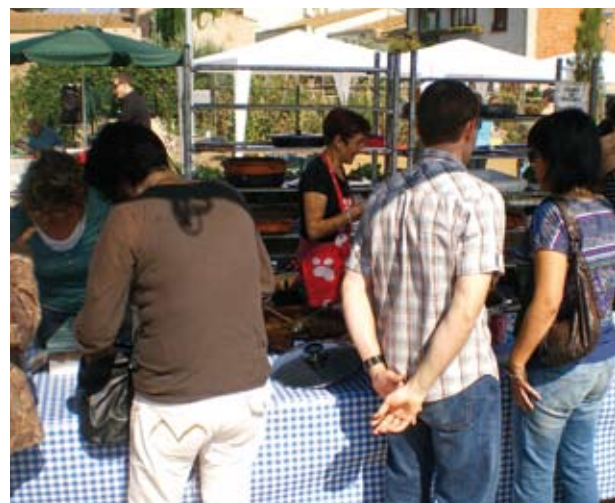
Un moment de la Fira, amb gran afluència de gent.

de la "Fira de l'horta i la Poma de relleño". Ens veiem en la propera edició.