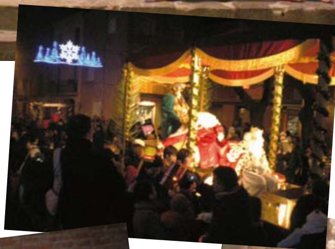
Cavalcada de Reis