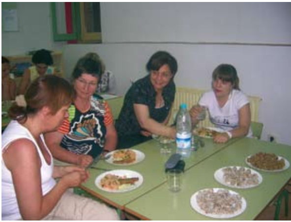
Curs de cuina