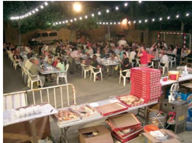
Sardinada de Sant Joan