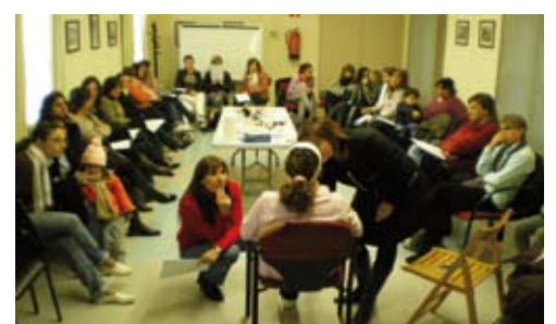
Cursos de cuina i maquillatge