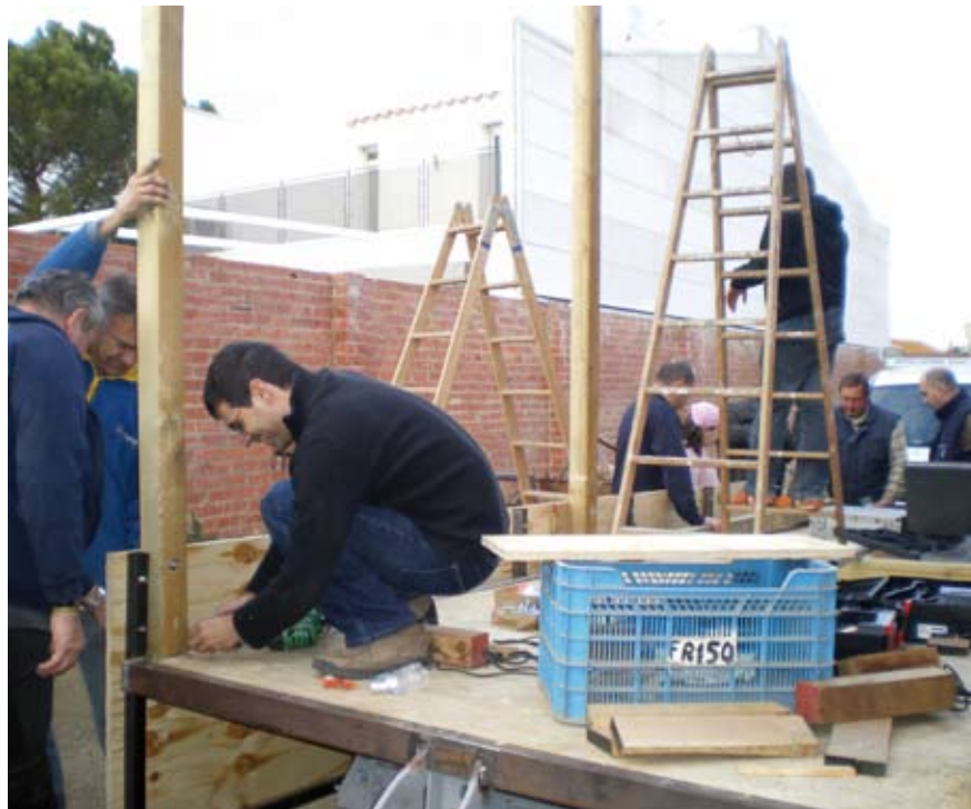
Primers passos del muntatge de la carrossa.

La nova carrossa reial ha estat dissenyada específicament per a la rua, només perquè exerceixi aquesta finalitat. Té totes les condicions de solidesa i seguretat, i creiem que fa molt de goig.