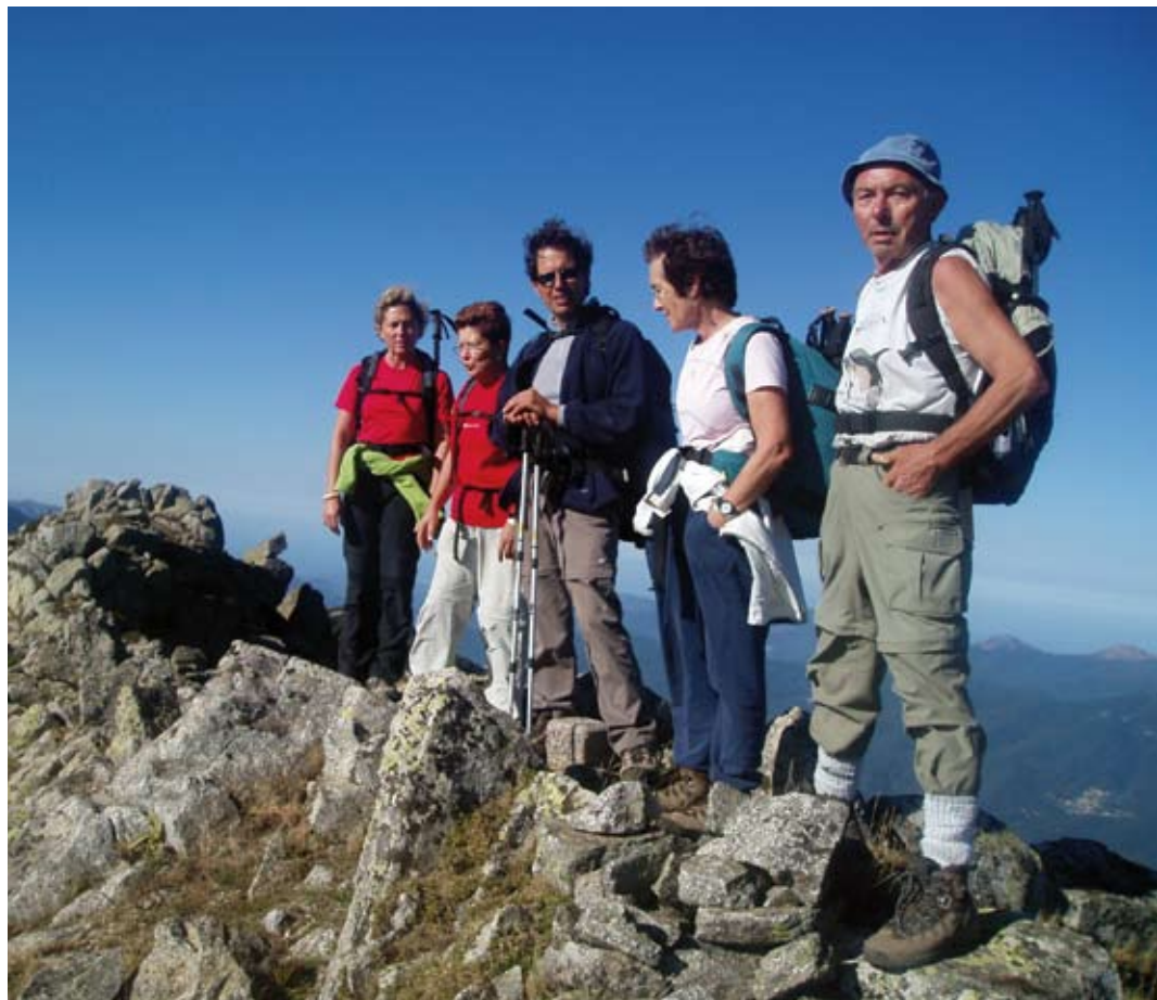
Foto de grup al Collado di Bocca di u Pargulu.

6è dia, 22 de setembre. De bon matí ens traslladem a Casas de Bavella. La sortida de l'excursió és a partir del Collado de Bavella (1.220m). És un luxe per un excursionista passar un dia pels senders entre les roques, els colls i les agulles de Bavella. Em complau més encara quan