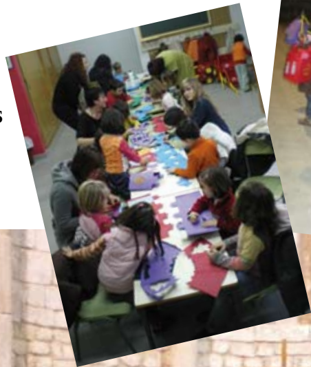
Taller de fanalets