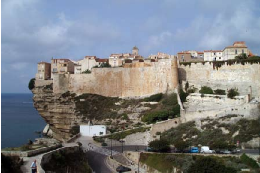
Vista de Còrsega.

Una serralada divideix l'illa de Còrsega de nord a sud, com una espina dorsal. El punt culminant és el Monte Cinto, de 2.705m d'alçada. El Parc Natural Regional de Corse és motiu i origen del sender de gran recorregut GR-20, degudament senyalitzat de Calenzana a Conca. La Federació Francesa de Senderisme ha dividit el recorregut en 15 etapes, per fer molt pausadament. Avui dia, els excursionistes més ben preparats poden fer-lo en 10 dies. La nostra sortida, però, es limitarà a fer unes excursions puntuals i ben escollides pel GR-20, un tast del que seria la totalitat de la travessia.