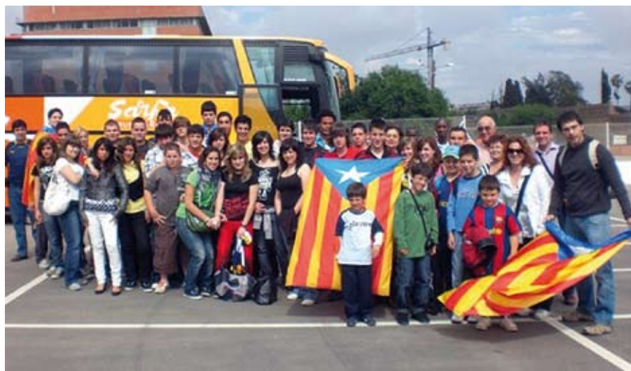
Sortida al partit de la Selecció Catalana el mes de maig.

Volem aprofitar per dir que la participació a les activitats que hem organitzat no ha estat gaire bona, i ens agradaria que per a les properes us animéssiu a prendre-hi part per aconseguir que tothom s'ho passi d'allò més bé i perquè nosaltres ens animem a realitzar més activitats. Estem oberts a propostes per part vostra.