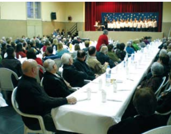
Festa de Santa Esperança.

En vigílies de la passada festa de Santa Esperança, en una xerrada amb el senyor alcalde, em deia: «Desitjaria que l'any que ve per aquestes dates fos possible fer la inauguració». Sàpiga, senyor alcalde, que nosaltres, els jubilats, ballàriem de contents.