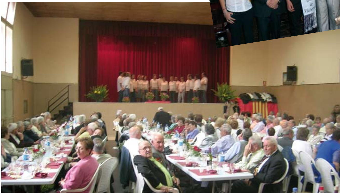
Festa de la vellesa