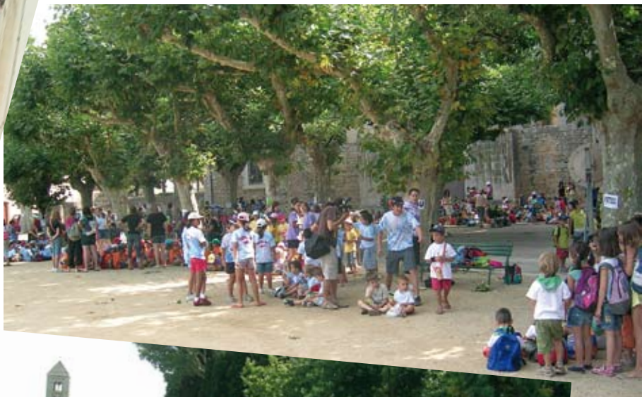
Trobada de casals