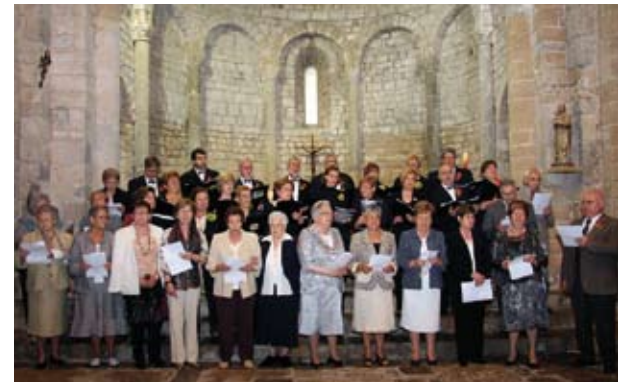
Actuació a la Festa de la Vellesa, amb una representació de la gent gran.

Vilabertranencs, si us agrada cantar i teniu un mínim d'aptituds pel cant, us esperem.