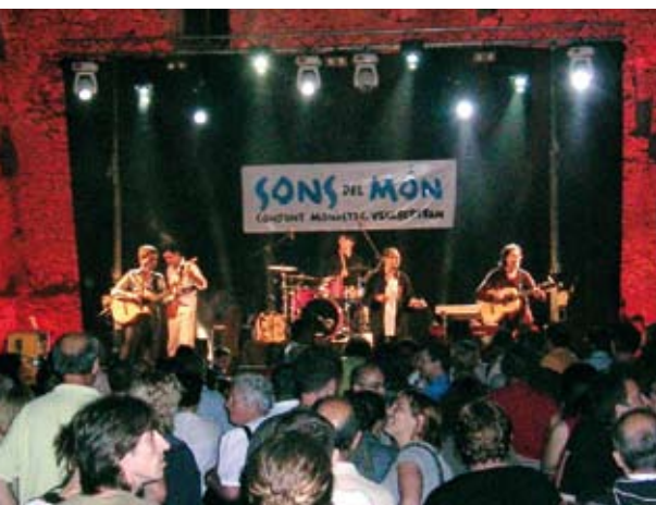
Actuació a la plaça del Fort.

Acabem l'entrevista fent un passeig per la resta del monestir. Curiosos, no paren de comentar la bellesa i fer preguntes sobre el conjunt. Segurament se'n recordaran molt temps, del concert d'avui. A la nit, la unió de la nostra joia arquitectònica amb l'alegria viva de les persones al ritme de la música, en una nit tan especial, feia una comunió màgica.