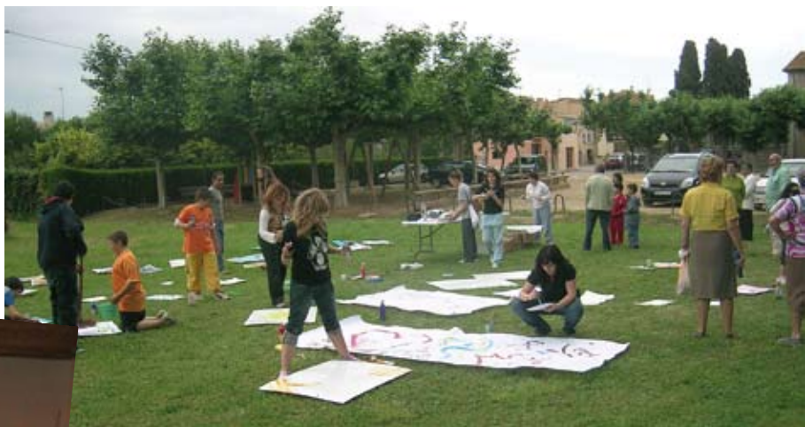
Taller de pintura juvenil