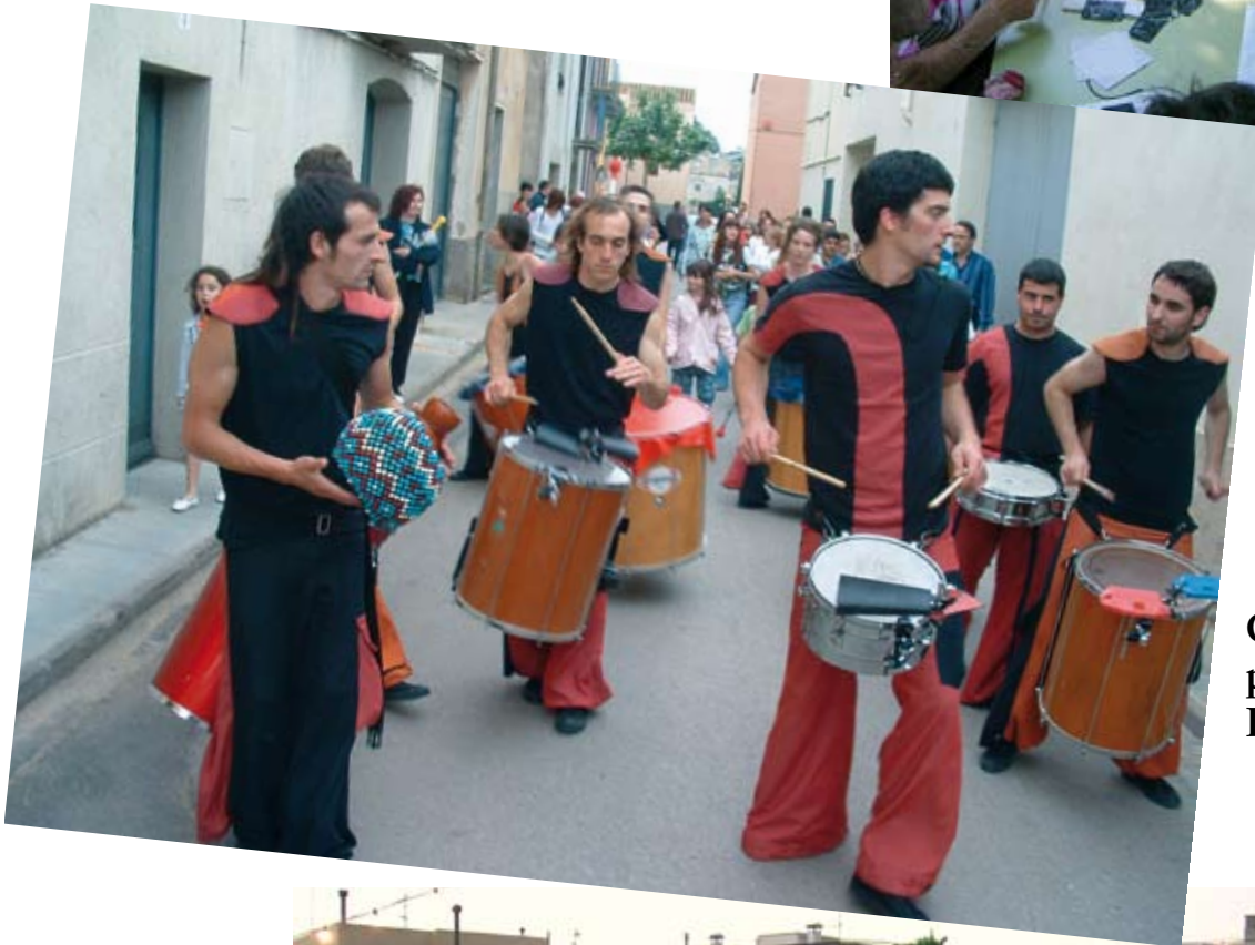
Cercavila de percussió: Bloc Quilombo