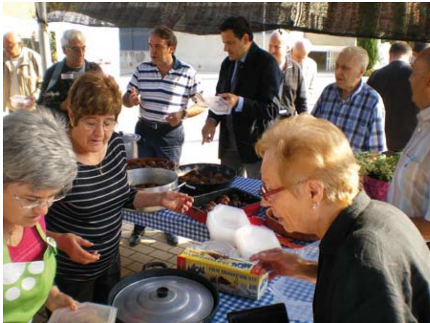
Parada de venda de pomes de relleño, amb l'alcalde i el delegat d'Agricultura degustant les pomes.

Com si es tractés d'una gran obra de teatre, Vilabertran escenifica des de fa set anys una de les seves representacions més importants. Un nombrós públic vingut de diferents indrets de la comarca s'arriba a Vilabertran, per a presenciar i fruit d'una jornada on es combina la tradició i els oficis en forma de parades i passejades amunt i avall.