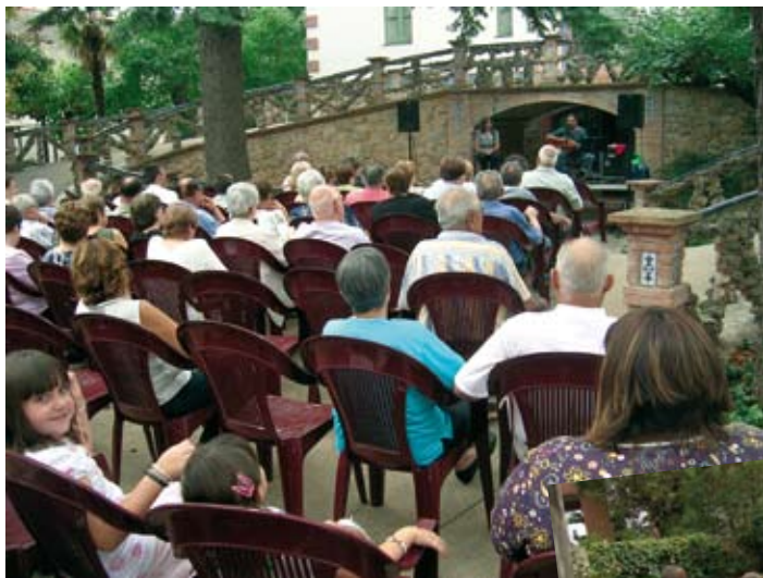
11 de setembre, Diada de Catalunya