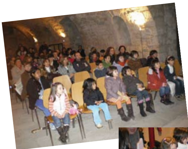
Visita dels patges reials