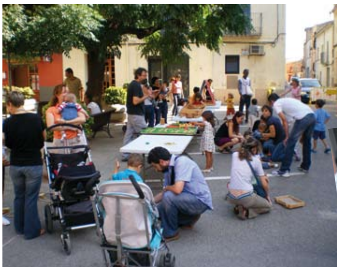
Festa de Sant Ferriol