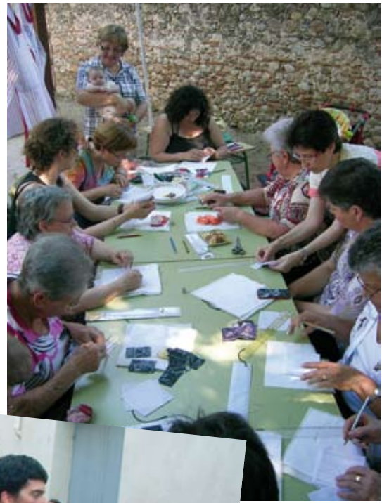
Taller de patchwork