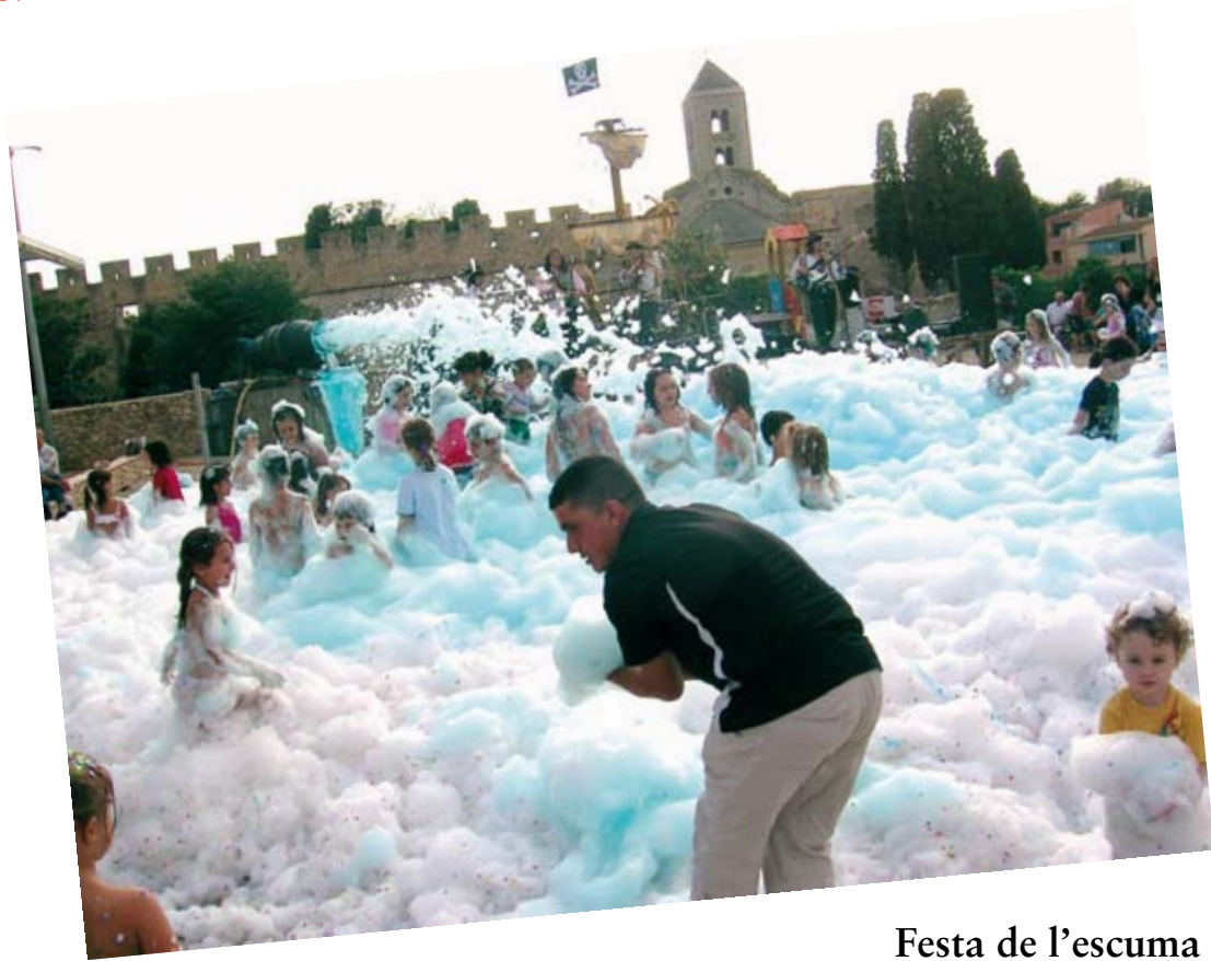
Festa de l'escuma