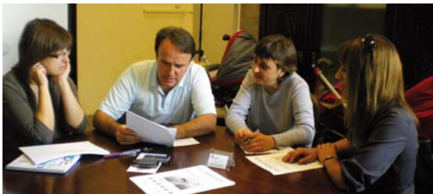
Reunió amb una representació de l'AMPA de l'escola.

associatiu per assolir objectius comuns. Des de l'Ajuntament, donarem suport a aquesta iniciativa en tot allò que sigui necessari. D'altra banda, el suport econòmic aconseguit procedent d'altres institucions per a les associacions, que enguany ha assolit la quantitat de 20.300 €, xifra mai aconseguida fins ara per a aquesta finalitat. Gràcies a aquesta font de finançament, al poble s'hi han pogut realitzar un gran nombre d'activitats sense gravar el pressupost municipal. Continuarem treballant