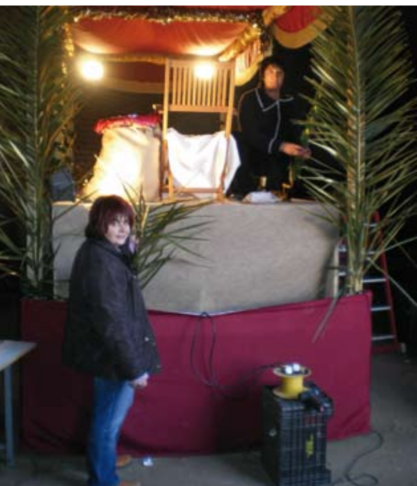
Posant els últims retocs a la carrossa nova.

Tenim intenció de continuar amb la nostra tasca i participar en les activitats que l'Ajuntament vulgui organitzar, des de preparar un Carnestoltes ben lluït per a la mainada fins a col·laborar activament en les activitats del Centenari de la Torre d'En Reig i la Festa de l'Arbre, i totes aquelles ocasions que es puguin presentar per animar la vida social del nostre poble.