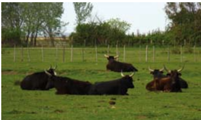
Pastura de toros a la Camarga.

Més d'un centenar de ramaders es dediquen a la cria dels toros i dels cavalls, dos importants símbols de la zona, que podem veure en llibertat pasturant pels prats entre els aiguamolls.