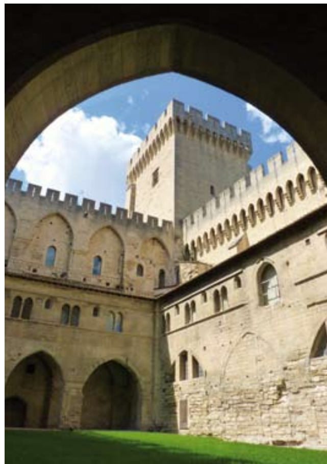
Palau papal d'Avinyó.

Un cop visitat aquest esquix d'Itàlia enmig de França podem anar fins a Arles, l'anomenada Arelate dels romans, que Juli César ordenà construir i convertí colònia de la VI Legió. Aquesta ciutat, que de la plaça en diuen Fòrum des de l'època romana, ens convida a endinsar-nos en el passat. Visitarem l'amfiteatre romà, que juntament amb el de Verona i el de Nimes, es troba entre els millor conservats del món. Ja no hi ha gladiadors, però la sang s'hi continua vessant durant la temporada taurina, que esdevé causa de primer ordre en aquesta ciutat. Farem un cop d'ull també al teatre antic, que conserva algunes grades i talls de columna. Van Gogh i Gauguin van estar per Arles i la Camarga pels volts del 1888.