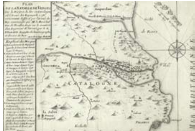
Reproducció d'un plànol antic amb la llegenda escrita en llengua francesa sobre la batalla de Verges.

Un segon atac contra Ultramort arribà per part de les tropes franceses que havien passat per Ullà i per Torroella. Els francesos, en efecte, atacaren per tres punts i, en especial, desbordaren per la riba dreta els espanyols a Torroella. També Ultramort va resistir les tropes de Carles II, però finalment caigué i com la major part de les viles i vilatges del voltant va ser sotmesa a saquejos, violacions, incendis i pillatge: la Sala, Ultramort, Parlavà, Fonolleres, Sant Iscle, Serra de Daró, Casavells, Matajudaica, Ullastret, Llabià, Fontanilles i Gualta.