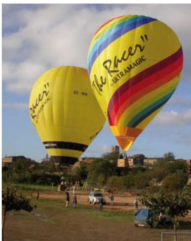
Ultramàgic ha estat present en moltes de les enlairades de globus celebrades al poble.