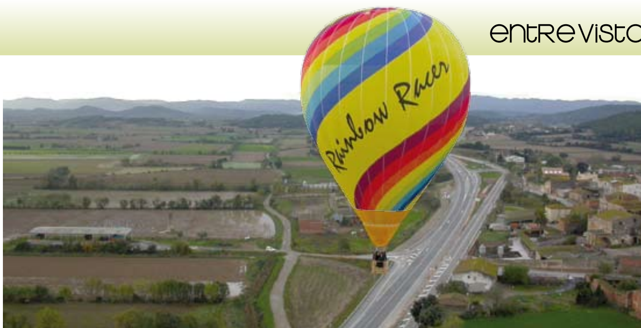
Vista del poble des de dalt del globus.