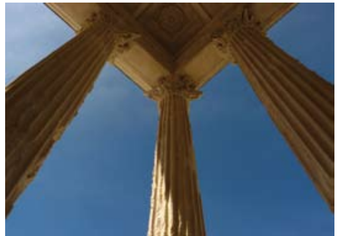
Detall de la Maison Carrée.

Ens podem atansar també als Jardins de la Font i visitar un altre monument imprescindible, el Temple de Diana o de la Font, edifici que, contràriament al nom que se li ha donat, es creu que albergava una biblioteca o unes termes en l'època romana.