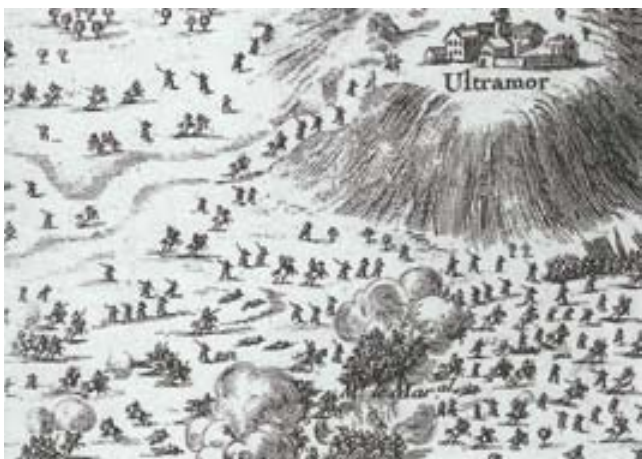
Gravat publicat a la pàgina 163 del llibre.

En l'esmentat llibre, a la pàg. 163 hi apareix el gravat que representa Ultramort enlairat. Les tropes espanyoles, un cop les franceses han passat del gual de Verges "es desbanden en la seva fugida, seguides de ben a prop per la cavalleria enemiga..." A l'alçada d'Ultramort, darrere d'una rasa, Boneu formà un mur de piques i mosquets que, com en els vells temps de la Bicoca, mantingué a ratlla la cavalleria francesa con mucha ordenanza y disciplina militar fent-li front totes les vegades que intentà aproximar-s'hi, formándose y deteniendo el ímpetu de los franceses que les iba cargando . Recordeu que la Bicoca, als afores de Milà, fou la primera batalla amb infanteria moderna amb foc en línia. A la fi, seguint instruccions de Conflans, Boneu es retirà en bon ordre fins a Foixà, sempre protegint els soldats de les unitats desbandades, i des d'allà agafà la via de Girona. A Foixà, precisament és on s'havia enretirat momentàniament el comandament hispànic.