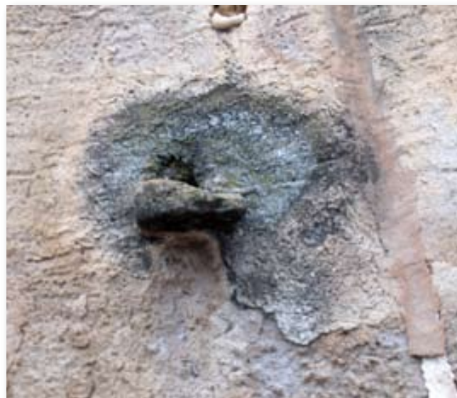
Gàrgoles o pedres que actualment encara sobresurten d'algunes façanes i que servien de desguassos per abocar a l'exterior de les cases l'aigua de l'aigüera.