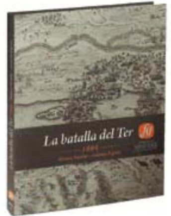
Imatge del llibre.

L'escenari de guerra a Amèrica del Nord, representat per colons francesos i anglesos, va ser conegut a les colònies angleses com la Guerra del rei Guillem.