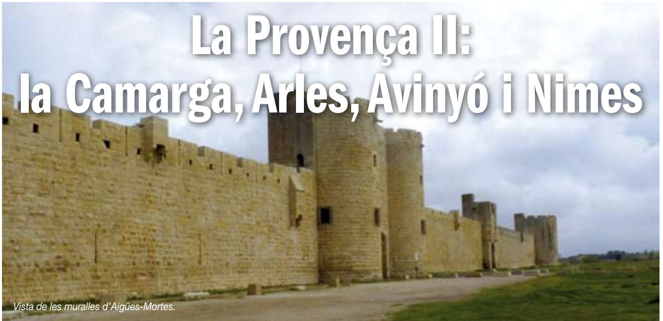
Vista de les muralles d'Aigües-Mortes.

En aquesta nova entrega continuareu descobrint-vos la Provença que, potser recordareu, us vaig dir a l'anterior revista, és una de les regions més pintoresques i assequibles del sud d'Europa, situada a només tres hores de casa.