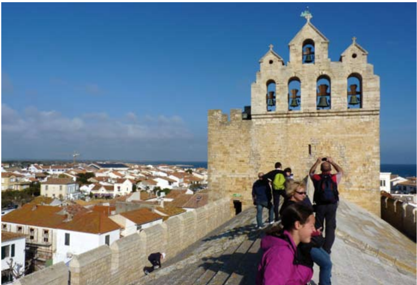
Vistes de la teulada de l'església de Saintes-Maries-de-la-Mer.

Tornant de Saintes-Maries podem visitar les maresmes, els estanys i les Salines de Giraud, al nord de la Camarga, paisatge molt planer i d'una bellesa salvatge, ideal per passejar-hi amb bicicleta.