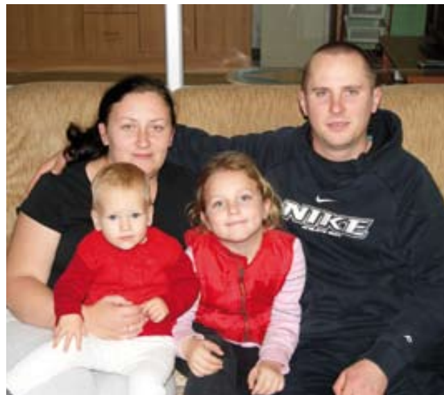
La família Minkus a la casa d'Ultramort.

No, abans d'arribar aquí vàrem estar treballant un any a València, en la recollida de la fruita. Va ser allà on ens vàrem conèixer.