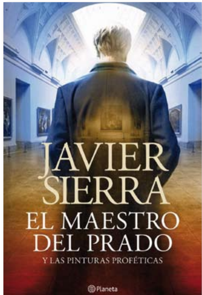
Portada del darrer llibre escrit per Javier Sierra.

ficció que té a veure amb els misteris de la vida i la mort, i que, per descomptat, anirà signada amb el nom del poble.