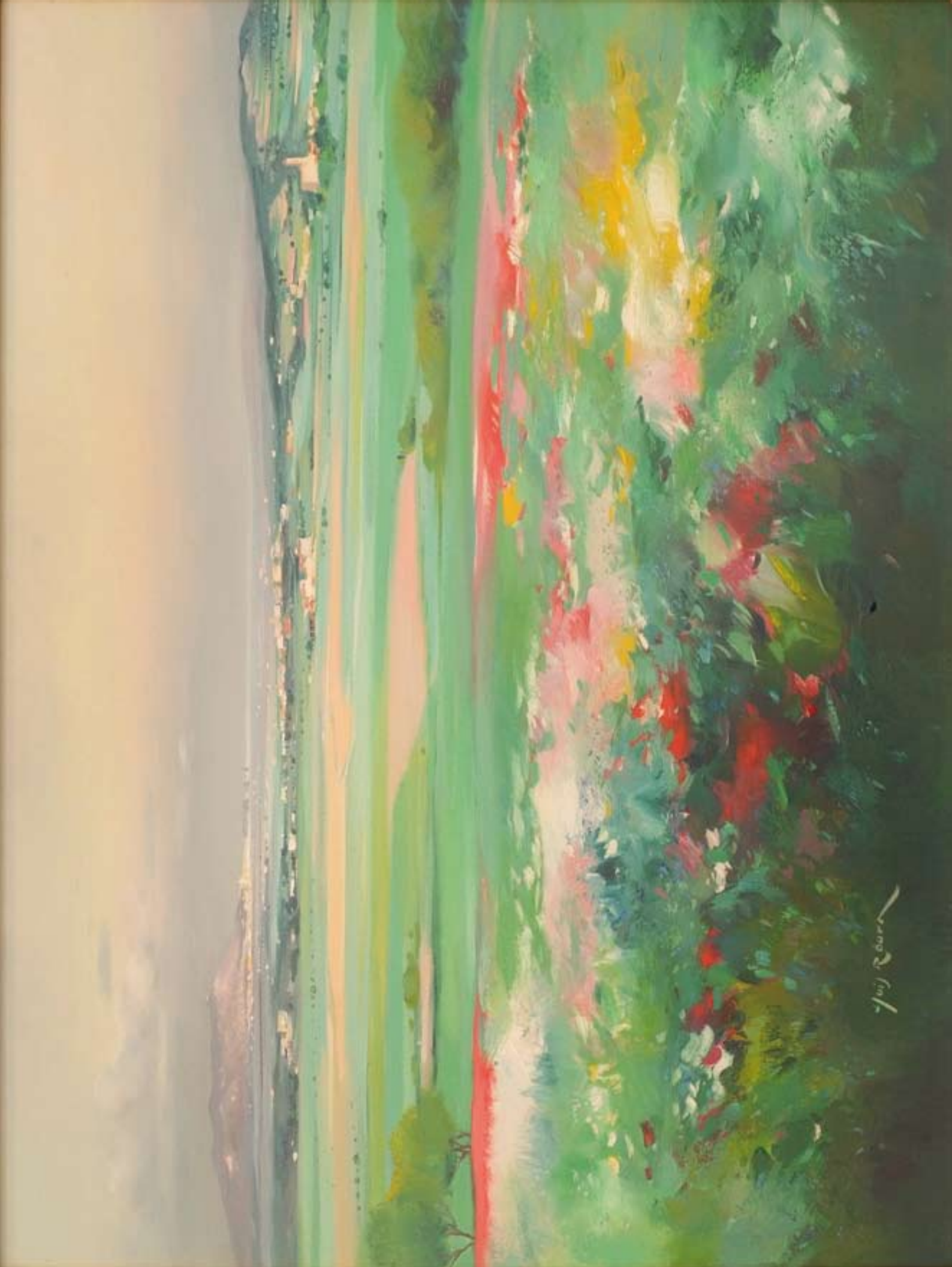
Fotografia de la pintura a l'oli de Lluís Roura cedida molt amablement pel restaurant Can Quel de Foixà, en la qual es pot veure el nostre poble, entre d'altres.