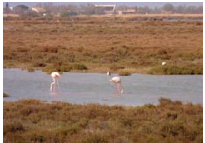
Flamencs roses a les llacunes.

Just a tocar Aigües-Mortes trobem unes de les salines més grans d'Europa, de 10.800 hectàrees de superfície i amb una producció de 250.000 quilos de sal anuals, d'on surt l'apreciada Fleur de Sal . Un tren turístic et porta a fer el recorregut per aquest espai, on pots gaudir d'un paisatge de llacunes rosades, on hi viuen els flamencs roses i muntanyes de sal blanquíssimes que ofereixen al visitant un contrast cromàtic espectacular.