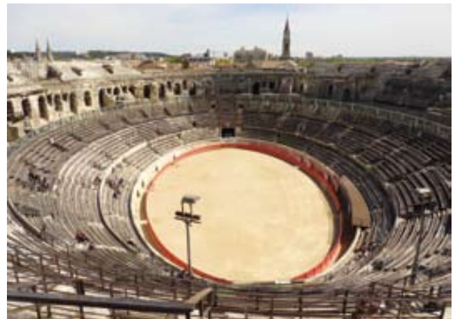
Vista interior de l'Arène de Nimes.

Al centre de la ciutat de Nimes s'ha de destacar la Maison Carrée (casa quadrada), un temple romà del S. I aC, dedicat a la glòria dels néts de l'emperador August. Convertit en església durant l'edat mitjana, és actualment un museu.