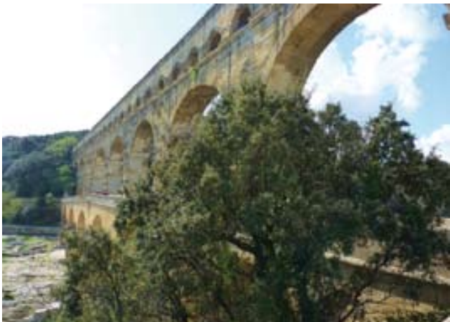
Pont du Gard (aqüeducte romà).

Per completar aquests dies proposo una última excursió: visitar el Pont du Gard, un dels aqüeductes romans més ben conservats del món, patrimoni mundial de la UNESCO des de 1985. Consta d'una construcció de tres nivells, de 49 metres d'alçada i 275 metres de longitud en el nivell més elevat. Sobre el tercer nivell hi discorre un camí i un conducte d'aigua d'1,8 metres d'alçada i 1,2 metres d'amplada, amb un pendent del 0,4 % que permet que discorri l'aigua còmodament. Es construí l'any 19 aC per alimentar d'aigua la ciutat de Nimes, on hi transportava 20.000.000 de litres d'aigua cada dia.