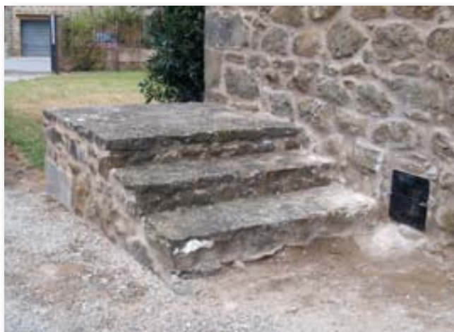
Escales que antigament feia servir la gent per pujar al damunt dels cavalls o dels carros.