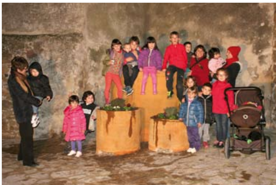
Grup de nens que han col·laborat en la plantada de flors.

Algunes de les diverses obres previstes dins del Pla Únic d'Obres i Serveis de Catalunya (PUOSC) per a aquest any han quedat ajornades per als exercicis de 2014 i 2015, atès que la Generalitat de Catalunya ha modificat els terminis d'adjudicació de les actuacions incloses a les anualitats 2011 i 2012. Es tracta de la 3a fase de les obres de construcció del centre cívic municipal, la millora del paviment i serveis de diferents carrers i camins, i la pavimentació d'una part la zona esportiva municipal.