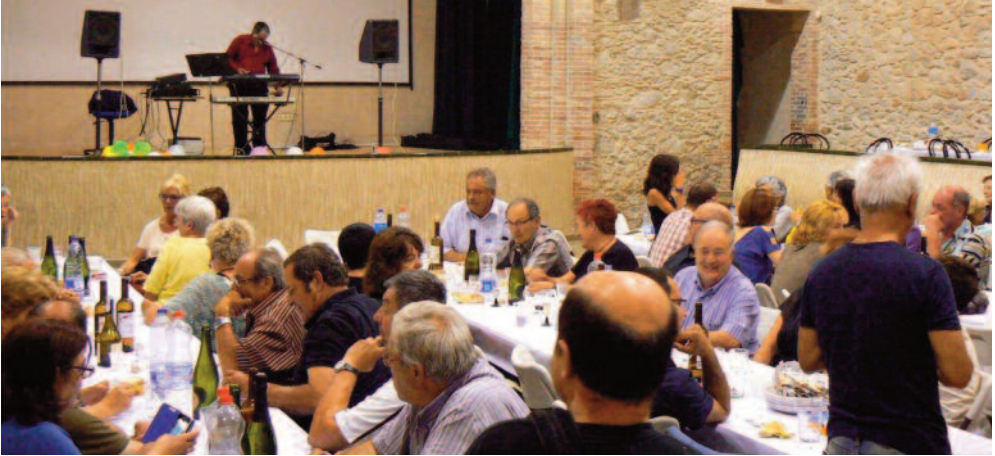
La revetlla de Sant Joan va acabar amb ball.

Les previsions meteorològiques van fer que, finalment, la revetlla de Sant Joan se celebrés a l'interior de la Sala de Ball de Torroella, el dimarts 23 de juny. Un centenar de persones van assistir al sopar de revetlla, que va acabar amb ball a càrrec de l'Esteve Esparch.