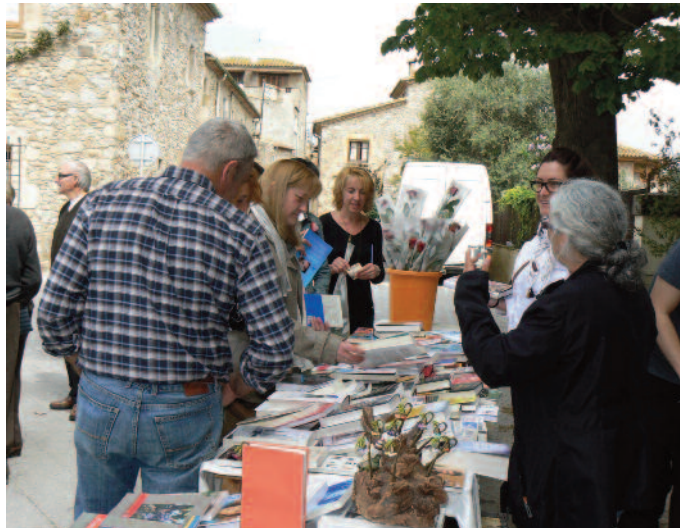
La parada de Sant Jordi, a la plaça de l'Ajuntament.

A Torroella, la diada de Sant Jordi se celebra cada any el diumenge més proper al 23 d'abril. Enguany, va tenir lloc el 26 d'abril, amb la tradicional parada de llibres i roses, organitzada per la Comissió de Festes i el Centre d'Estudis del Baix Fluvià, a davant de l'Ajuntament, beneficiats pel sol que lluïa. La parada es complementava amb el tradicional mercat de segona mà i d'antiguitats dels diumenges al voltant de la plaça.