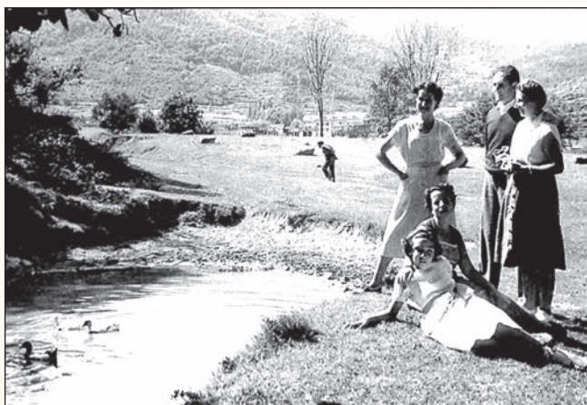
Bassa d'aiguavella 1947.