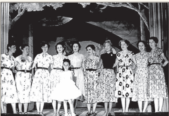
Fent teatre a l'Esbart.