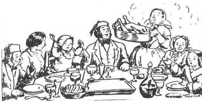
El pollastre farcit olorós i fumenjant, entronitzat solemnement a la taula de Nadal. Lola Anglada (Extret del Tradicionari del Nadal català)

Cuinarà també amb tota cura les pintades, els ànecs, aquests els acompanyarà amb peres. No són pas pel dia de Nadal, s'ho menjaran per Sant Esteve i les sobralles s'ho emportaran amb tapers els seus fills i filles.