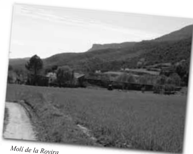
Molí de la Rovira.