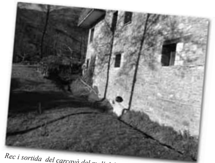
Rec i sortida del carcavà del molí del Noc.