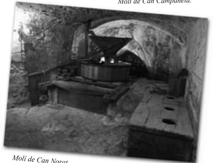
Molí de Can Norat.