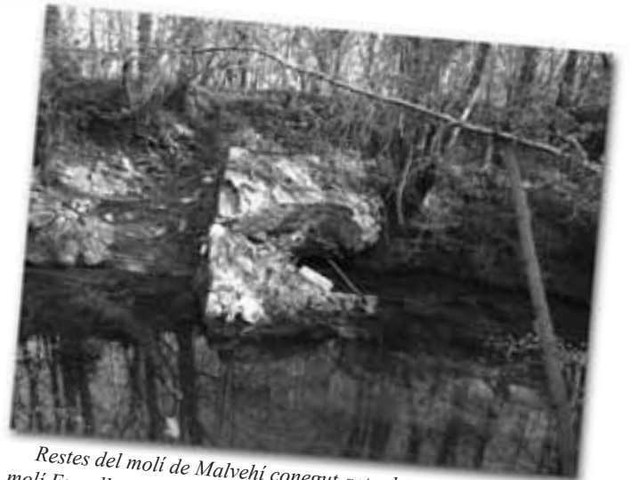
Restes del molí de Malvehi conegut actualment amb el nom de molí Espallat.