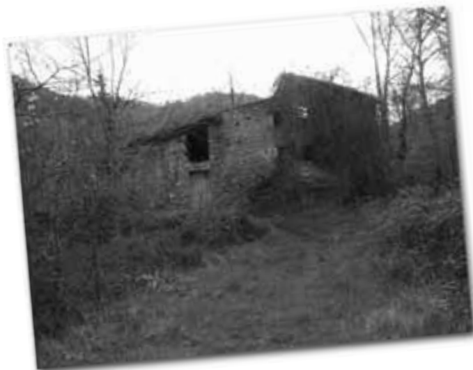
Molí de Can Saderra.