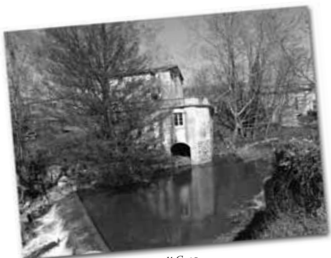
Sortida del carcavà del molí Gros.