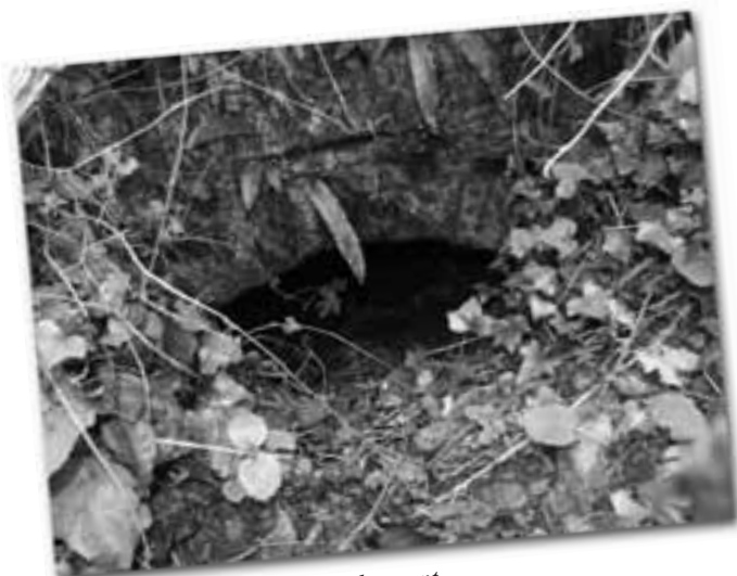
Restes del molí Vell de Ribrugent.