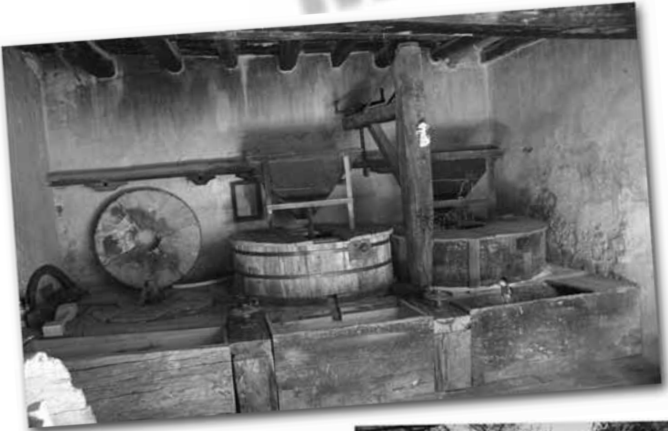
Molí de la Conqueta.