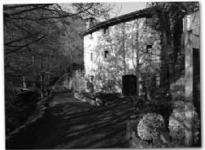
Molí de Can Campaneta.