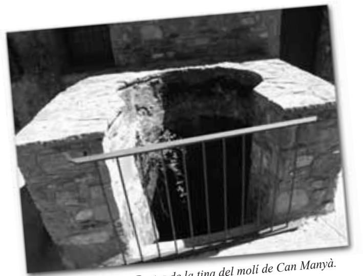
Restes de la tina del molí de Can Manyà.