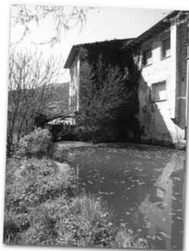
Bassa del molí Petit.