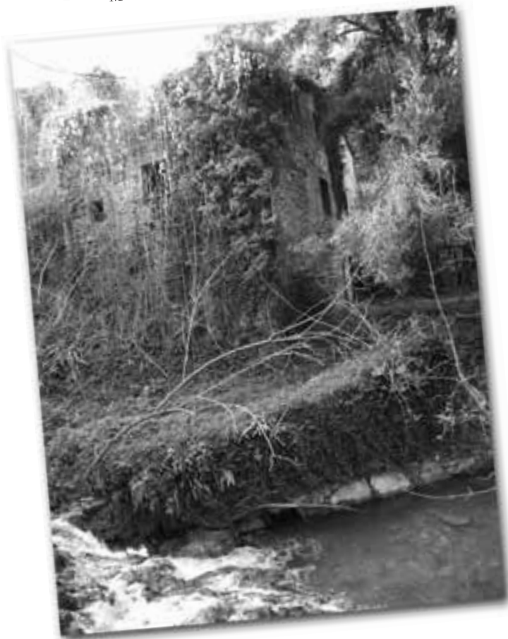
Molí de Can Mates.