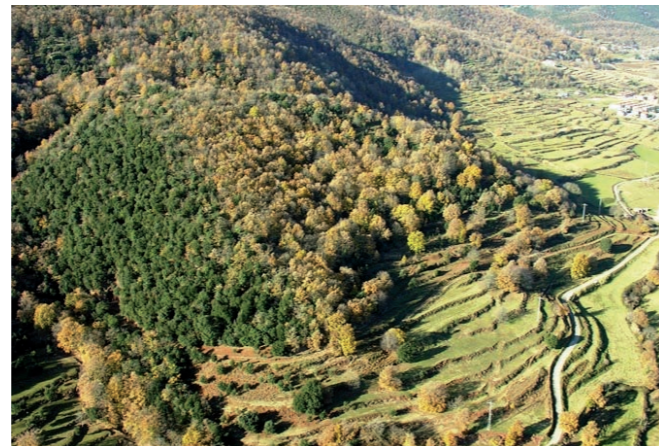
Vista del volcà de Sant Marc

Acabem de travessar el petit torrent de Font Perera i enllaçarem amb la carretera del Grèvol. Aquí s'acaba el