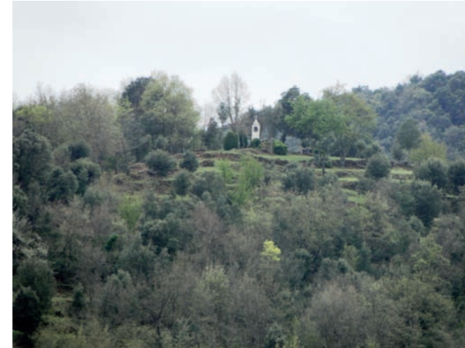
Vista de Sant Marc

tram comú amb l'itinerari núm. 25 (que continua pujant per la dreta). La font Perera, avui perduda, es troba just a sota aquest indret. Nosaltres seguirem la carretera de baixada; el volcà ens continuarà quedant a la nostra esquerra. Aquest tram és molt boscós i la humitat fa que hi hagi abundador de molsa.