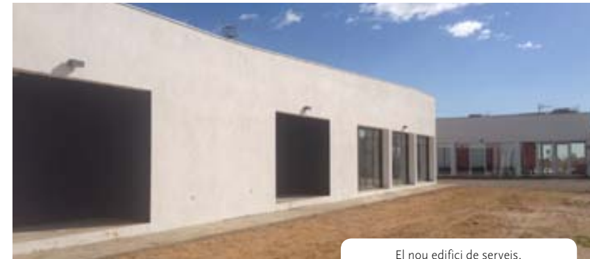
El nou edifici de serveis.

La zona esportiva de Miànegues, les obres de la qual l'Ajuntament està executant per fases, ja ha estrenat una peça clau del complex: l'edifici polivalent destinat a donar servei a les diferents instal·lacions i als esdeveniments que es duguin a terme. Es tracta d'un edifici d'un sol nivell, de planta rectangular, orientat de forma perpendicular al camp de futbol. Consta d'una sala polivalent, lavabos i vestidors.