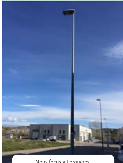
Nous focus a Porqueres.

L'Ajuntament de Porqueres segueix duent a terme la campanya de modernització de l'enllumenat públic, per tal de contribuir a l'estalvi energètic. Així, aquests darrers dies, s'han canviat els focus de la rotonda de l'entrada sud de Porqueres i els del Baixador de Mata. A més, s'ha instal·lat un nou focus a la zona d'aportació de residus del carrer Estació. Entre les actuacions que s'han realitzat cal assenyalar la substitució d'un punt de llum i la de dos fanals al carrer Eugeni d'Ors. També s'ha instal·lat un focus al parc infantil del carrer Pla de l'Estany, cedit per l'empresa IGNIA. Tots els nous punts de llum són amb tecnologia LED, molt més eficient i que contribueixen a l'estalvi energètic, ja que gasten menys.