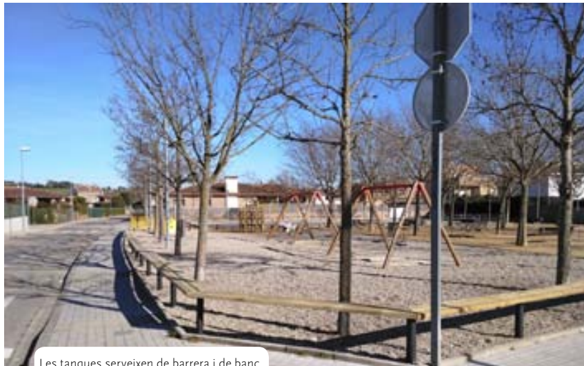
Les tanques serveixen de barrera i de banc.

Després de treure totes les sorreres dels parcs infantils i d'esbarjo per una qüestió de salubritat, l'Ajuntament de Porqueres hi ha eliminat o substituït algunes tanques, per donar una sensació d'espais més oberts. Des de l'Àrea de Serveis s'ha optat per una mena de tanca que cobreixen dues necessitats: d'una banda