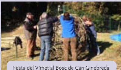
Festa del Vímet al Bosc de Can Ginebreda

El web del Bosc de Can Ginebreda va rebre un total d'11.000 visites només el 2015. La majoria de visites provenen de les comarques de Barcelona, seguides per les de Girona. Pel que fa l'àmbit mundial, han visitat el web del Bosc persones de països com ara Brasil, Estats Units, França, Rússia, Alemanya i Itàlia.