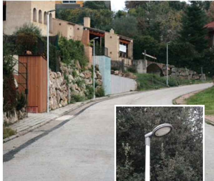
Casellas Davall ha millorat el seu enllumenat.

En total s'han instal·lat 32 punts de llum. El cost de les obres s'ha repartit entre l'Ajuntament de Porqueres, que ha assumit un 60% del cost, i la junta de conservació de Casellas Davall, que n'ha assumit el 40% restant. El cost total de les obres ha estat de 44.441,87 euros. L'any que ve està previst continuar amb la millora de l'enllumenat de la urbanització amb aquesta col·laboració.