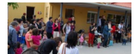
La castanyada va ser tot un èxit.