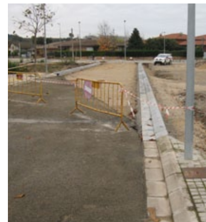
El nou carrer comença a prendre forma.