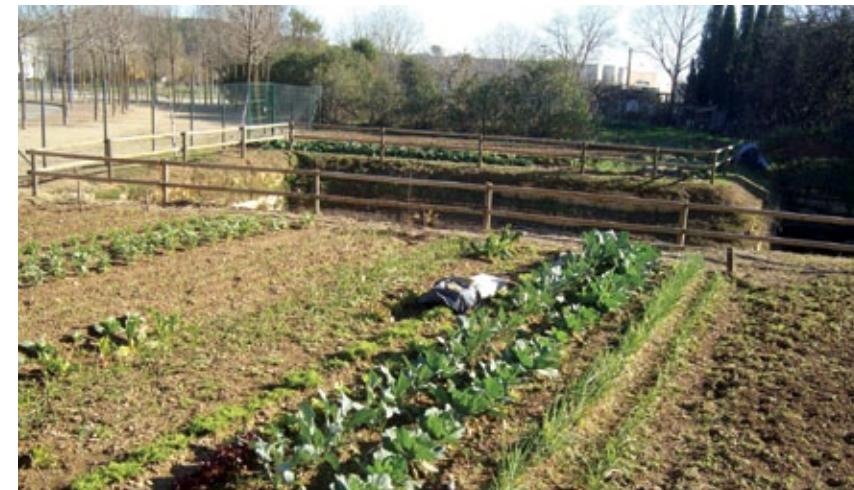
Els horts urbans de Porqueres.

Les persones que estigueu interessades a participar-hi, podeu enviar un correu electrònic a mediambient@porqueres.cat o visitar el web de l'Ajuntament, www.porqueres.cat .