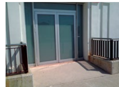
Noves finestres Centre Cívic

s'ha modificat la ubicació i substitució de portes d'emergència que proporcionen un major aïllament. El cost total de la inversió ha estat d'uns 18.500 €, la qual ha estat subvencionada en un 80% per Dipsalut.