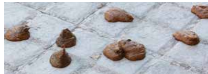
Terra del carrer sant Andreu el 17 de març

si s'escau, imposar una sanció al veí que sigui enxampat sense recollir l'excrement del seu animal. Aquesta és l'única via viable que hem trobat per eradicar, totalment, aquesta falta de solidaritat vers a tots els veïns. No és una actuació amb afany de recaptació, sinó tot el contrari, volem que la gent prengui consciència de les molèsties que actualment estan causant als altres ciutadans. Arran de l'aparició de ràbia a un gos que havia estat a Porqueres, tots els propietaris de gossos, gats, fures i altres animals de companyia, els han hagut de vacunar abans del 27 de juny.