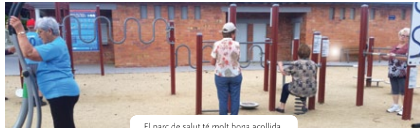
El parc de salut té molt bona acollida.

L'any 2015 es van dur a terme un total de 20 sessions de dinamització al parc de salut de Porqueres i aquest 2016 ja se n'han fet una desena. La participació a Porqueres és molt alta (més de 8 participants per sessió de mitjana), tot i que es vol treballar per augmentar-la. El programa de dinamització al Parc de Salut és una proposta d'activitat física adreçada sobretot a adults i gent gran. L'any 2015, les més participatives van ser les franges d'entre 56 i 85 anys. Les sessions es duen a terme quinzenalment i estan supervisades per un monitor.