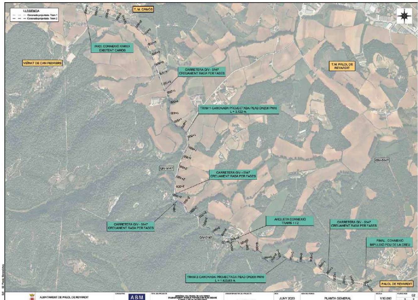
Planell de la canonada d'aigua que va de Camós fins al dipòsit de Palol.

Aquest projecte té un cost de 650.000, euros dels quals la Generalitat en subvenciona 473.987.