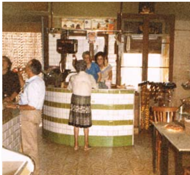
Taulell de la carn i barra del bar als anys vuitanta.

"No estàvem mai sols, sempre hi havia algú que venia, i que s'asseia a la taula", recorden. Era casa de tothom. Quan la casa estava en construcció un avi veí va dir en veure que feien la vora del foc: "goita, jo m'asseuré aquí". La mateixa gent de la casa de vegades es trobava que hi havia gent asseguda al foc i no hi havia espai per a tots. "La gent venia a trucar a la porta i sempre els obríem; i als vespres fèiem petar la xerrada", ens diuen.