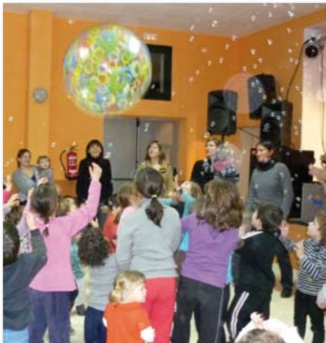
El dissabte a la tarda hi hagué espectacle infantil al casal amb el grup FEFE & CIA.