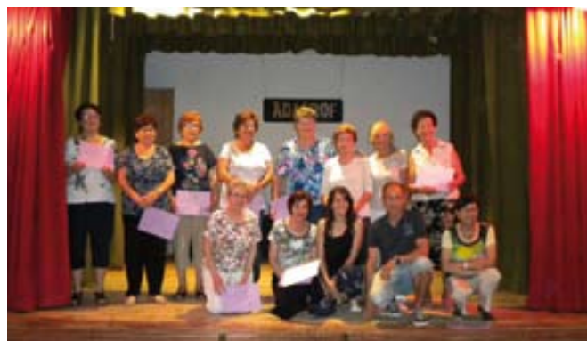
El taller de memòria es fa els dimarts al vespre.

En el nostre dia a dia setmanal es poden realitzar cursets dirigits tant a la mainada com a la gent gran. Alguns dels nostres cursos habituals són: taller de memòria, informàtica, anglès