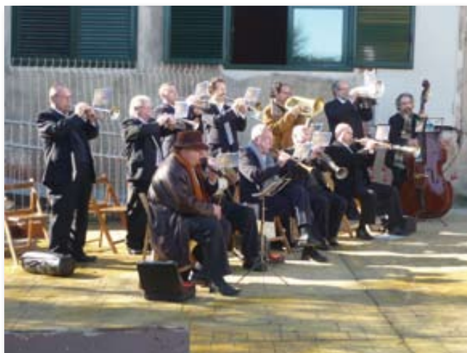
Sardanes amb la COBLA OSONA.

Diumenge 22: al matí, ofici solemne i sardanes; a la tarda, exhibició de hip-hop.