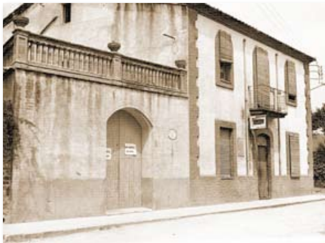
Cal Flequer es va obrir el 1936, abans de començar la guerra.