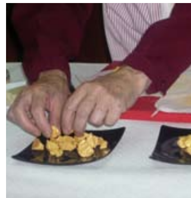
El curs de cuina de l'estiu es va fer els divendres de juliol de vuit a deu del vespre.

per a diferents edats, total balance, gimnàstica rítmica esportiva, ioga, tai-chi, francès, etc. en horaris fora de l'escola. i esperem poder seguir oferint altres activitats i cursos com els que fem a l'estiu (curs de cuina, casalet i altres).