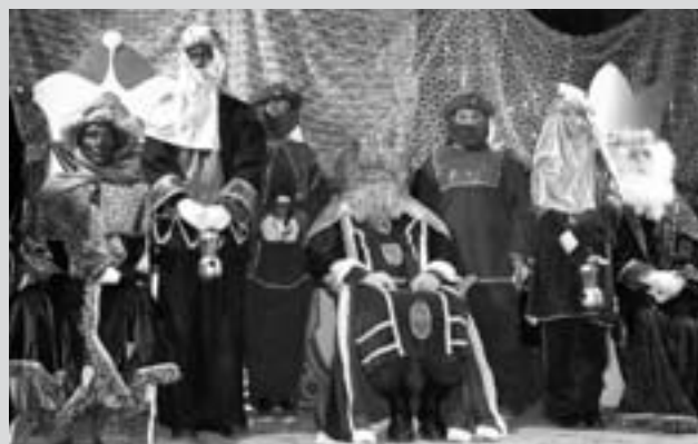
A la tarda-nit els reis van arribar amb carrossa a Beuda i després a l'església Maià, on hi hagué xocolata i quina.