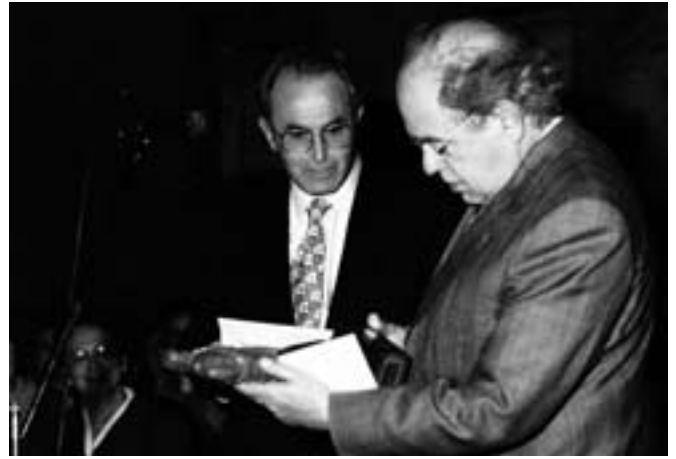
Les reformes del Casal foren inaugurades per Jordi Pujol l'abril del 1998.

Un tema que es pot considerar una assignatura pendent ha estat el retorn dels escolars a Maià. Amb el POUM han fet una reserva per fer unes escoles noves, perquè