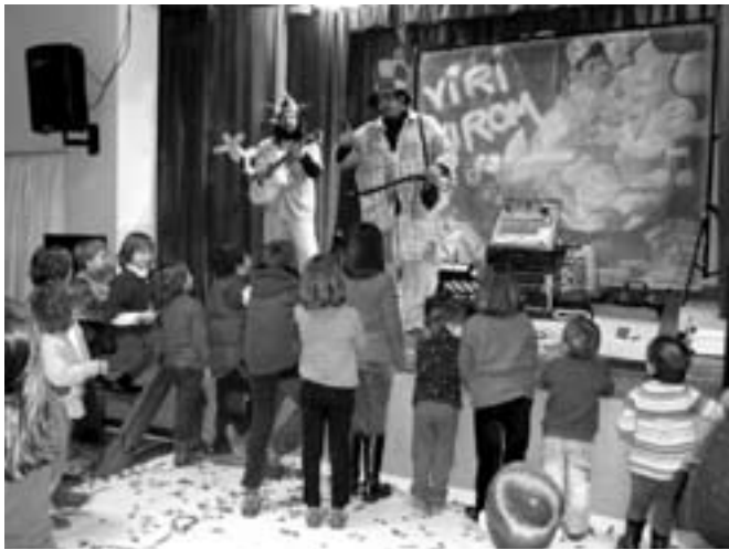
Espectacle Infantil amb el grup VIRI-VIROM.

Diumenge 23: Ofici solemne, sardanes i exhibició de hip-hop.