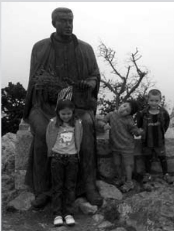
Els més petits també participen de la romeria.