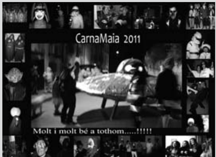
Imatge promocional de CarnaMaià 2011.

A la nit: CarnaMaià 2011, gresca per als més grans.