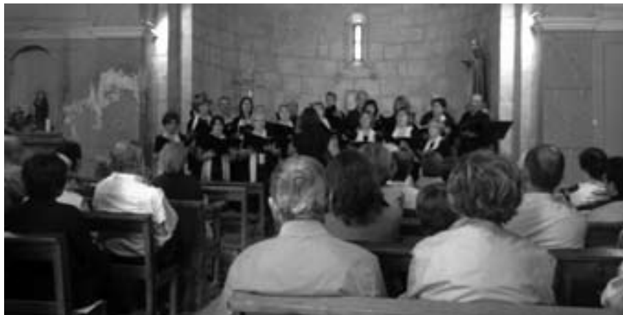
La missa se celebrà amb acompanyament coral i tot seguit concert per part de la coral Josep Ruhí de Bescanó.

Al matí, missa a l'església de Sant Martí de Dosquers. Al migdia, dinar al Casal i després lliurament de records als jubilats.