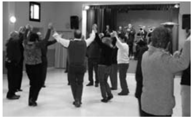
Sardanes a càrrec de la cobla VILA DE LA JONQUERA.