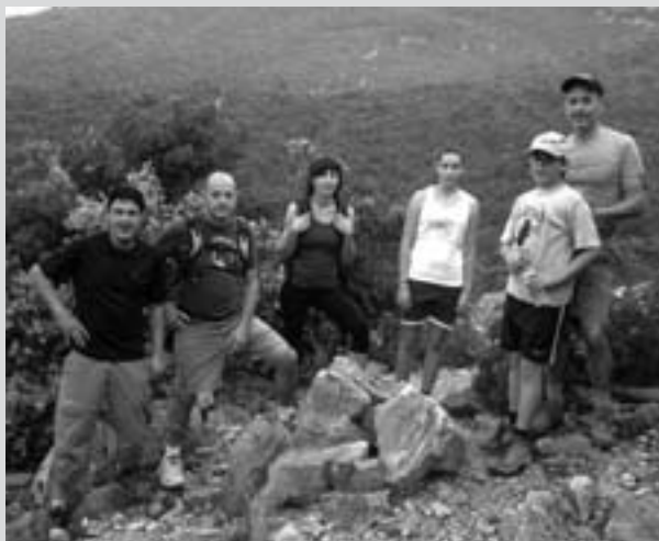
Els més grans aprofiten la diada per gaudir de la natura.