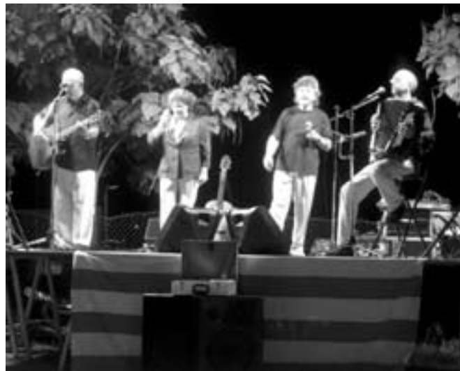
Les havaneres van ser interpretades pel grup Ultramar.

Havaneres a la piscina amb el grup Ultramar, amb sopar de peix, menú infantil i rom cremat.