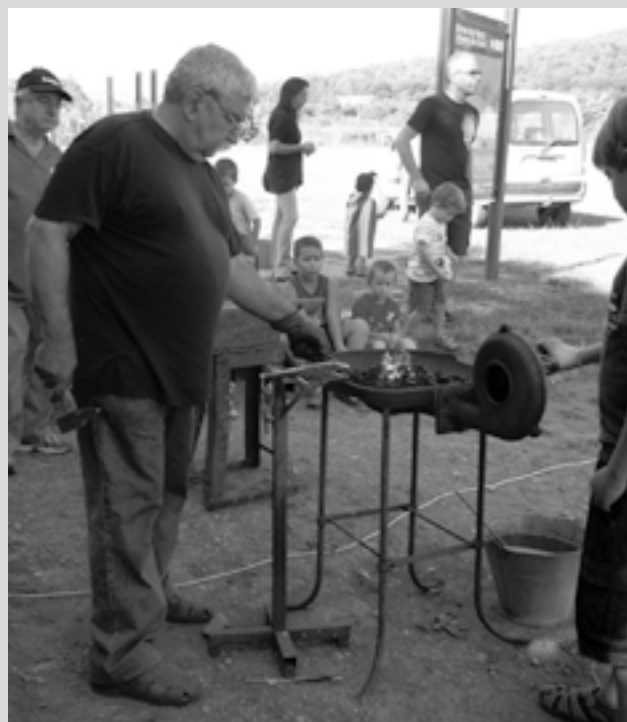
Taller artesà del ferro.