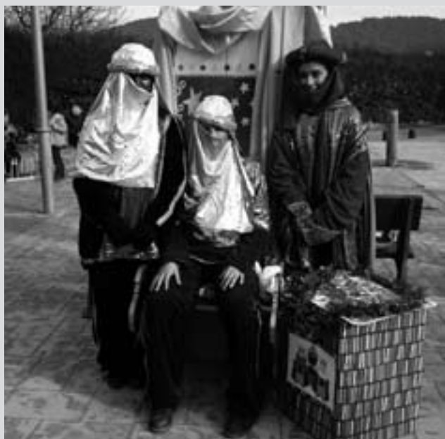
Aquest any com a novetat van venir tres patges (blanc, ros i negre) amb cavalls. Tot un èxit!!!