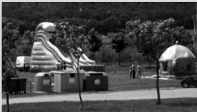
El dissabte durant tot el dia, castells inflables al costat del camp de futbol per a la mainada.

Diumenge 15: ofici solemne i ofrena de panets; sarda- nes; subhasta dels encants; teatre.