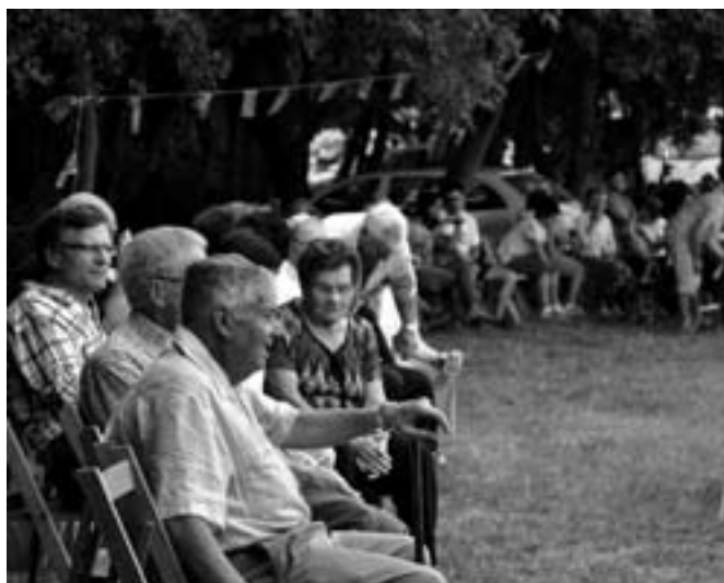
Les sardanes van anar a càrrec de La Principal d'Olot.

24 de juliol: Ofici amb orquestra i sardana al matí; sardanes, trencadissa d'olles per a la mainada i rifa a la tarda.