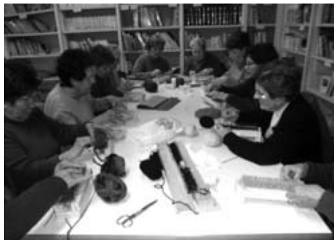
Imatge del taller de memòria (diferent) que es fa per Nadal en què aquest any s'ha fet una bufanda.

Per mantenir l'activitat cognitiva, des de fa quatre anys l'Ajuntament de Maià de Montcal i el Casal organitzen amb el Centre de Serveis per a la gent gran Edat3 Besalú el Taller de memòria setmanal. És una activitat dirigida a mantenir l'agilitat mental, el grau d'atenció, la fluïdesa verbal, els raonaments complexos, el càlcul i la memòria, tant recent com remota.