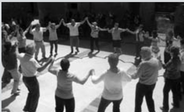
El diumenge al migdia, sardanes a càrrec de la cobla Vila de la Jonquera.