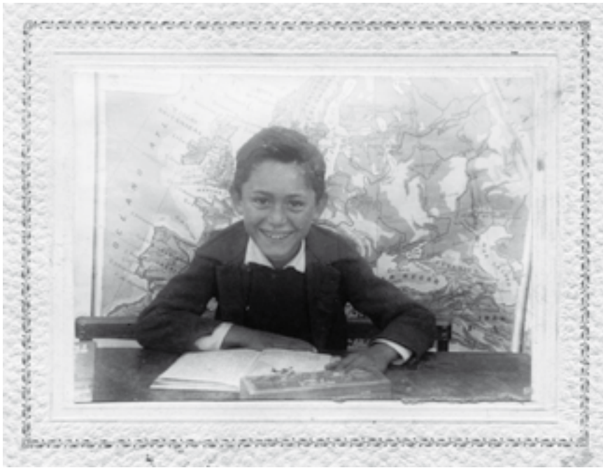
Fotografia de l'època escolar a l'escola de Dosquers.

volia anar davant, i quan s'acabava el temps em vaig decidir, i jo havia guanyat les eleccions i es pot dir que era alcalde però encara no m'ho creia”.