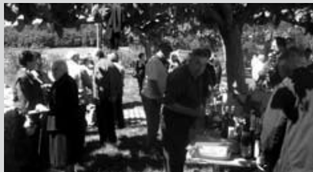
Tradicional subhasta dels Encants.