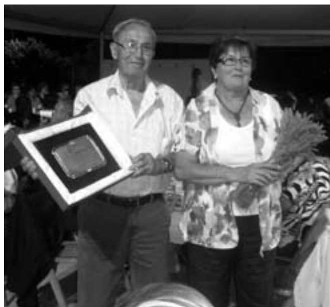
L'alcalde rebé una placa de comiat pels vint anys d'alcalde.