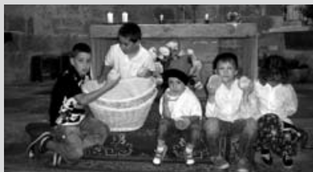
La tradicional ofrena de panets es fa el diumenge després de l'ofici.