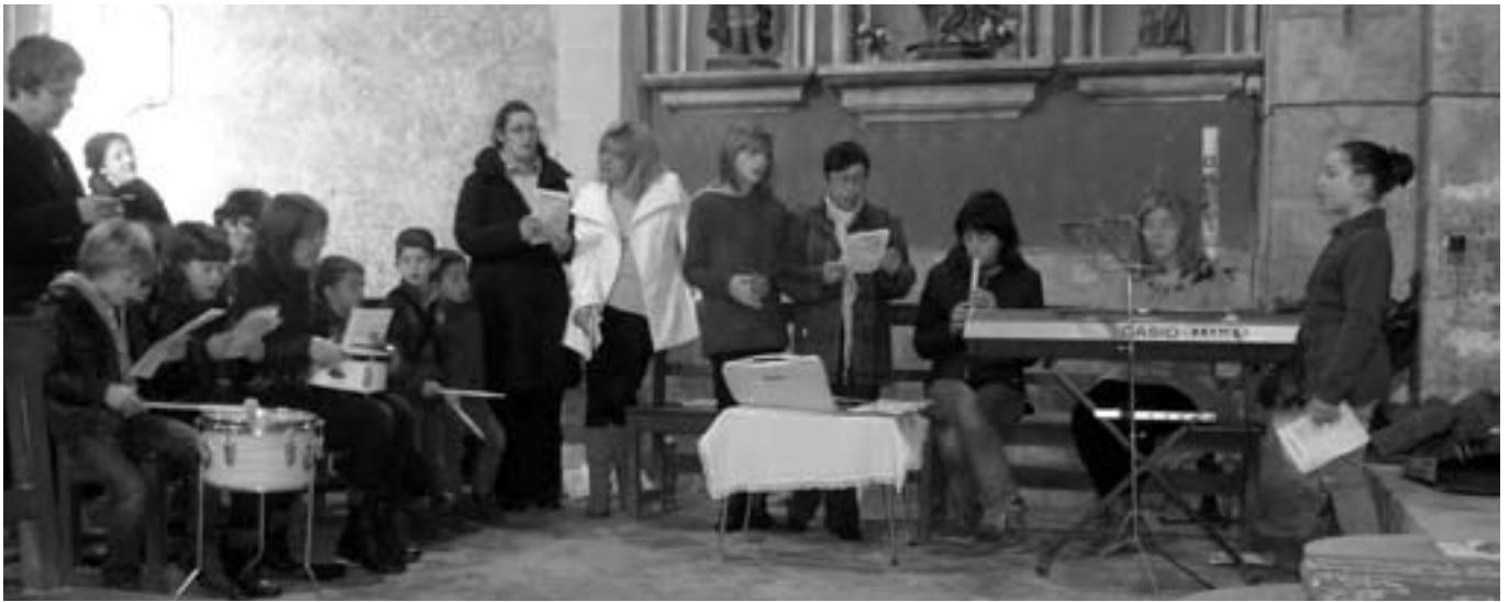
A la missa de Nadal un grup de gent del poble (petits i grans) van acompanyar l'ofici amb cantada de nadales.