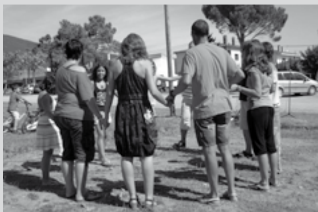
Introducció de punts de sardana per a la mainada i grans.

Al costat del camp de futbol, al matí, esmorzar, hissada de la senyera i cant dels Segadors, lectura de manifest i activitats diverses.