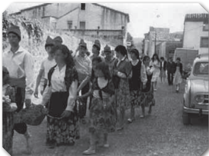
Algunes imatges de la Festa del Roser de l'any 1982