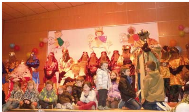
Els Reis de la Tallada.