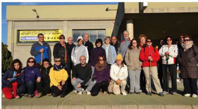
La Marató d'enguany va recollir 321,20 € i va comptar també amb una caminada popular.