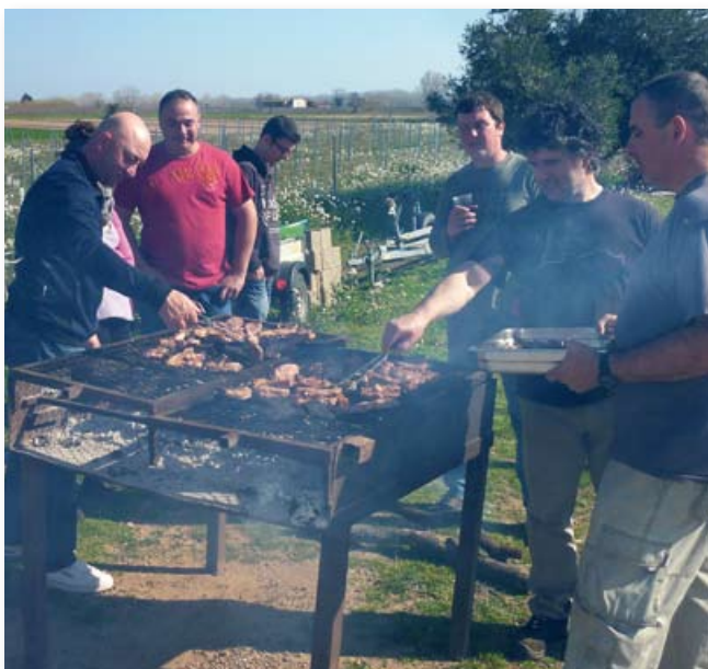
Dinar amb carn a la brasa.