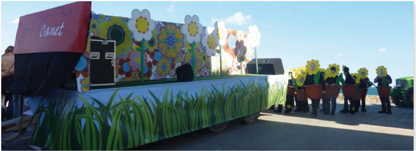
Vista de la carrossa.