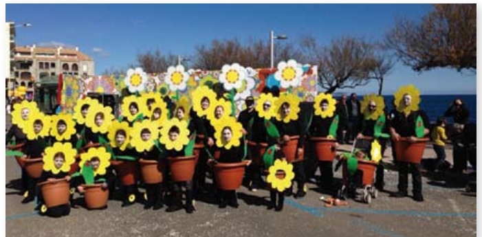
Les flors de Canet.