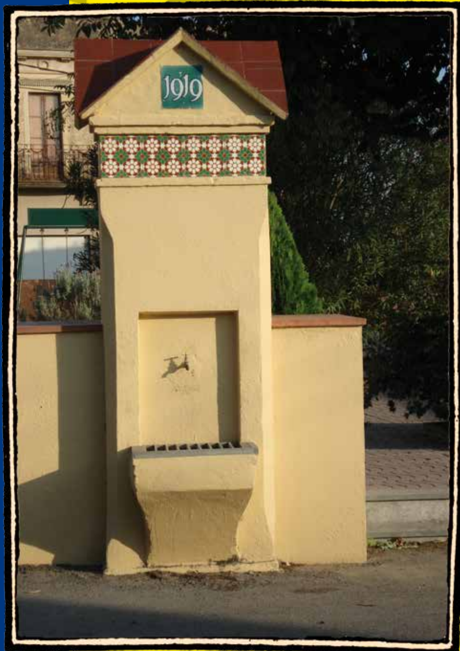
Font de la plaça de l'ajuntament (La Tallada)