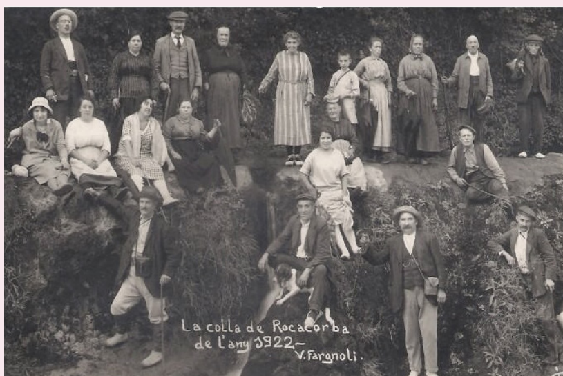
Fotografies de la colla de Rocacorba l'any 1922, recuperades de la copia d'un negatiu del fotògraf V. Fargnoli.