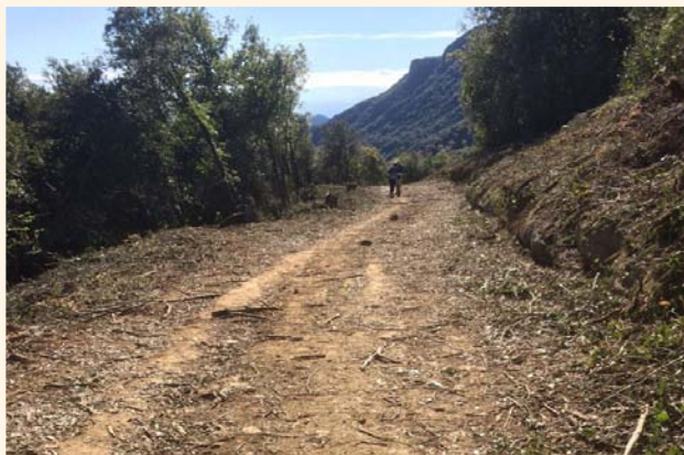
Carretera de Rocacorba

Amb la finalitat de complir amb el Pla de prevenció d'incendis forestals de Canet d'Adri, aprovat recentment, l'ADF, en col·laboració amb l'Ajuntament de Canet d'Adri, s'ha encarregat de l'obertura de la