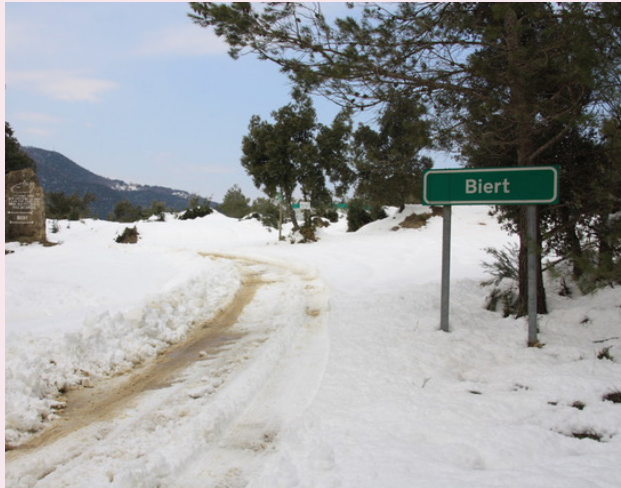
Entrada al poble de Biert.