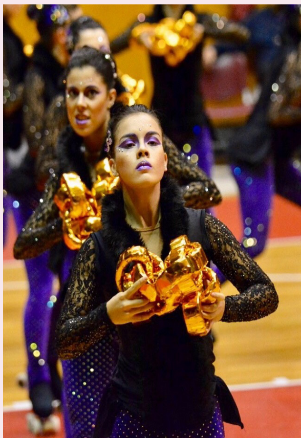
La Laura durant l'actuació del mundial de patinatge

La darrera competició ha estat el mundial executat als World Roller Games , celebrats a la Xina aquest passat setembre, on el