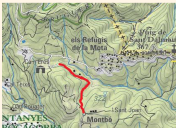
Mapa cartogràfic de la zona on es durà a terme la primera fase de la pavimentació.

Properament s'adjudicarà l'obra de pavimentació de la primera fase de la carretera de Montbó des de Can Basiu fins la Castanyeda. En una segona fase s'arribarà a la urbanització de Montbó, per completar així tot el tram amb carretera asfaltada.