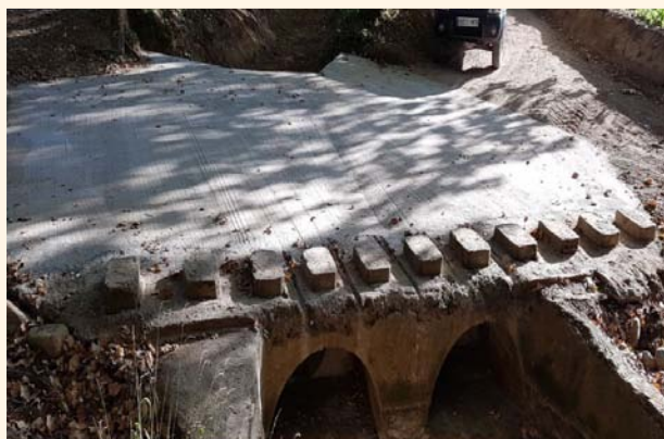
Passera del Torrent del Garrep.