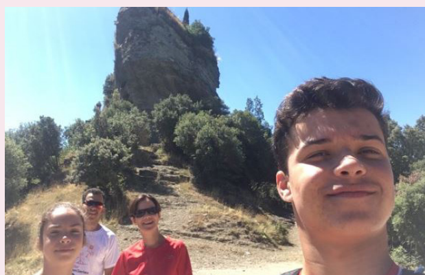
Gaudint el dia en família.

gística. La gastronomia, evidentment , i sobretot la nostra identitat catalana que fa que siguem un poble treballador i perseverant.