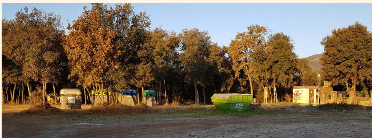
Imatge d'un contenidor de poda.

Pel que fa a l'any 2018 l'Ajuntament va aprovar no incrementar la taxa, amb la voluntat d'incentivar així el bon ús dels contenidors de reciclatge.