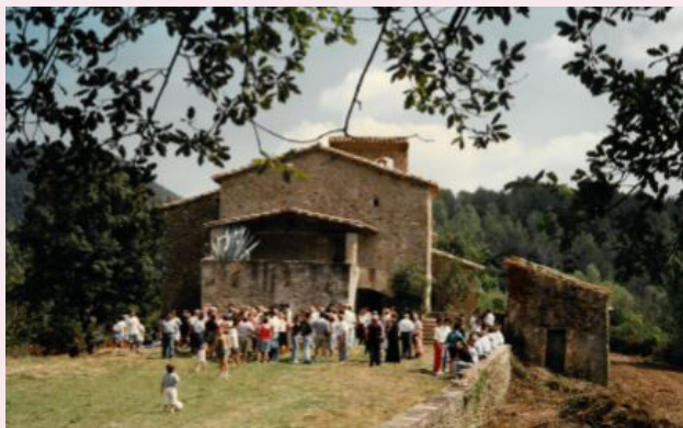
La nova celebració de l'Aplec de Biert l'any 1995.

El meu avi va promoure la festa durant uns quants anys el dia 11 de Novembre, diada de Sant Martí, patró de Biert. Era tradicional fer la missa a l'església, repartir coca i moscatell, i fer el dinar al Restaurant La Sala. Degut a la meteorologia d'aquell temps -plo-