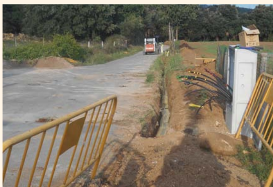
A la il·lustració, l'obertura de la rasa del sector La Roureda a la zona de la depuradora.