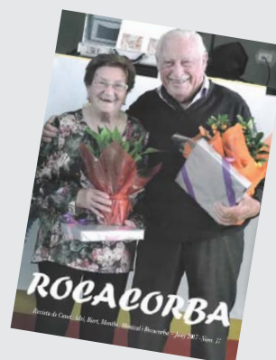
Edició anterior (Juny'17)