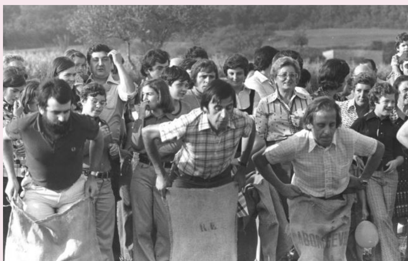
Fotografia de la cursa de sacs de l'antiga Festa Major de Canet d'Adri, on es pot veure com es diverteixen els "ganàpies"