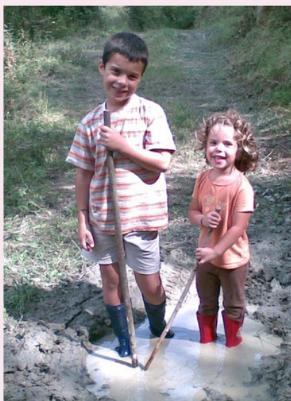
Els nens de l'Antoine de petits, jugant al fang de Biert.

Malgrat que no tenim subministre elèctric, ni aigua, ni internet... per mi, el més important, és millorar el camí i les cunetes de la carretera comunal. L'Ajuntament fa un manteniment anual i és d'agrair, però amb la quantitat de trànsit rodat que hi ha últimament aquest manteniment no dura gaire.