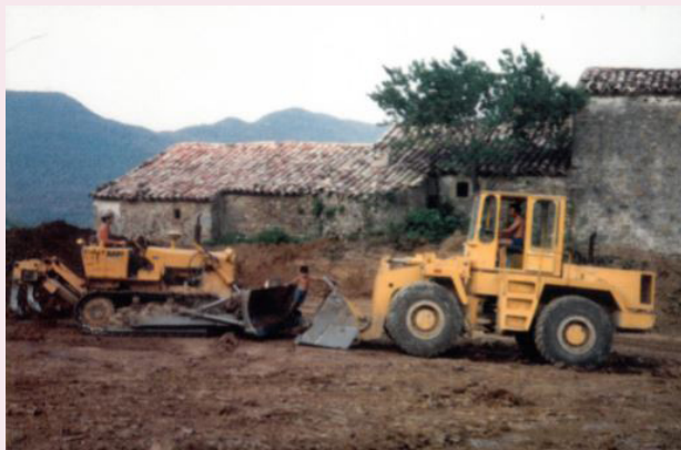
Reforma al solar l'any 1975.

amb la meua dona Betty vam decidir acabar les reformes i venir-hi a viure l'any 1998