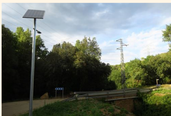
Fanal solar del pont de Mas Batlle.