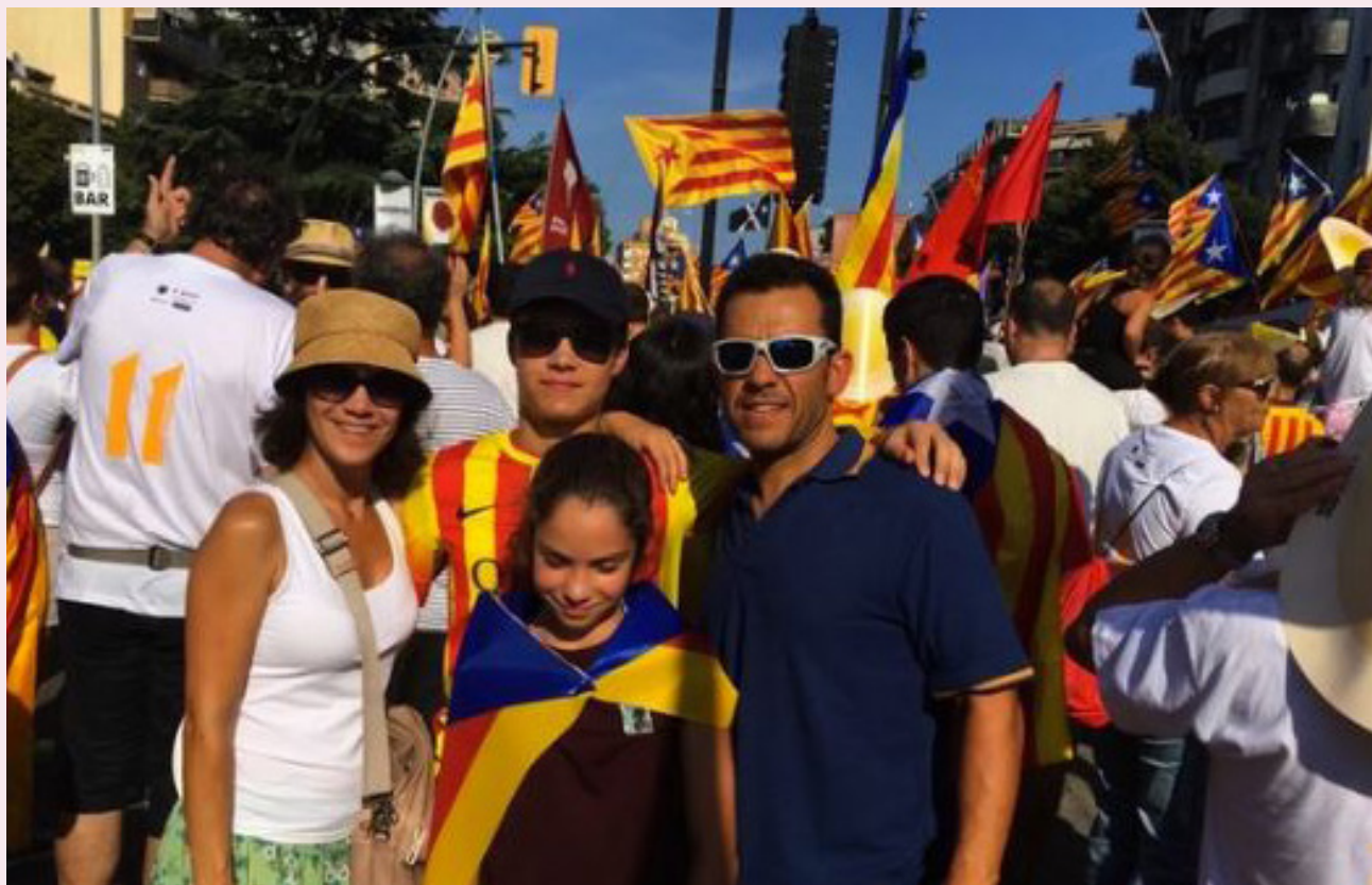
En família celebrant la diada de Catalunya.

Jo els parlo en francès i la meva dona en anglès. La gent el fa estrany veure en quina facilitat canviem de registre quan parlem entre nosaltres. Amb la meva dona normalment li parlo en anglès perquè és en la llengua que ens vam conèixer. Els meus fills, entre ells, evidentment parlen en català !!!