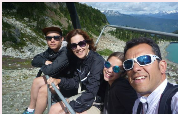
La família de l'Antoine durant una excursió.

El que m'és m'agrada és estar per casa, fer activitats amb la família i fer esport. Des de l'any 2011 faig Triatló a nivell de competició. He participat en el concurs de l'Estartit, la Garmin de Barcelona, i Mitja Ironman