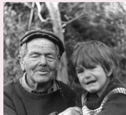
En aquesta fotografia apareixen el germà de Can Valls i el fill de l'Escofet