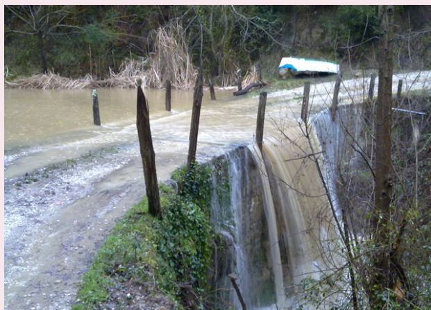
Camí particular d'accés al Soler de Biert, durant un temporal de pluja

Si, vaig néixer a França l'any 1970 a la ciutat de Poitiers, però vivíem al poble de Pujols, que es troba entre Toulouse i Burdeos. De ben petit que ja venia a Biert a passar les vacances ( per Tot Sants, Nadals, Setmana Santa i estiu). Els avis tenien varies finques entre Banyoles i Biert. Quan veníem a Canet ens instal·làvem al Soler de Biert, amb unes condicions molt diferents de les que hi ha ara. No hi havia aigua corrent i havíem d'anar a la font a buscar l'aigua, tampoc hi havia gene-