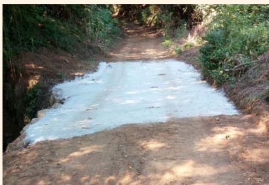
Passera del Torrent del Pedrola.