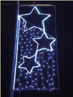
A la fotografia, un detall de la decoració Nadalencia del carrer Boratuna.

L'Ajuntament va adquirir una nova decoració lumínica Nadalencia de LED'S, que aquest Nadal 2017 es van col·locar en alguns carrers, a disseminats i les entrades dels pobles de Montcal i Adri. Amb aquesta actuació, a banda de l'estalvi energètic que suposa, es pretén modernitzar i embellir el municipi en dates tan assenyalades.