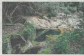
Les gorgues de Canet d'Adri són un espai protegit i un dels atractius turístics del municipi.