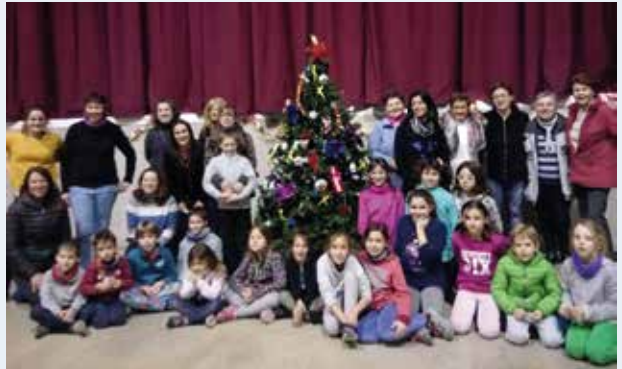
Fotografies del taller nadalenc " Decorem l'arbre de nadal ", on podem observar les guanyadores de la nadala, l'arbre decorat i els participants que ho van fer possible!