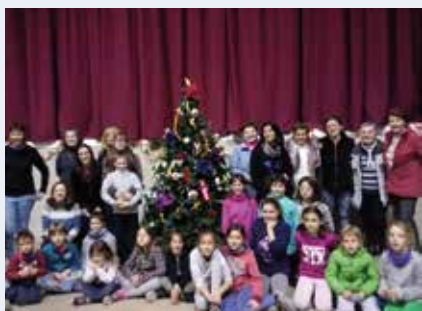
Taller popular "Decorem l'arbre de Nadal" celebrat al pavelló municipal el dijous 14 de desembre de 2017.