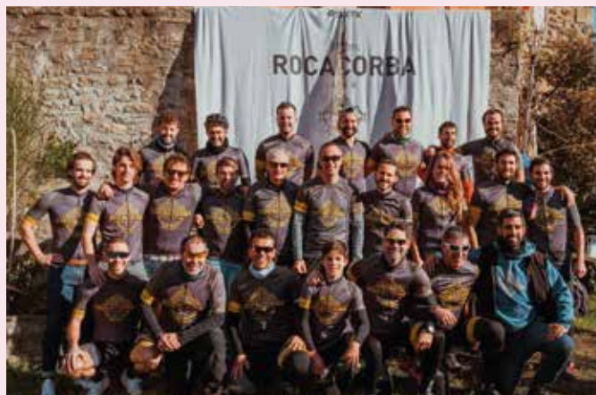
A la foto, en Maties de Biert amb alguns veïns de Canet d'Adri amb el nou mallot de ciclisme de la marca Rocacorba