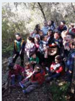
Sortida infantil "Anem a buscar el tió!" el dissabte 16 de desembre de 2017.