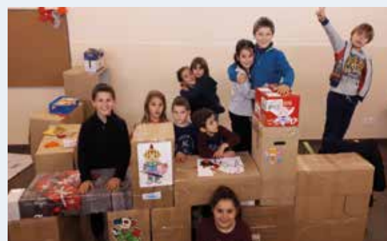
Taller infantil "Construïm un castell amb caixes de cartó reciclades" fet als baixos de l'ajuntament de Canet d'Adri el divendres 26 de gener de 2018. Els nens han pogut gaudir de la seva petita fortalesa al llarg de tota la temporada, com es pot veure durant la "Celebració del dia de la pau", el dimecres 31 de gener, on els nens van cantar la cançó "Podries" del grup Roba Estesa.