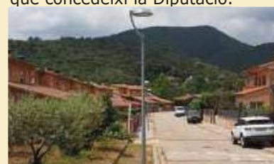
Llumeneres de tecnologia LED del carrer Camí del Jordà.

substituir 47 llumeneres (Av.Rocacorba, c/Pla de l'Estanyol, c/Ms Josep Palou) que quedarà condicionat a l'atorgament de la subvenció que concedeixi la Diputació.