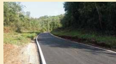
Fotografia de les franges de protecció contra incendis al camí de Montbó.