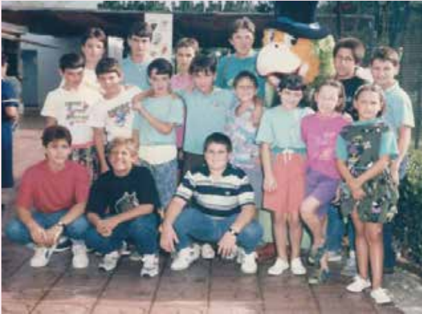
Sortida amb gent de Canet, Cartellà i Montcal al parc aquàtic de Marineland (Palafolls) a l'any 1990.