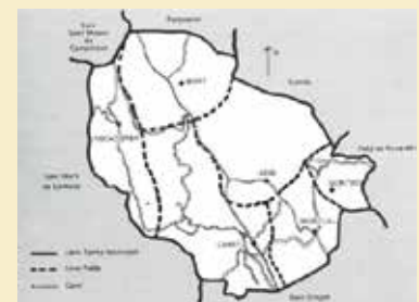
Divisió del municipi de Canet d'Adri, mapa extret del llibre "Canet d'Adri, historia dels pobles del municipi" de Jaume Marquès i Casanovas.

En aquest sentit, s'informa als propietaris i veïns que el projecte està al seu abast als efectes de consulta i examen, i que una vegada s'hagi pres l'acord d'aprovació inicial, es podran presentar al·legacions, si es considera oportú, i el projecte quedarà pendent de la seva aprovació final.