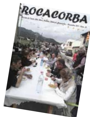
Edició anterior (Desembre 2017)