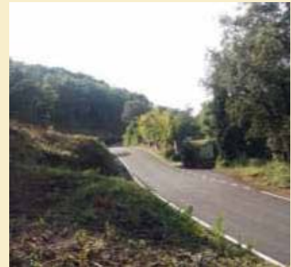
Resultat final de la primera fase d'obra de la pavimentació de la carretera de Montbó.

Aquesta obra significat una important millora en les vies de comunicació pels veïns del municipi i en especial pels veïns de Montbó.