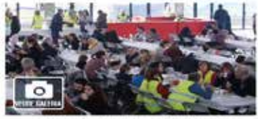
Canet d'Adri celebra la setena edició de la Fira del Porc