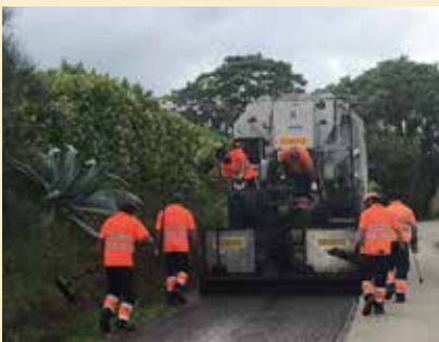
Imatge de les obres de reasfaltatge de la carretera de Montcal.

Aquest mes de maig s'ha dut a terme l'obra de reasfaltatge de la Carretera de Montcal en el seu tram des de Can Patxec a Cal Ferrer de Montcal, a càrrec de l'empresa Agustí y Masolivers, SA per un import total de 49.610€. L'actuació ha consistit en arranjar les esquerdes i forats que presentava el paviment i la irrigació d'una capa de slurry per tancar esquerdes a tot el tram.