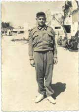
L'Àngel el segon dia de mili a Melilla. Es trobava al quartel Aria núm 9

dota en relació a aquesta construcció: per mesurar feia servir un tronc que ell creia que feia mig metre, però es veu que la pedra que li havia servit de mesura no hi arribava, de manera que la casa fa 49cm, enlloc de 50cm com estava previst.