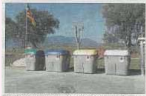
Els diferents contenidors per reciclar, en una de les zones del municipi de Canet d'Adri.