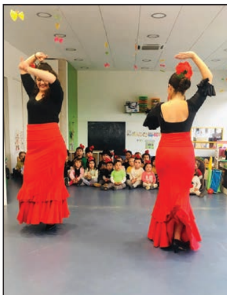
Sevilla: ballem sevillanes.