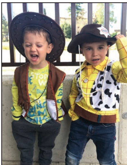
Texas: ens vestim de cowboys i ballem country