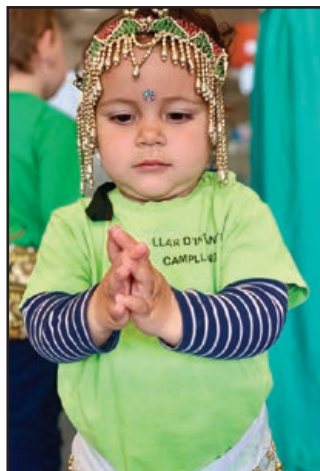
Índia: ballem dansa del ventre

Esperem que passeu un bon estiu i tal i com diu la cançó: "Vi- atjant per tot el món, he après coses de tothom".