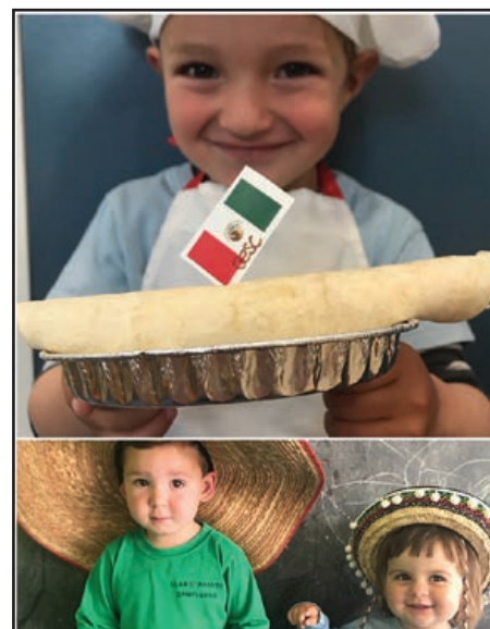
Mèxic: taller de fajitas