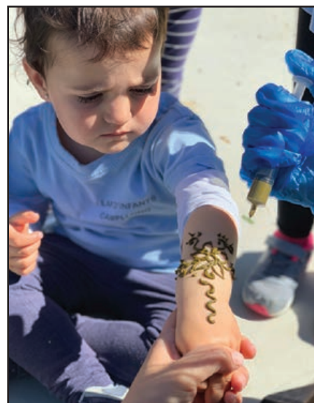
Marroc: Taller de henna.