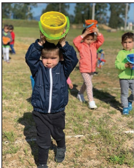
Kènia: agafem herba amb els cubells al cap