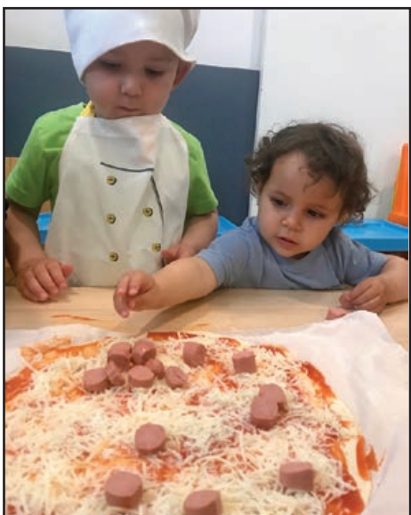
Itàlia: taller de pizzas.