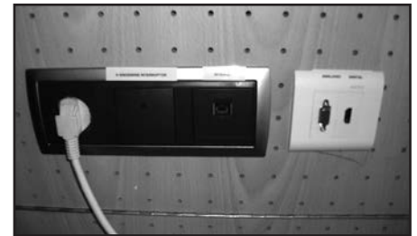
Connexió analògica i digital al projector