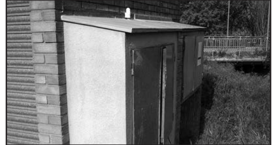
Nou armari construït