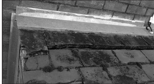
Estat de l'armari abans de reconstruir-lo