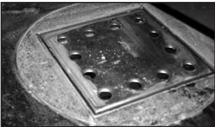
Desguàs sifònic instal·lat a la cuina

A finals de gener es va instal·lar un sistema de desguàs al paviment de la cuina del Bar-restaurant del Local Social per facilitar la neteja de la cuina i també es va col·locar una porta de PVC blanc, corredora i plegable (tipus acordió) per independitzar els serveis higiènics de la cuina. Per altra banda, durant l'abril es va fer una instal·lació a l'escenari la nova sala polivalent del Local Social que permet connectar ordinadors amb el projector en analògic i digital. La instal·lació s'ha integrat a la paret per facilitar-ne la manipulació i l'ús per part dels usuaris del projector.