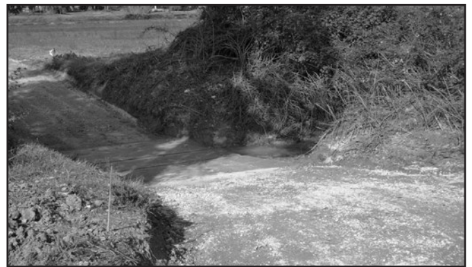
Adequació d'un passallís