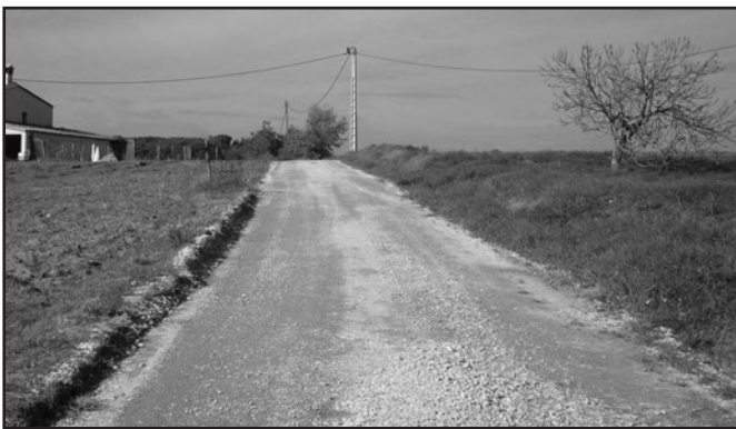
Arranjament del ferm

També s'han executat dos passallissos a través de la pavimentació amb formigó reciclat en massa; un d'ells al camí que va de la carretera C-25 fins a Can Guitó i l'altre, al camí de Can Guitó, en el punt que creua amb la riera de Campllong.