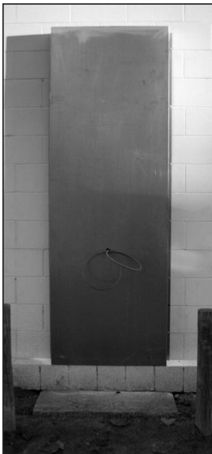
Actuació prèvia a la instal·lació

Prèviament a la instal·lació d'aquest equipament, es va haver de construir una base de formigó per tal de disposar d'una superfície anivellada per permetre la subjecció de la columna, es va instal·lar una xapa galva per poder recolzar correctament la columna a la paret, es van fer les actuacions necessàries per garantir el subministrament elèctric a l'equipament i es van col·locar dues pilones de fusta a la part frontal per evitar les topades dels vehicles amb la columna.