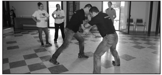
Demostració dels professors

manal de ioga, a 2/4 de 9 s'inicia l'assaig dels timbalers i grallers del poble i a 2/4 de 10, es fa una classe molt moguda de Country.