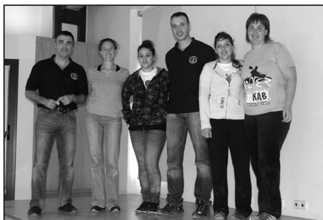
Moment del curs de defensa personal

Els divendres a la tarda pel local passen molts nens. A 1/4 de 6, els més petitons (d'uns 6 anys) fan una classe d'iniciació a la música. Seguidament, els infants més grans (7 anys) fan la classe de sensibilització. I per últim hi ha dos alumnes de sensibilització que fan classe particular de piano! A 1/4 de 8 s'inicia la classe set-