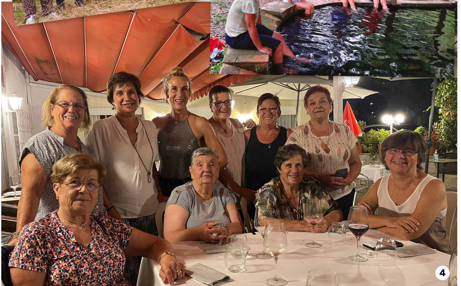
1. A les Estunes. 2. A Sta Magdalena. 3. Refrescant els peus. 4. Sopar a Can Roca d'Esponellà