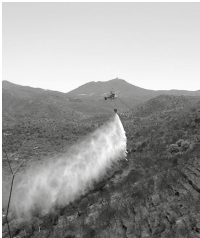
Helicòpter descarregant a la carretera de Sant Pere de Rodes, amb el Pení al fons.

Quan hi ha foc, en els primers instants, les ADF's properes hi acudeixen ràpidament per intentar controlar-lo i tirar les primeres línies. En un escenari de gran incendi, una ADF pot actuar quan els grups de coordinació demanen disponibilitat.