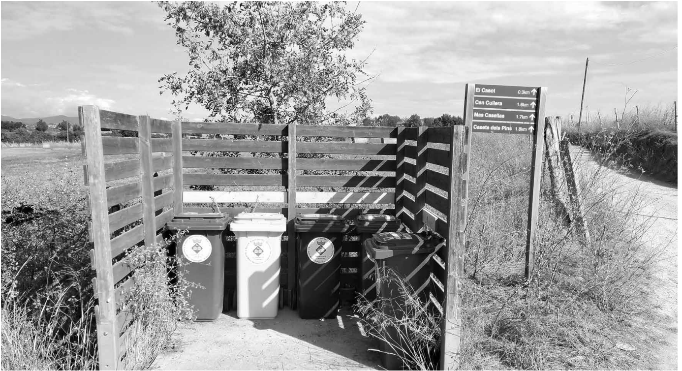
Al trencant del Casot

Els canvis en la recollida selectiva i el tractament de les deixalles s'està consolidant.