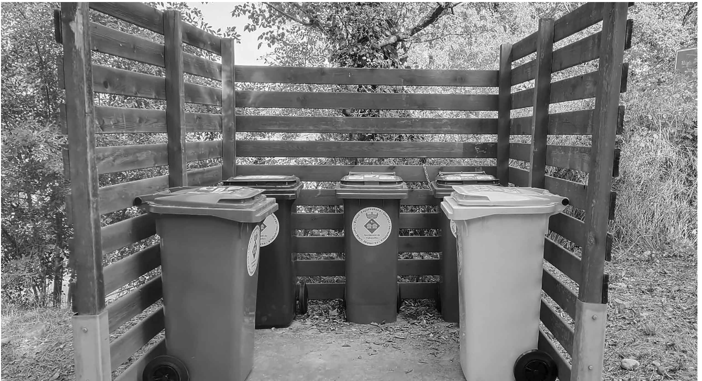
Cases del Can Vilar