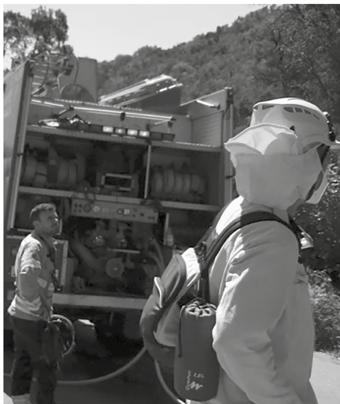
Durant l'incendi, bombers i ADF's col·laboren estretament