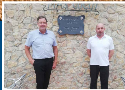
Homenots MAS CUCUT