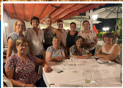
Les Dones de Cabanelles