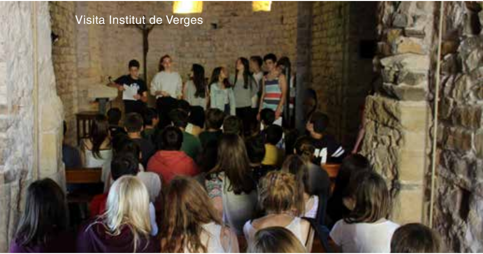
Visita Institut de Verges