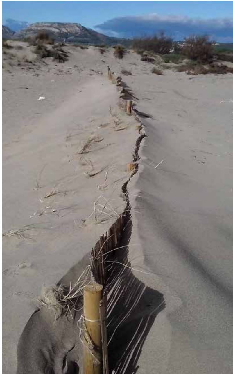
Fixació de les Dunes del Parc Natural

suficient pluridisciplinarietat de tècnics que puguin abarcar la diversitat d'aquests espais (agrari, terrestre, marítim, forestal). Necessitem un equip que pugui abastar aquestes àrees de coneixement per donar un bon servei, una vigilància adequada per evitar mals usos amb el medi i/o activitats incompatibles unes amb les altres.