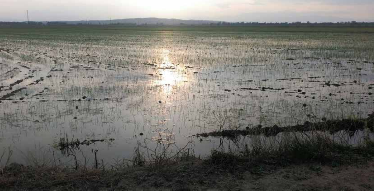
Cap vespre en els arrossars, Parc Natural

estem parlant de Bellcaire, d'Ullà i de Torroella.