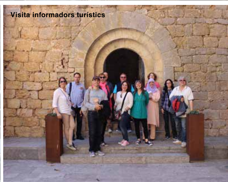
Visita informadors turístics