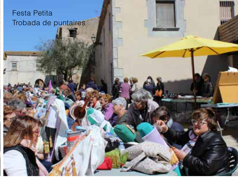
Festa Petita Trobada de puntaires