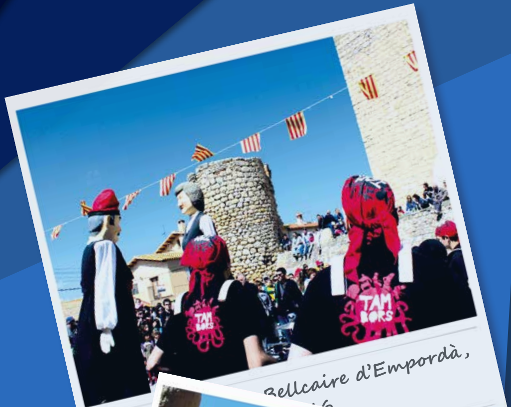
Bellcaire d'Empordà, 2016