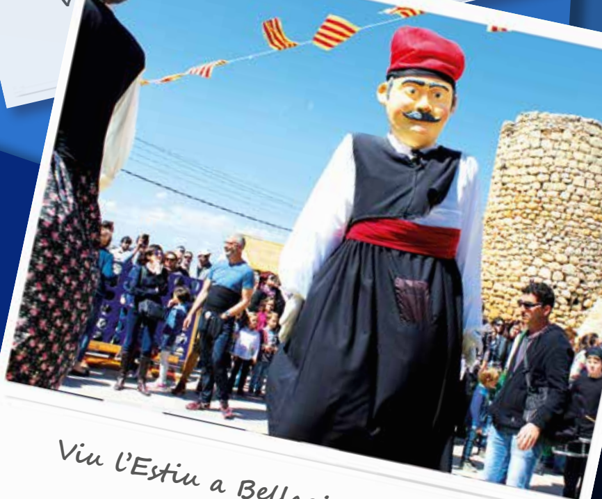
Viu l'Estiu a Bellcaire d'Empordà, 2016