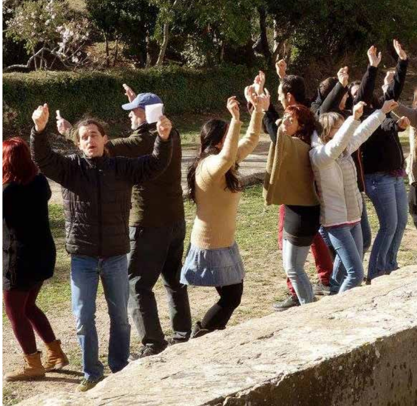
Moment de la celebració La Robertiada