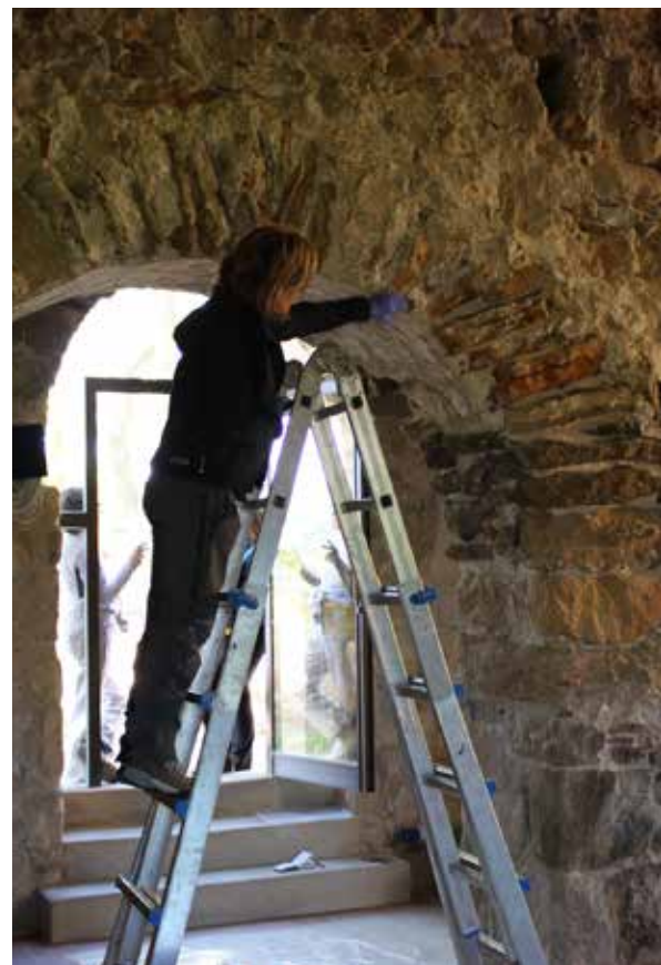
Consolidació d'una de les voltes

La intervenció ha estat realitzada per l'empresa 4Restaura i el seu cost ha estat assumit per la parròquia.