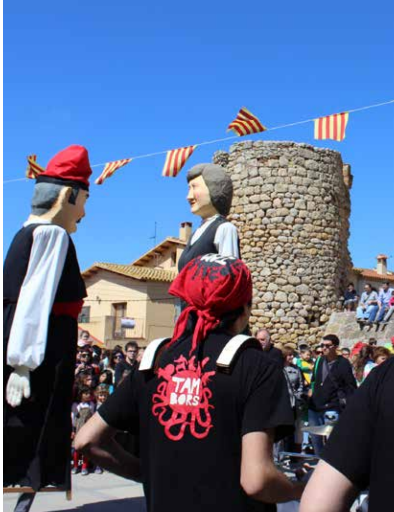
Tambors i Ball dels Gegants de Bellcaire

La festa havia engegat el divendres amb l'actuació del musical "Un estiu a la platja - El musical de l'Escala". El dissabte va ser el dia més tradicional