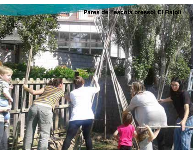
Pares de l'escola bressol El Rajolí