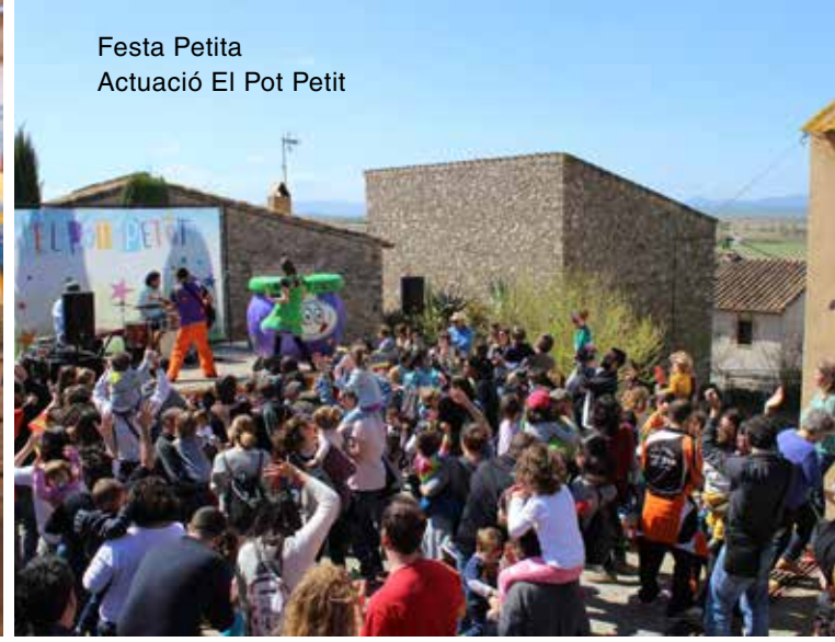
Festa Petita Actuació El Pot Petit