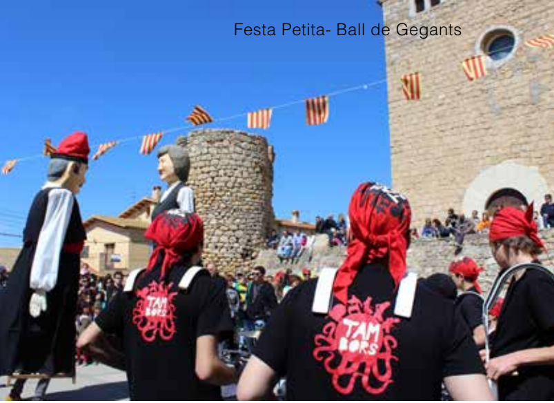
Festa Petita- Ball de Gegants