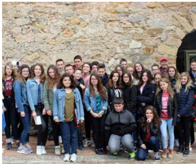
visita d'estudiants francesos

El 7 de juny va venir un altre grup, aquest cop de guies turístics. A diferència dels informadors, als guies turístics la formació és més intensa, donat que han de ser capaços no només de donar informació de qualitat als visitants si no que també els han de poder acompanyar i mostrar la riquesa de l'entorn in situ.