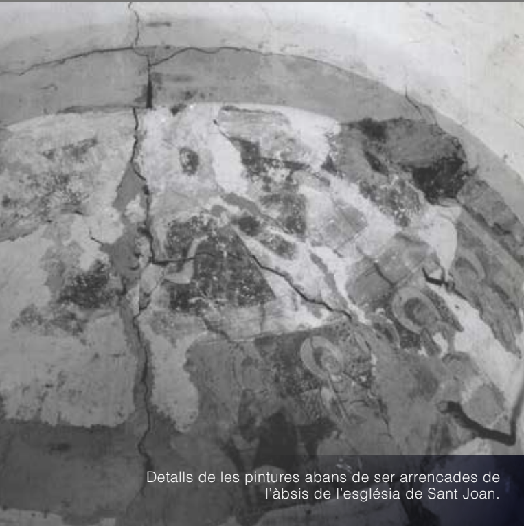
Detalls de les pintures abans de ser arrencades de l'absis de l'església de Sant Joan.