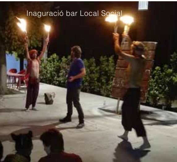
Inaguració bar Local Social