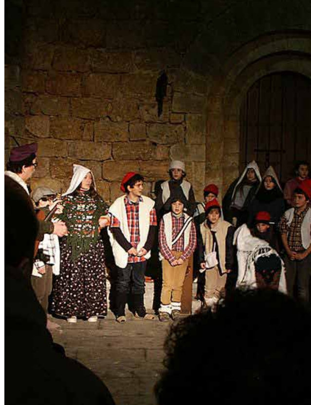
Moment del Pessebre vivent cantat

Especialment emotius i intensos van ser els temes que van interpretar junts catalans i gascons, tot demostrant unes afinitats i compenetració extraordinàries.