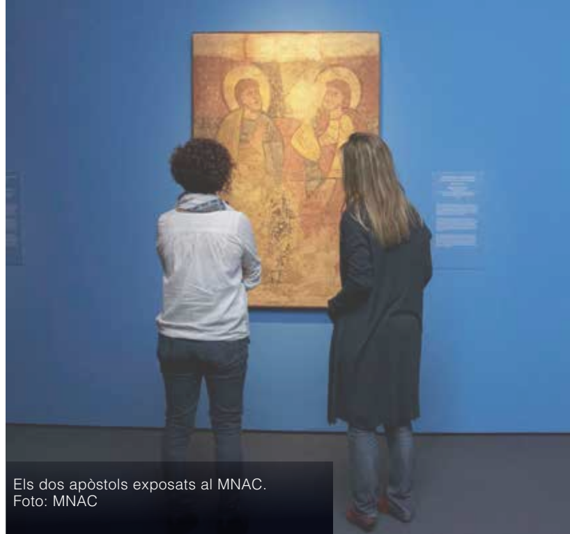
Els dos apòstols exposats al MNAC.