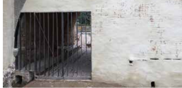
Accés al safareig, des del rec del Molí

El safareig municipal es va construir, amb autorització de la propietat d'aquell moment, en un sòl de titularitat privada. Si bé l'ús com a safareig i abeurador d'animals ja fa anys que ha desaparegut, s'ha considerat convenient signar un conveni que doti de seguretat jurídica ambdues parts (Ajuntament i propietat) fent constar l'ús municipal d'aquesta finca privada i compromentent-se l'Ajuntament a mantenir en condicions de neteja aquell espai i a divulgar-ne l'ús històric que se'n va fer.