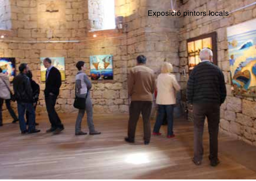
Exposició pintors locals