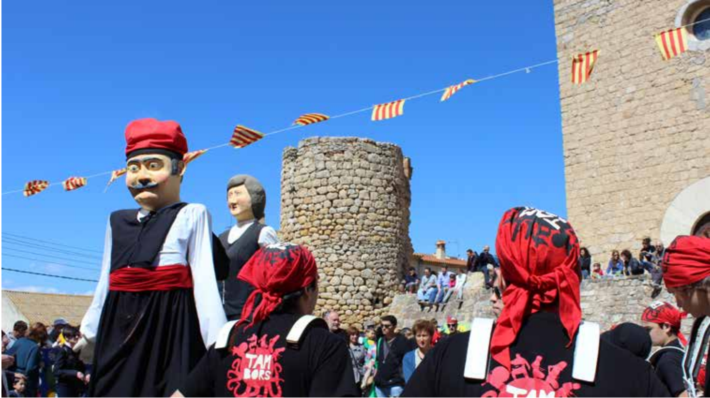
Fira Escolar i Festa Petita