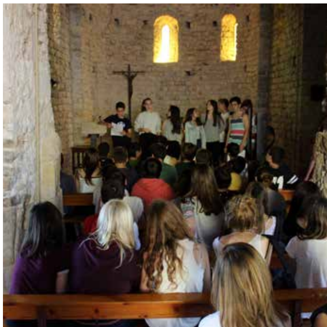
visita institut de Verges