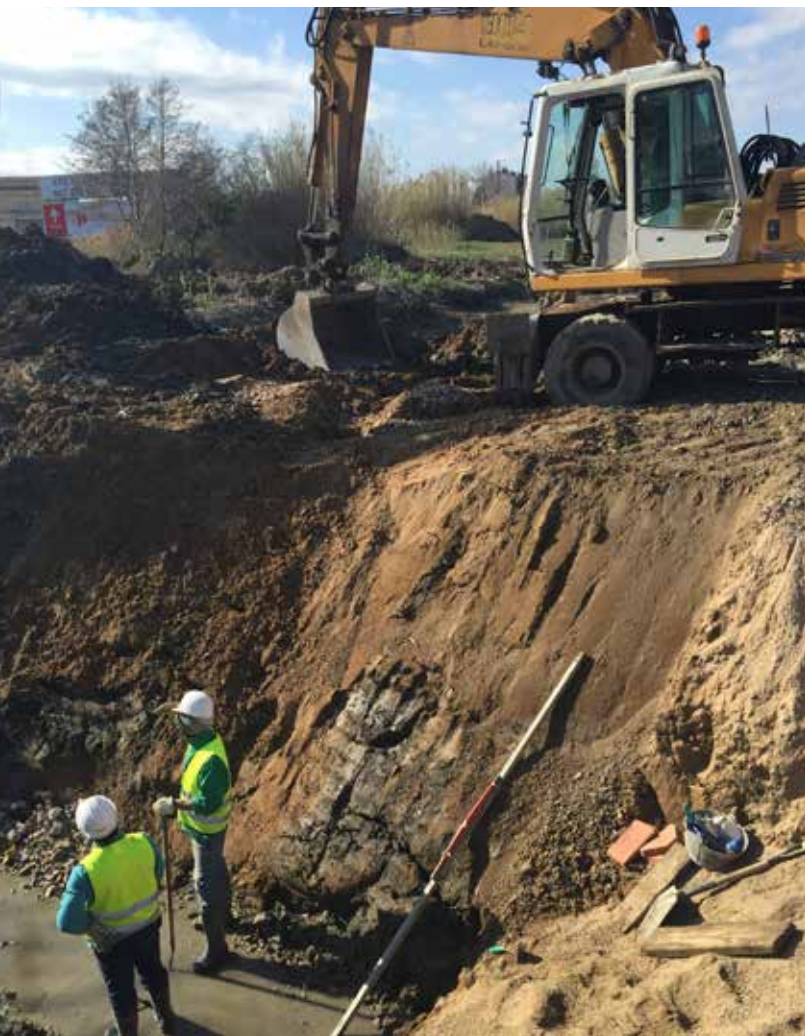
Obres de connexió a la depuradora