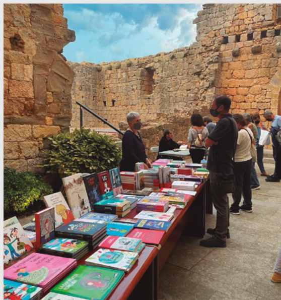
Plaça del Castell de Bellcarie

Cucut de Torroella de Montgrí que va aportar un fons d'autores clàssiques i contemporànies en tots els formats, tant de les editorials presents com de les no presents a plaça amb una representació molt nodrida d'àlbums il·lustrats de li-