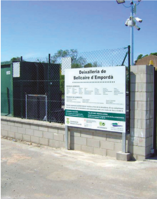
Deixalleria Bellcaire actual.

de 2023/24, ja que l'Ajuntament ha d'assumir un cost aproximat de 40.000 euros, els quals no preveu tenir disponibles durant aquests dos propers anys. Si bé els preveu disponibles a partir del 2024 que ja s'haurà executat el PUOSC i s'hauran liquidat les anualitats pendents per la compra de ca la Pepeta (Mas Quintana).