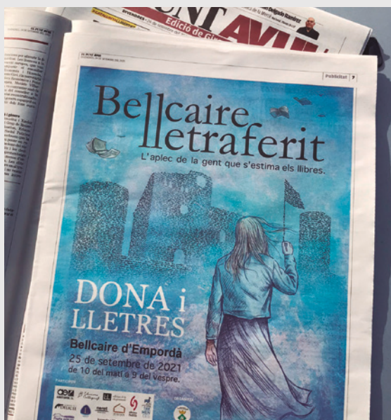
Anunci diari Avui de l'edició de l'Aplec 2021

Ela Geminada, Voliana, Edicions Sidillà, Albertí Editor, Lapslàtzuli, Llibres del Delicte, Edicions Tremendes, Tèmenos editor, Neret editorial, Cal·lígraf, Pagès editors) sumant-hi el quiosc de l'APPEC amb tota la premsa en català i la revista Sàpiens fent una valuosa aportació amb el Manifest NO EREN BRUIXES, EREN DONES https://www.sapiens.cat/revista/no-eren-bruixes_204337_102.html que fou llegit a migdia a la Plaça del castell. Vull destacar també la presència de suport al llibre de la llibreria El