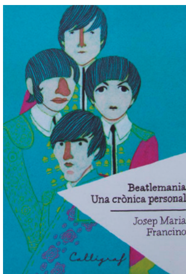
Portada del llibre Beatlemania. Una crònica personal

Estic segur que si l'hagués sentit li hauria agradat aquesta adaptació al català que vaig fer de la famosa cançó When I'm sixty four dels Beatles que tan estimava.