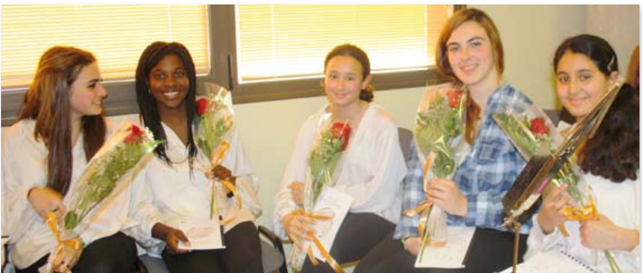
Coral Jove Les Veus del Fluvià.