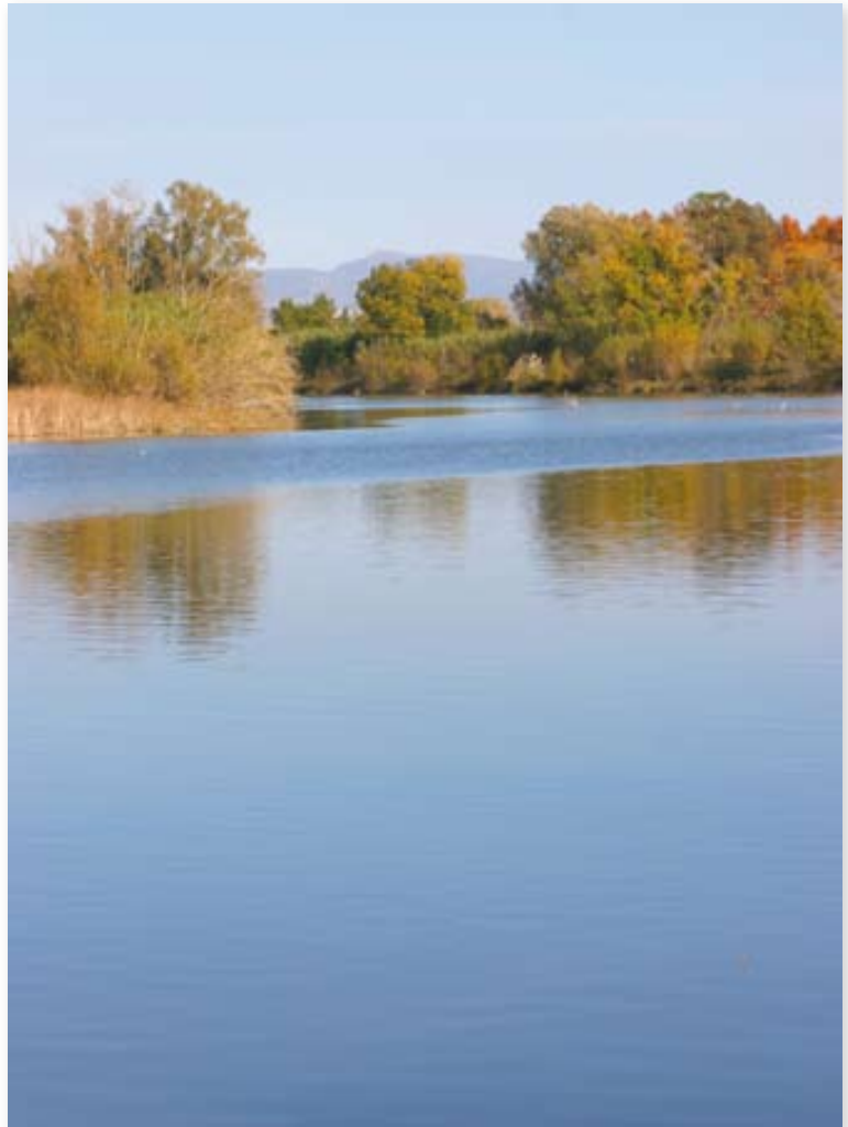
El Fluvià al seu pas pel municipi de l'Armentera.

L'extracció de l'aigua del pou s'aconseguí d'antuvi (ben segur que no fa ni un segle) mitjançant les bombes de