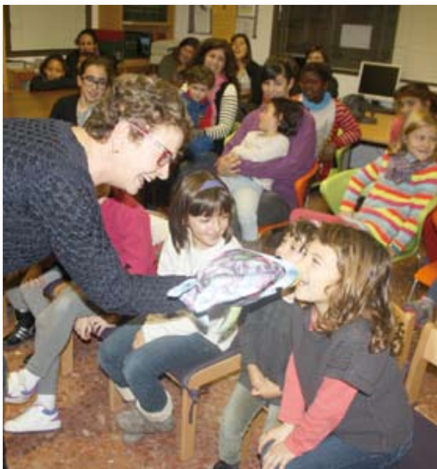
Tarda de contes amb l'Agnès.

En acabar el 2013 començarem el nou any amb dues tardes de contes a la biblioteca amb l'Agnès, la Christel i la Roser, davant d'un públic infantil molt engrescat.