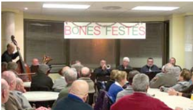
El grup Calidae en plena actuació.

En primer lloc, la Torronada. Com cada any vam celebrar aquesta festa tradicional, com podeu veure a les fotos, amb una colla de magnífics músics, el grup Calidae, que van actuar en viu per a tots nosaltres, i ens van fer passar una agradable vetllada.