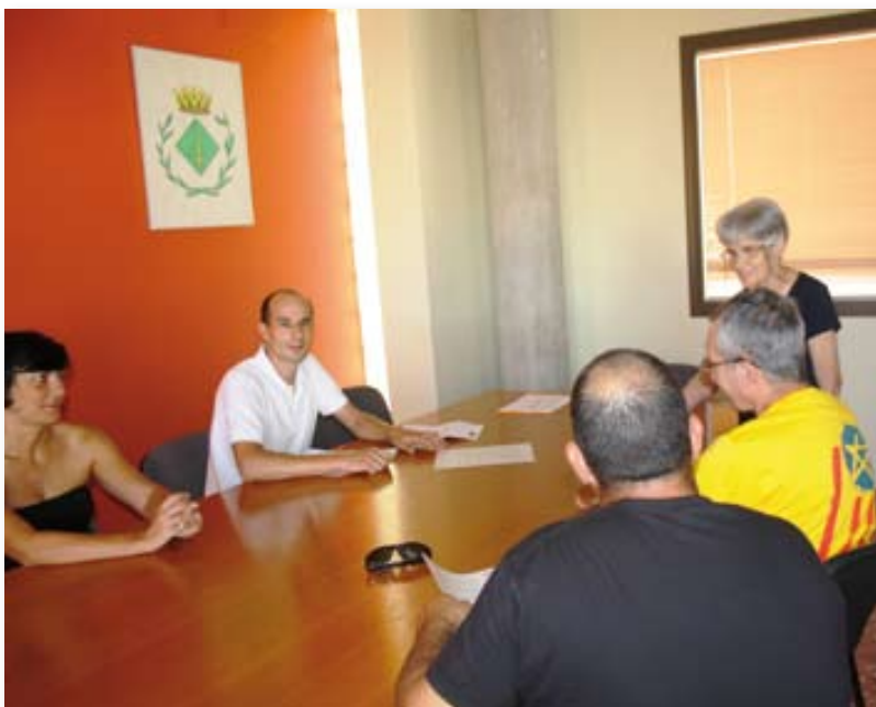
Entrega del manifest a favor del Dret a Decidir del Poble de Catalunya.

L'11 de setembre la nostra Associació, com a entitat legal i pública, va signar i fer entrega d'un manifest a favor del Dret a Decidir del poble de Catalunya als representants de l'Ajuntament perquè el fes arribar al Parlament de Catalunya.