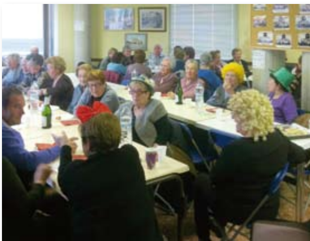
Els assistents, amb alguna disfressa, van poder gaudir d'un bon berenar i d'una bona companyia.

El 7 de febrer, el Dijous Gras, es va fer berenar molt ben organitzat i millor degustat.