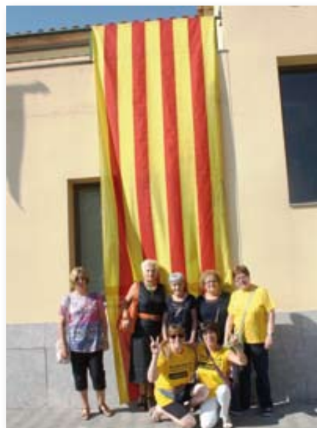
Representants de l'associació, l'11 de setembre davant de l'Ajuntament de l'Armentera.