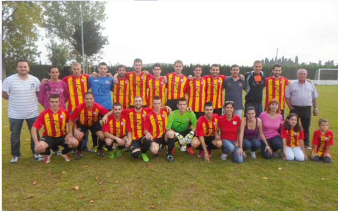
Foto de la temporada 2013/2014.

El futbol representa, en aquest cas, l'esperit d'un poble. Identitat, afició i confiança. Identitat, perquè els jugadors et representen allà on van. Afició, perquè quan s'emplena el camp de gent del poble, per moltes diferències que puguem tenir, tots anem a una. I confiança a tots aquells que estan darrere dels jugadors, d'aquells que la gent no veu, però que hi són, dels quals són la junta directiva i la gent que desinteressadament sempre ve a donar un cop de mà. Així doncs, no tot el que hi ha en el futbol, és futbol. Hi ha amics, riures, plors i amors.