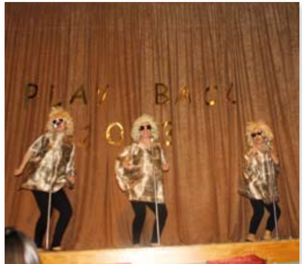
Las Supremas de Móstoles.