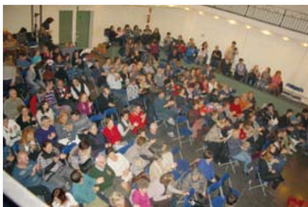
El públic a la Sala Nova.

Aprofitem també per convidar-vos a les properes representacions.