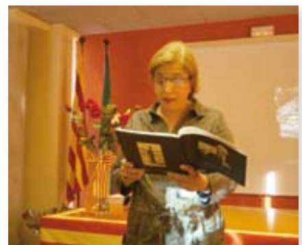
Lectura de poemes.