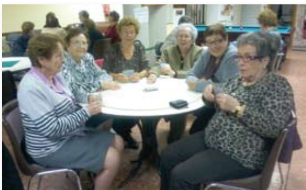
Un grup de senyores jugant a cartes en el seu dia a dia del Casal.