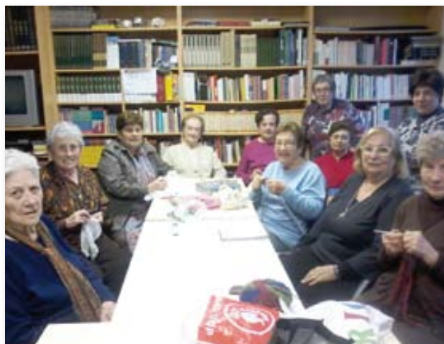
Treballs manuals a la biblioteca del Casal.