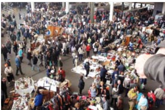
Una imatge del Mercat dels Encants de Barcelona.