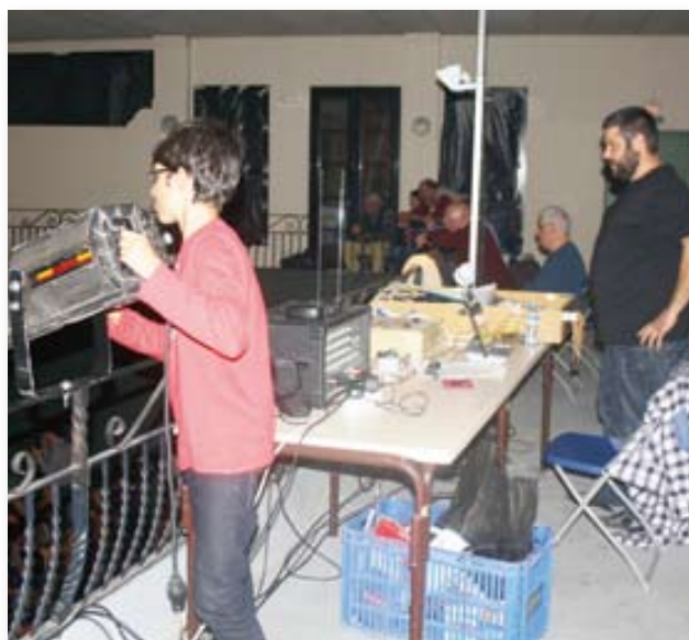
Llum i so.