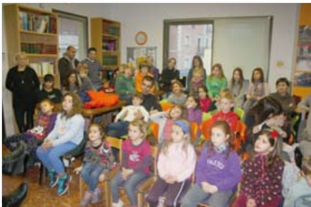
Tarda de contes a la biblioteca.