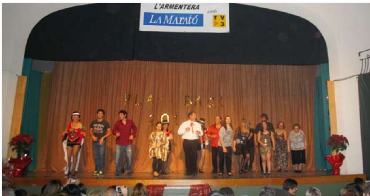
Tots els participants.