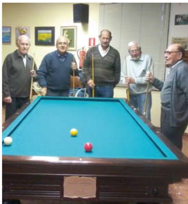
El dia a dia d'alguns senyors.

No voldria finalitzar aquest escrit sense dedicar un especial record a tots els socis i sòcies absents, els quals trobarem a faltar. Estaran sempre presents en els nostres cors.