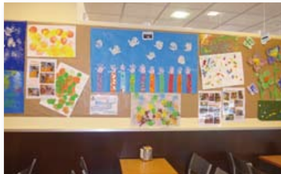
Fotos i treballs realitzats pels nens i nenes de la guarderia.

Des d'aquí volem donar les gràcies a tots els artistes que desinteressadament han cedit les seves obres.