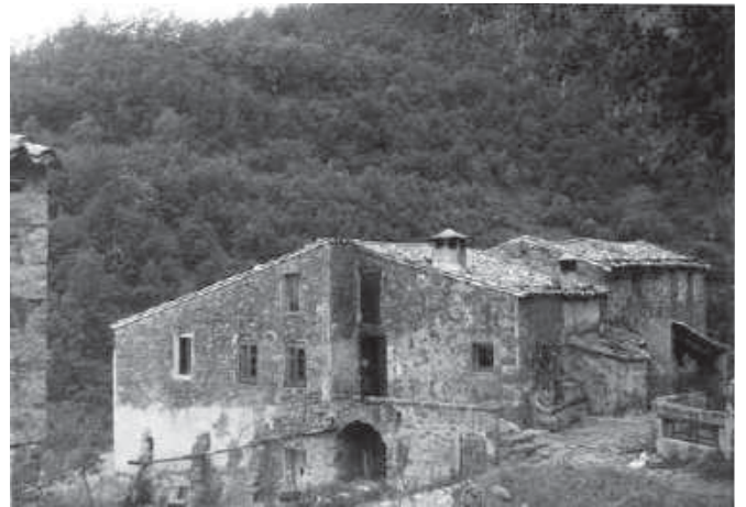
L'hostal de la Muga els anys cinquanta.