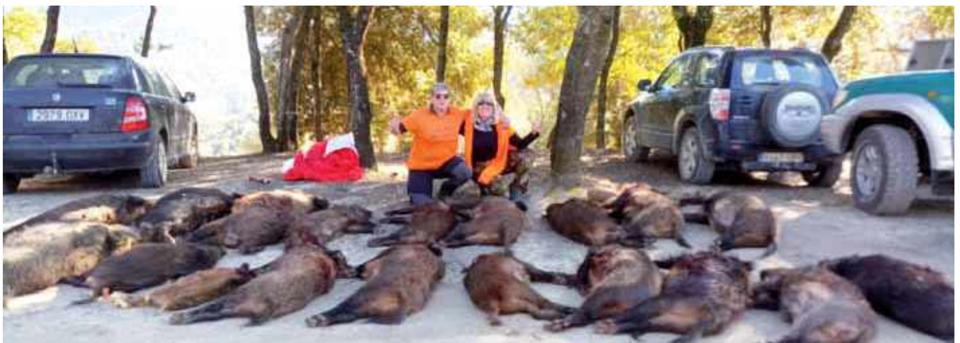
Cacera conjunta amb caçadors de Tortellà, Montagut, Begudà i Argelaguer

La caça no és només el fet d'anar a caçar. Primer hi ha tota la preparació de la batuda, que es fa uns dies abans, tot seguit la cacera en si i, per acabar, el després de la cacera, on es comenta com ha anat la jornada. Un cop acabada la temporada de caça comença una altra activitat que acostuma a durar un parell de mesos i que no descuidem mai, és la neteja i conservació dels camins i carreteres perquè no es perdin.