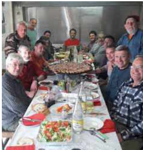
Caçadors Colla d'Argelaguer

En l'actualitat la fauna ha fet un canvi molt important. Anys enrere els nostres camps i boscos estaven plens de conills i perdus i el senglar era una espècie escassa. En l'actualitat els papers s'han invertit, els conills afectats per malalties han passat a ser una espècie testimonial. El mateix ha pas-