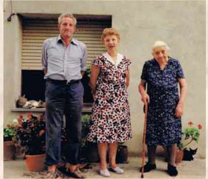
Amb l'àvia, davant de la casa del Pont l'agost de 1992