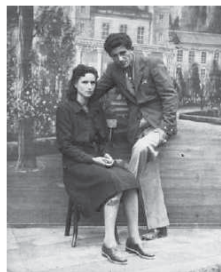
La Carme i en Salvi, el 1943