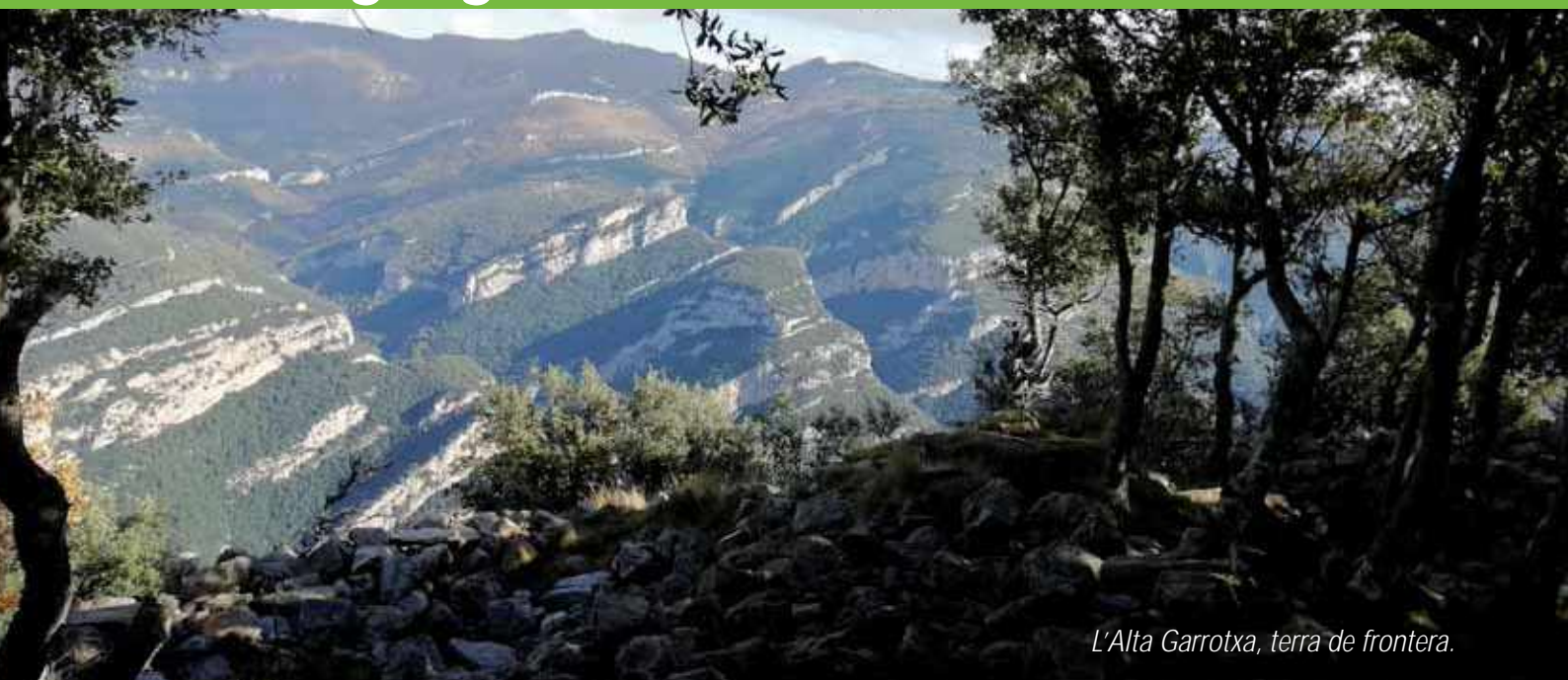
L'Alta Garrotxa, terra de frontera.